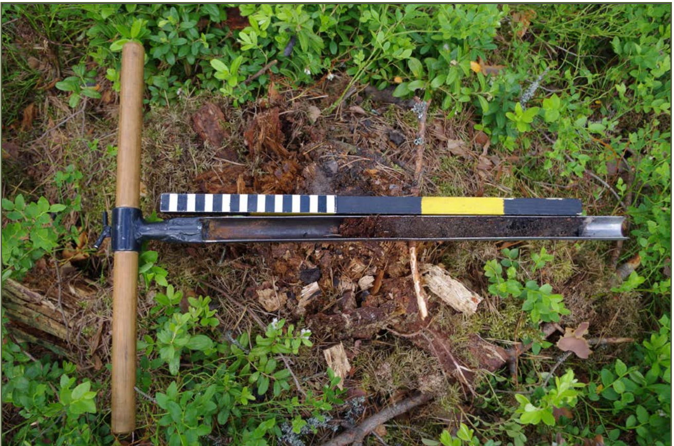
Kuva 2: Miiluun alueelta otettu kairausnäyte sisälsi noensekaista hiekkaa, puuhiiltä ja pohjalla savea.