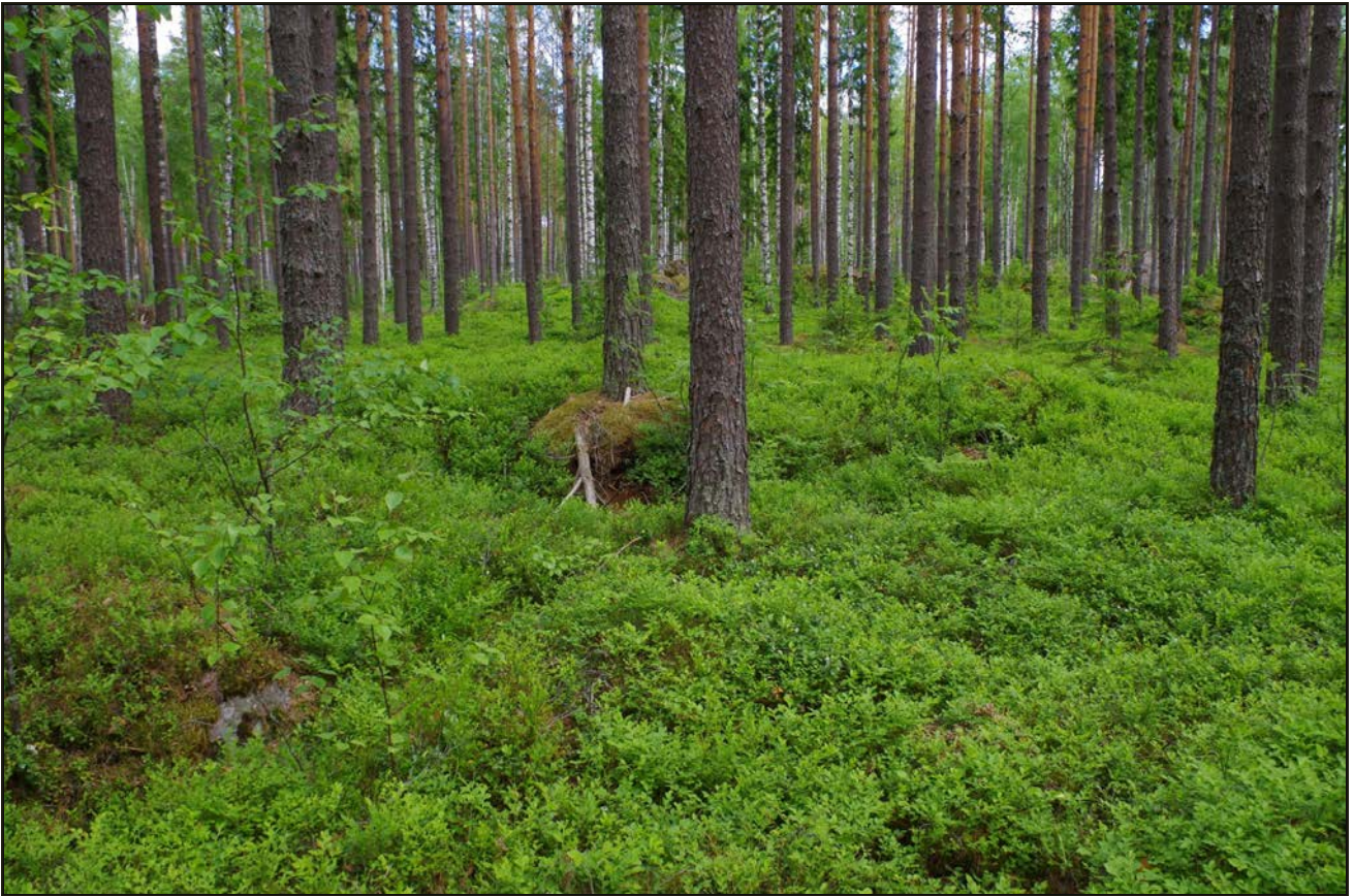
Kuva 1: Miilu suunnasta SW.