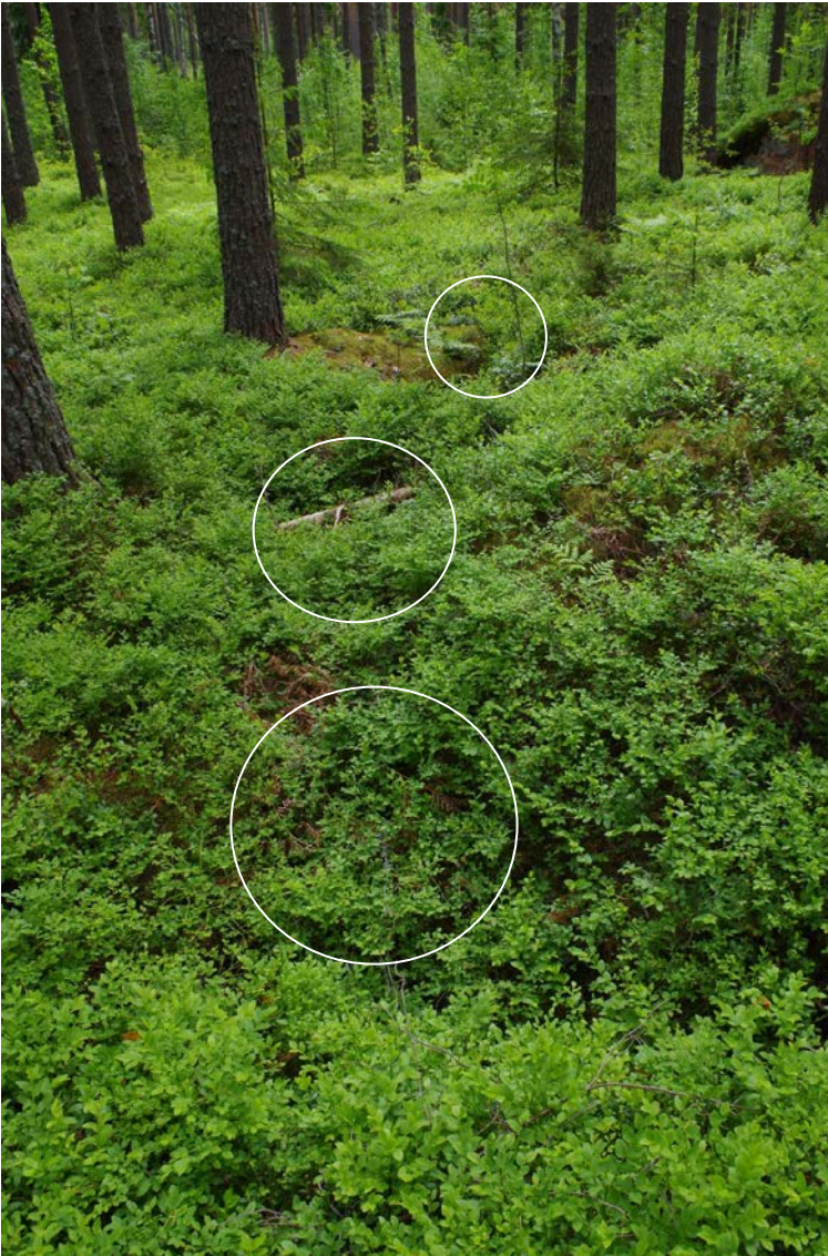
Kuva 3: Miilun E-sivustan kuoppia. N.