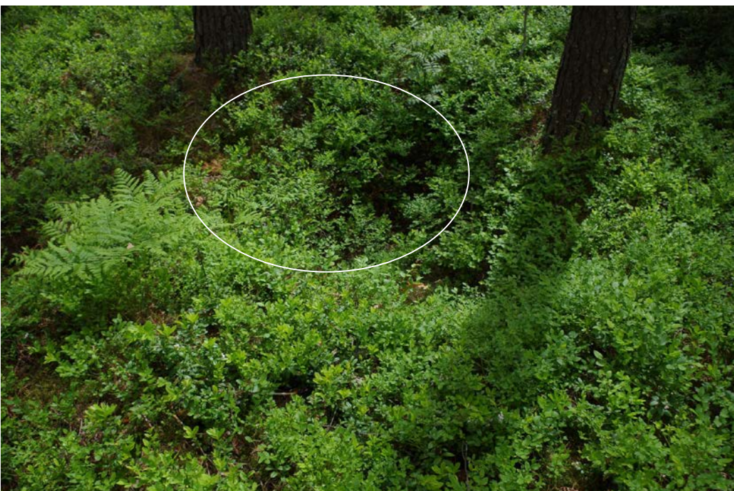
Kuva 4: Miilun E-nurkan edustalle kaivettu kuoppa. E.