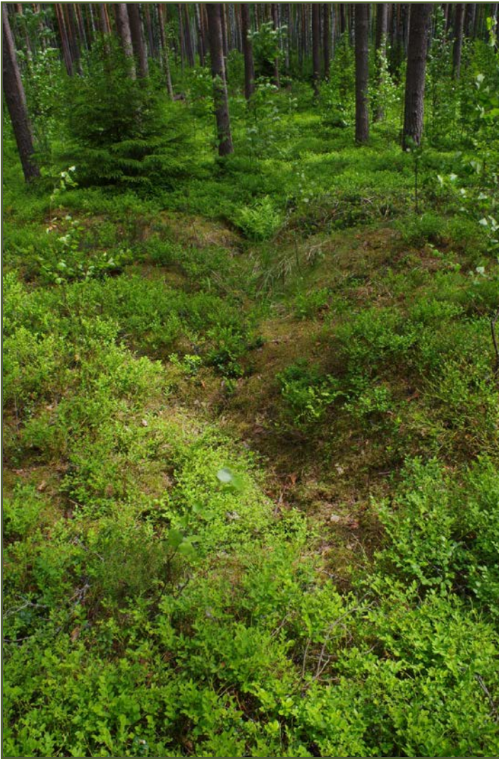
Kuva 3: Miilun NW-sivustan ojamaista kaivantoa. SW.