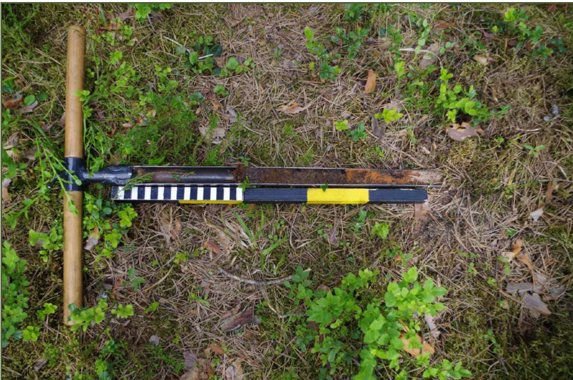
Kuva 4: Kairausnäyte miilusta sisälsi runsaasti puuhiilen paloja.