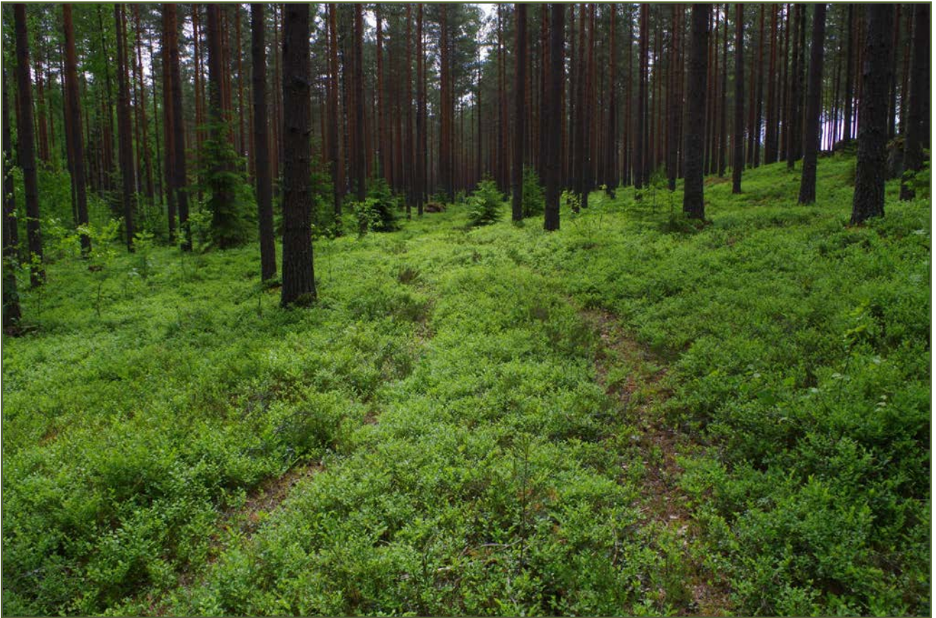
Kuva 1: Lilla Högåsbackenin kangasmaastoa miilun n:o 9 S-puolella. N.