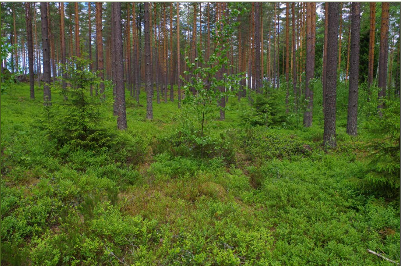
Kuva 2: Kärrytie kulkee suoraan miilun (kuvassa keskellä) ylitse. S.