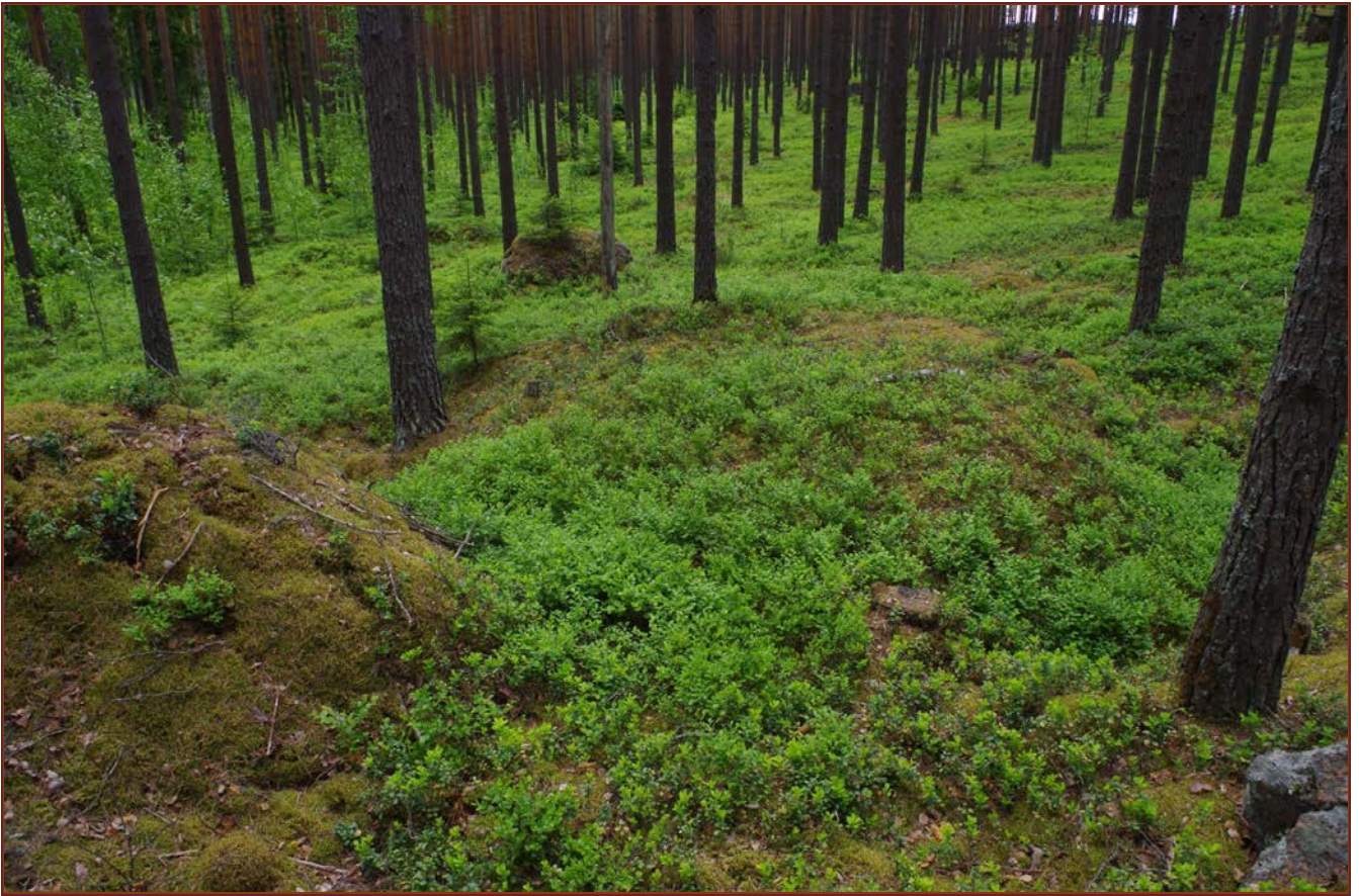
Kuva 3: Miilu suunnasta NW.