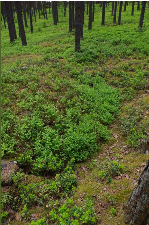
Kuva 4: Miilun W-sivustalle kaivettua ojaa. NW.