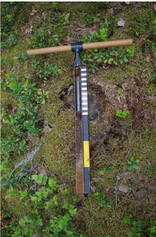
Kuva 2: Kairausnäytteessä oli steriilin pohjamaan päällä havaittavissa noen- ja hiilensekaista hiekkaa.