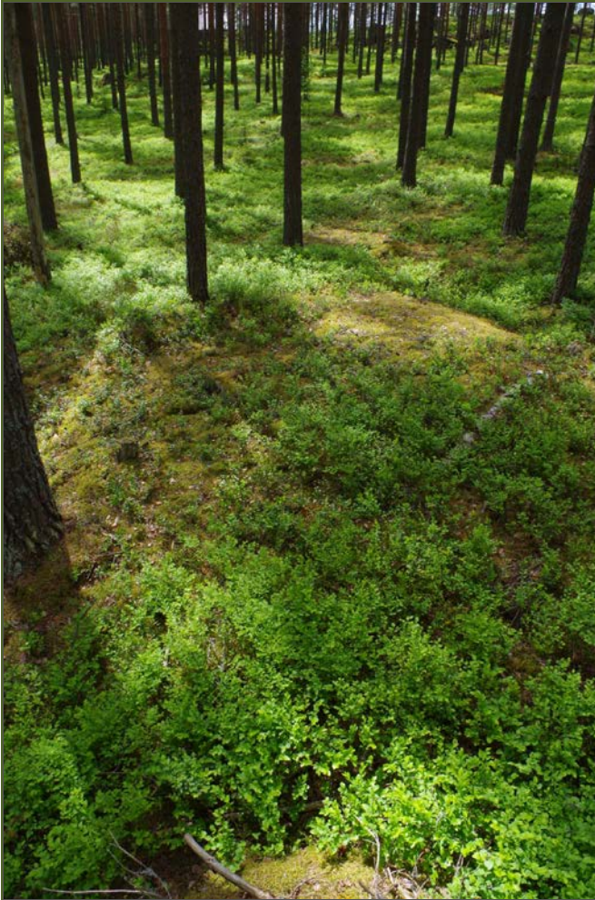
Kuva 1: Miilu suunnasta N.