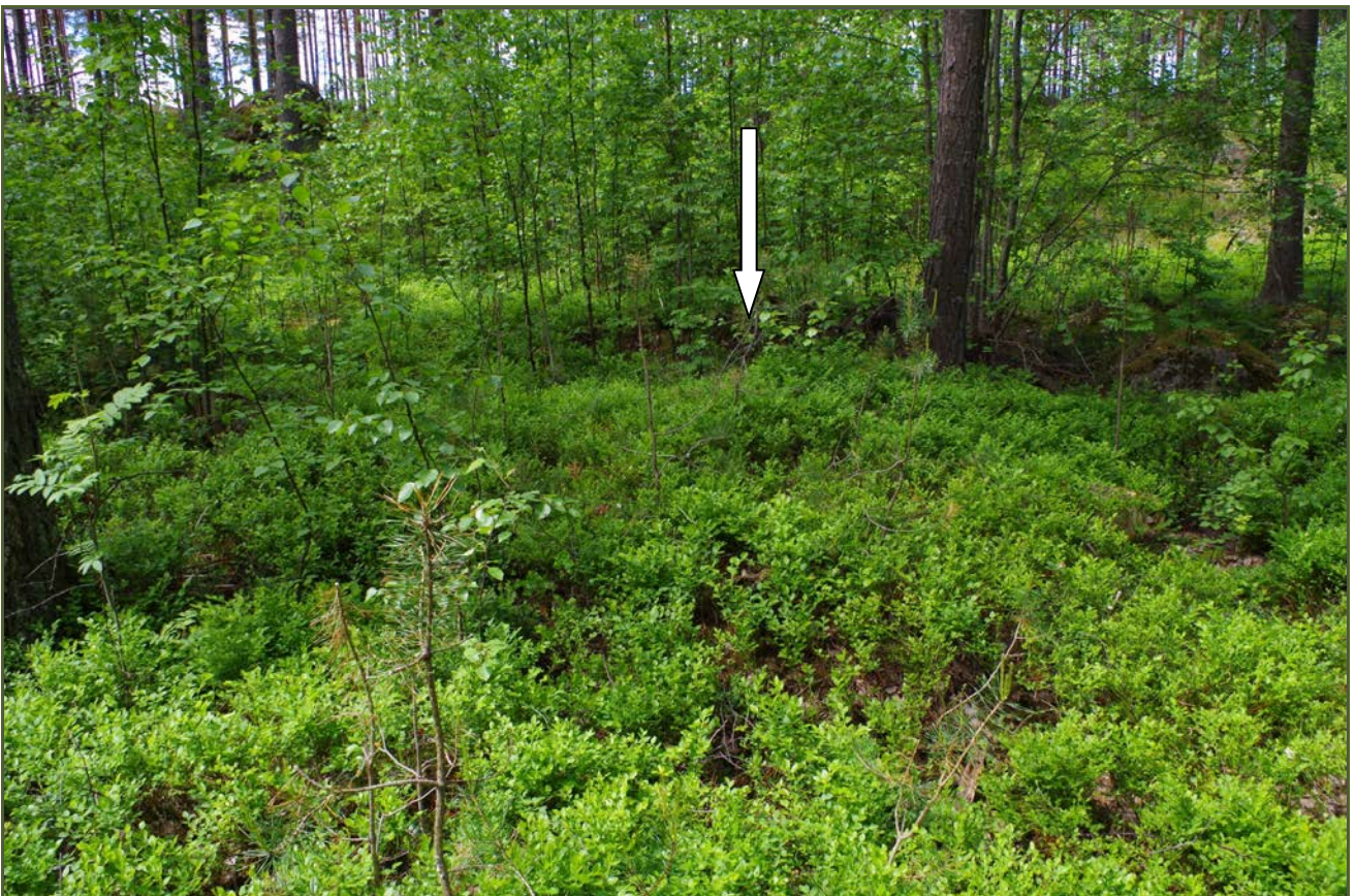
Kuva 2: Miilu suunnasta E. Nuoli osoittaa miilun keskustaa.