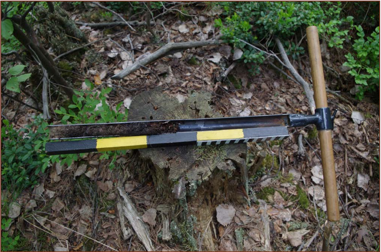
Kuva 3: Kairausnäyte miilusta. Pintaturpeen alta paljastui kahdenkymmenen cm:n paksuinen hiilen ja noen sekainen hiekkakerros, jonka alta esiin tuli likainen savi.