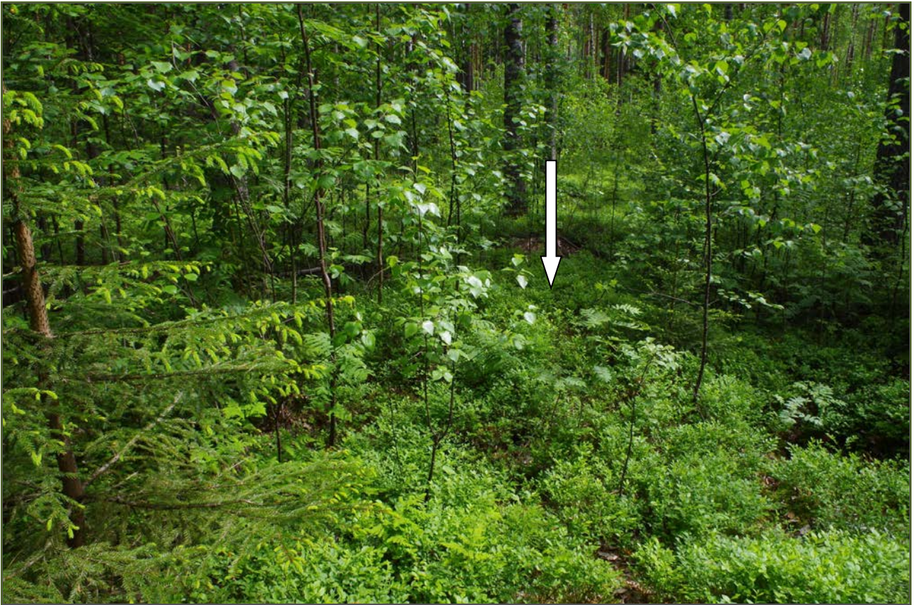
Kuva 1: Miilu suunnasta W. Nuoli osoittaa miilun keskustaa.