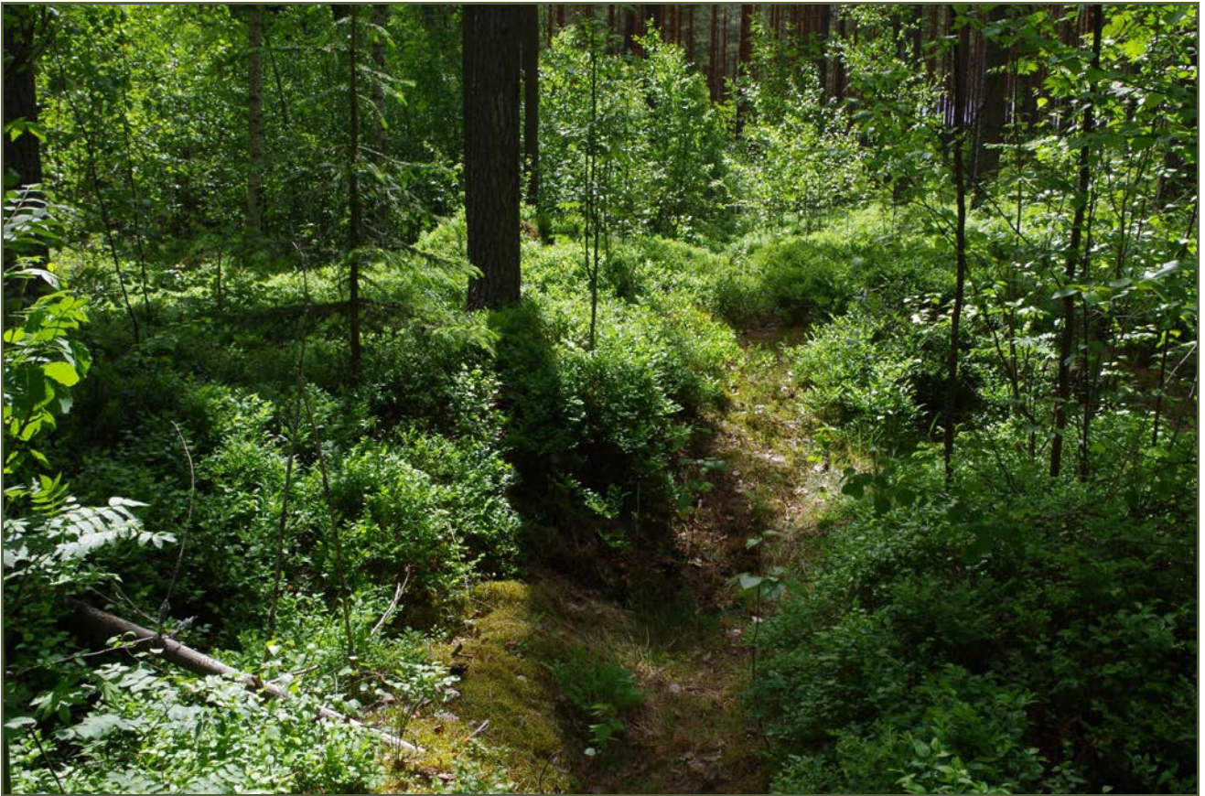
Kuva 3: Miilun rikkoutunutta SW-päätä polun/ajotien kohdalla. W.