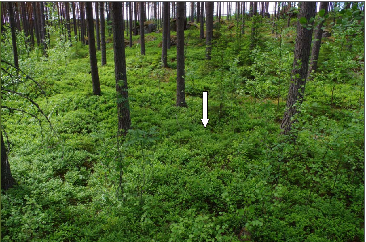
Kuva 2: Miilu suunnasta SW. Nuoli osoittaa miilun keskustaa.