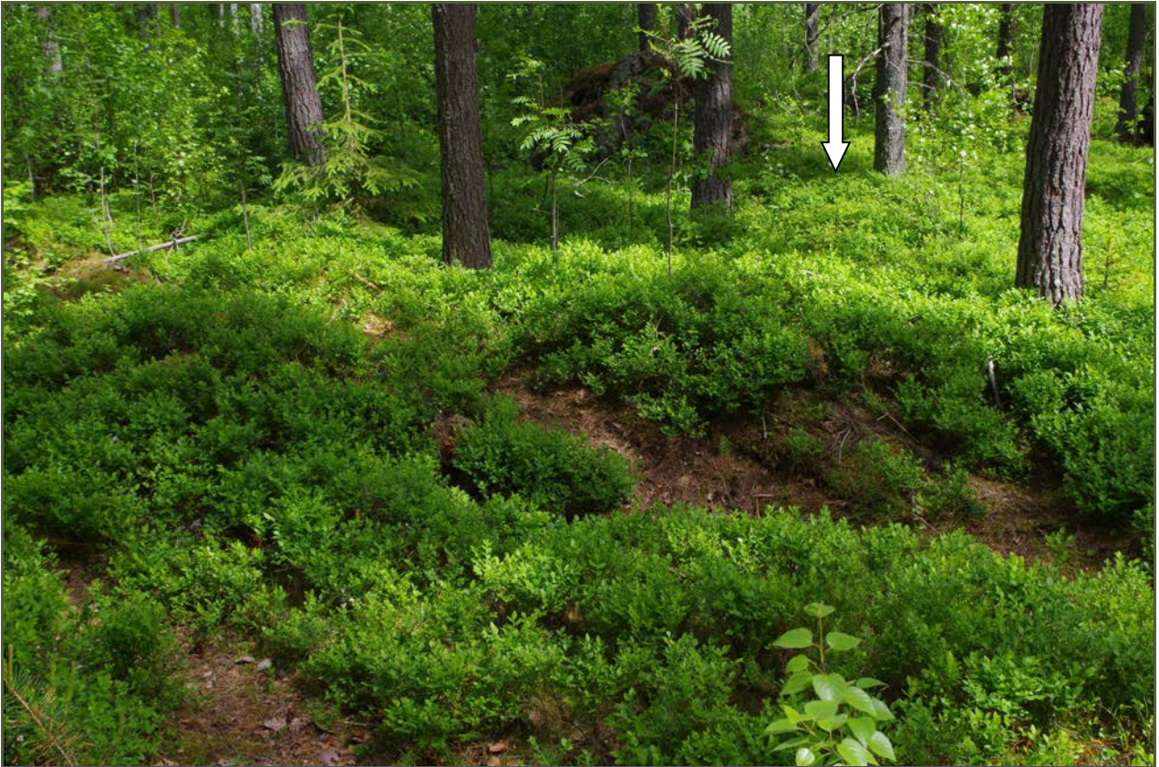
Kuva 1: Miilu suunnasta NE. Nuoli osoittaa miilun keskustaa. Polun/ajotien leikkauksessa näkyy miiluun liittyvää puuhiilikerrosta.