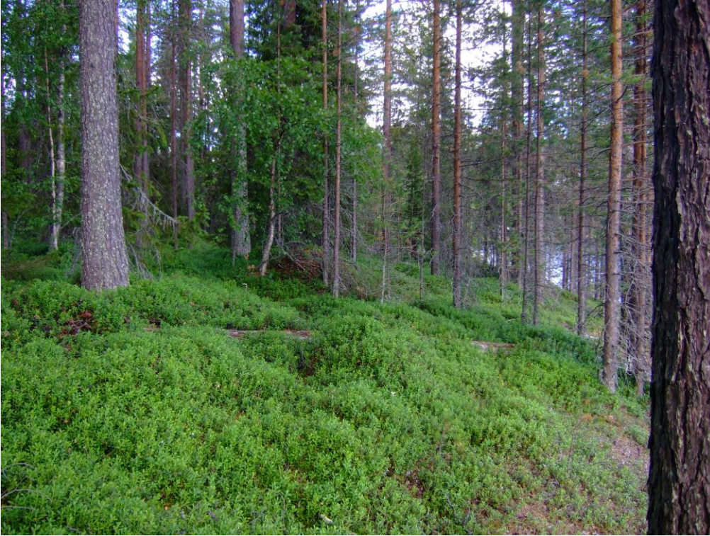
Kuva 1. Yleiskuva alueesta. KaiM 8206_5