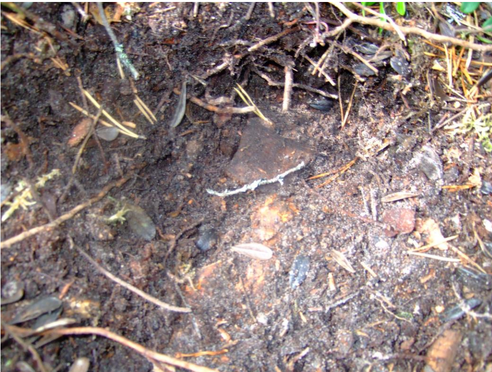
Kuva 2. Rikkinainen kirves maassa. KaiM 8206_6