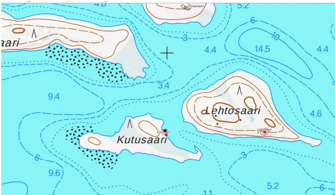
Kartta 2. Kohde Kutusaaren itärannalla. Museoviraston tietokanta ja Maanmittauslaitos.