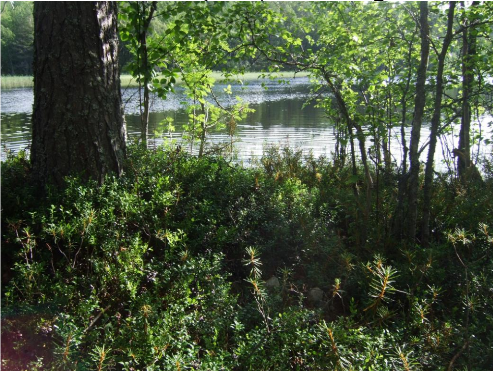
Kuva 2. Kirveen löytöpaikka etualalla, jossa näkyy kiviä. KaiM 8206_8