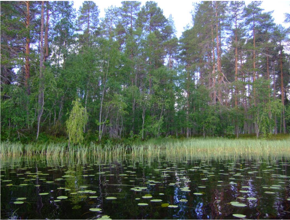
Kuva 1. Kuva kohdealueesta järveltä päin. KaiM 8206_7