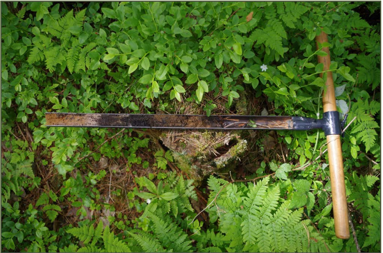
Kuva 3: Kairausnäyte miilun keskustasta sisälsi hiiltä ja nokimaata.