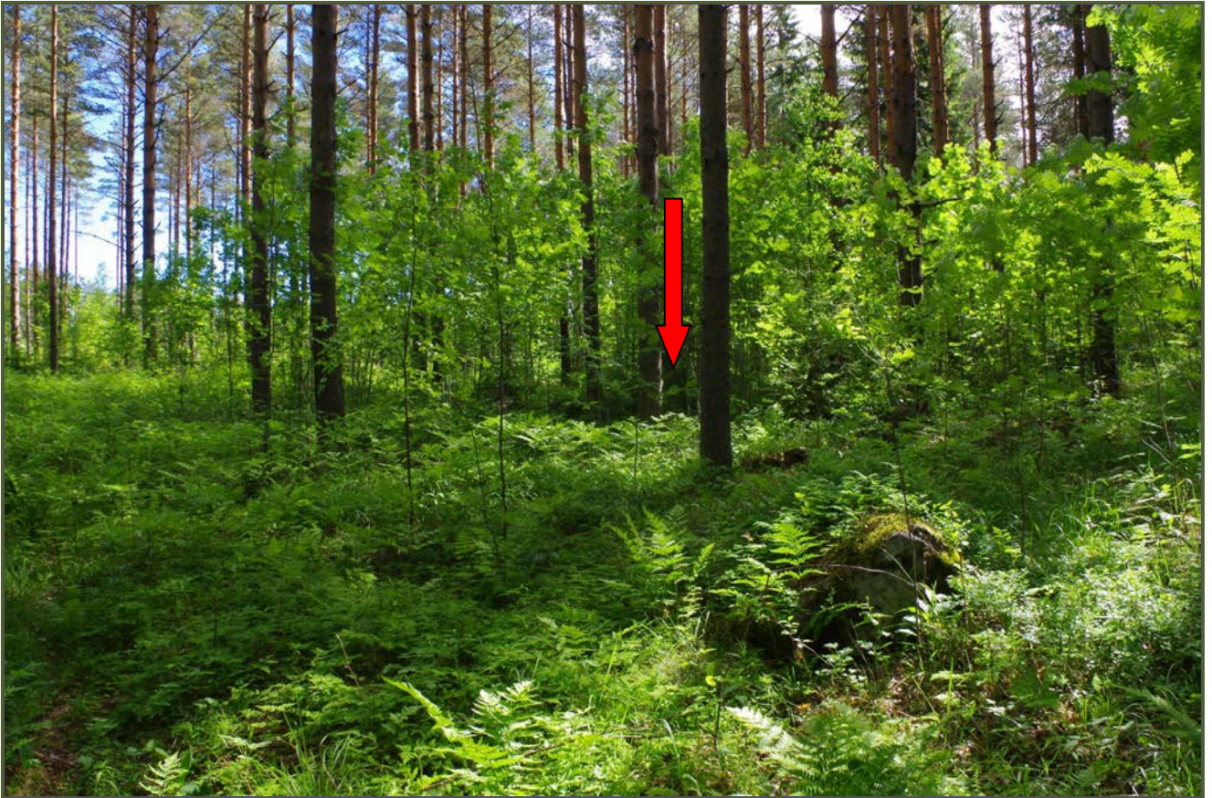
Kuva 1: Miilun sijainti maastossa. NW.