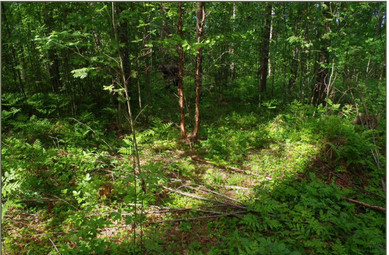
Kuva 2: Miilunpohjan keskustaa suunnasta SE.