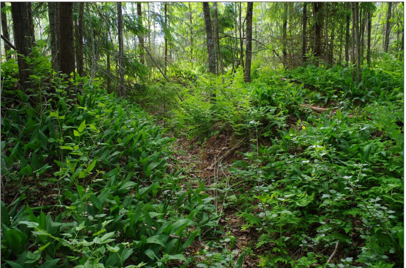
Kuva 2: Halssin paikka haudan W-sivustalla. W.