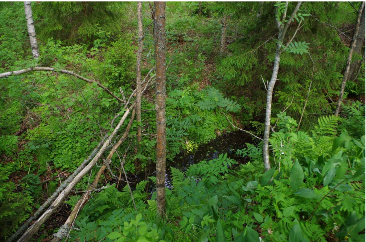
Kuva 4: Tervahaudan W-puolella sijaitseva oja. SE.