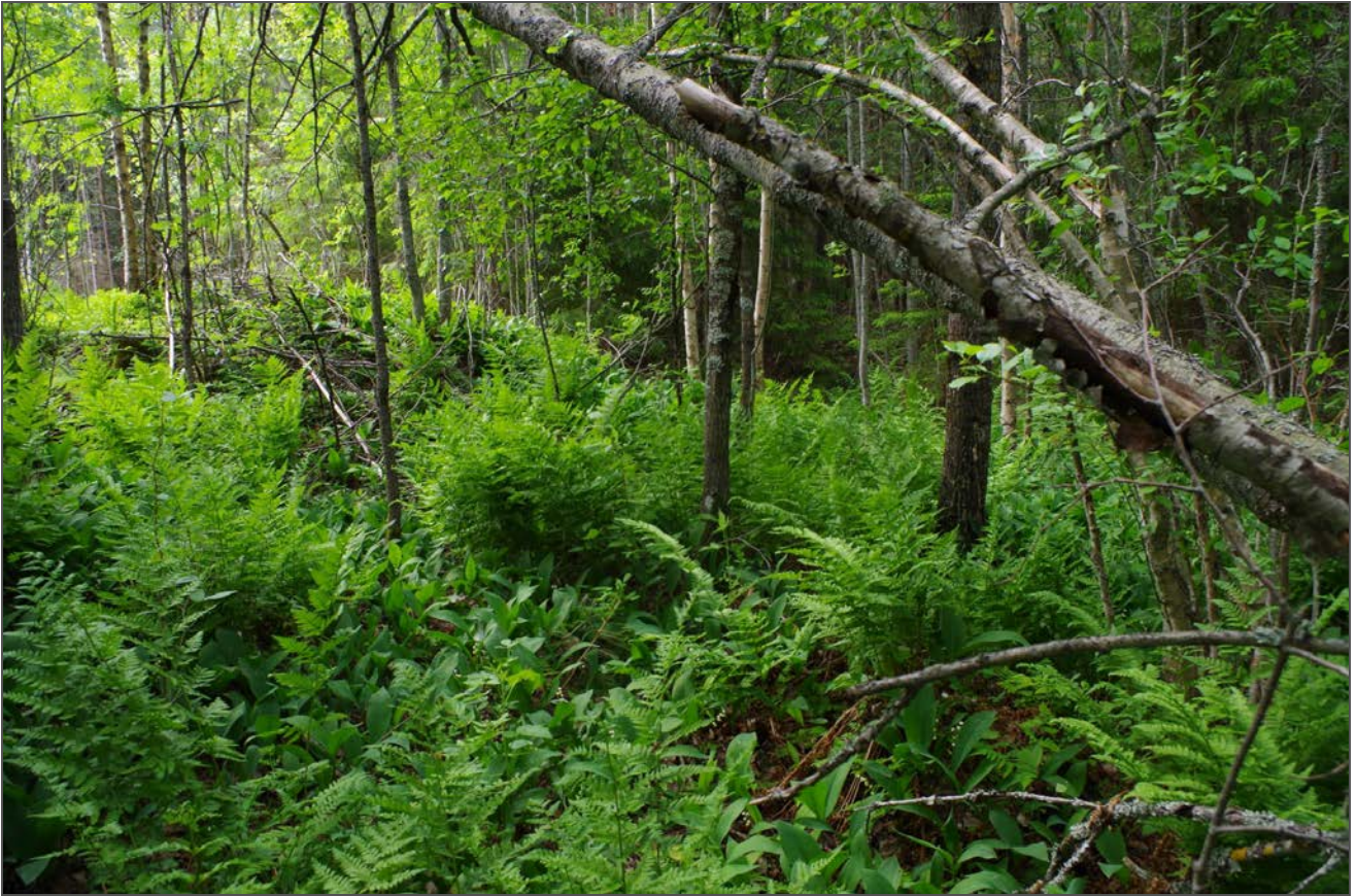
Kuva 3: Tervahaudan W-sivustaa. N.