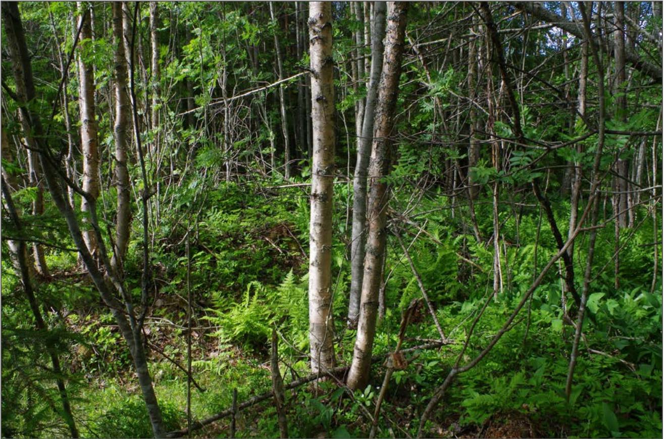
Kuva 1: Tervahaudan umpeen kasvanutta keskustaa suunnasta N.