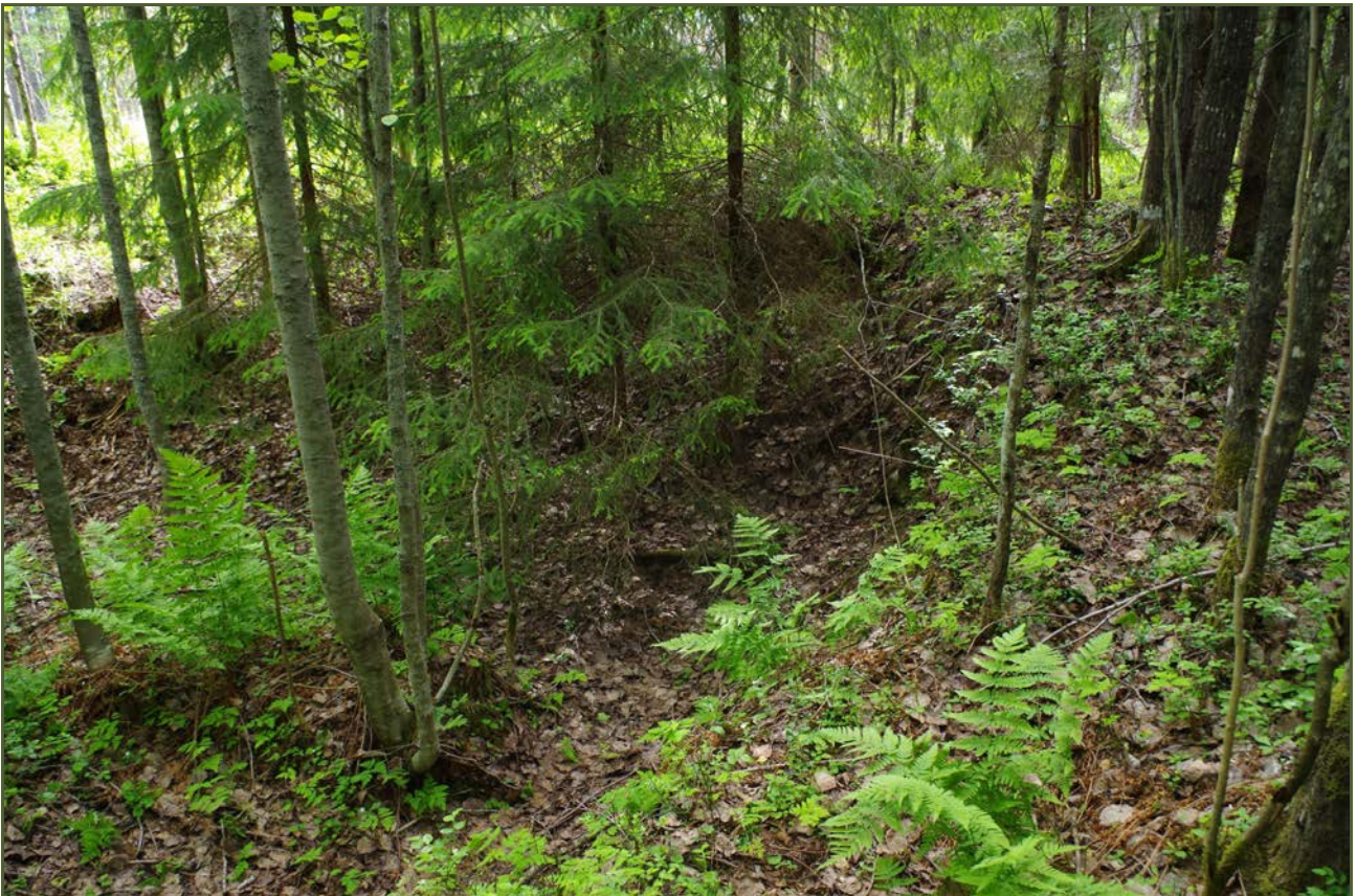
Kuva 2: Tervahaudan kaivettua S-sivustaa. W.