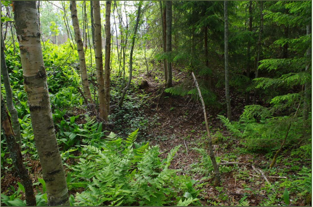
Kuva 1: Tervahaudan umpeen kasvanutta keskustaa suunnasta W.