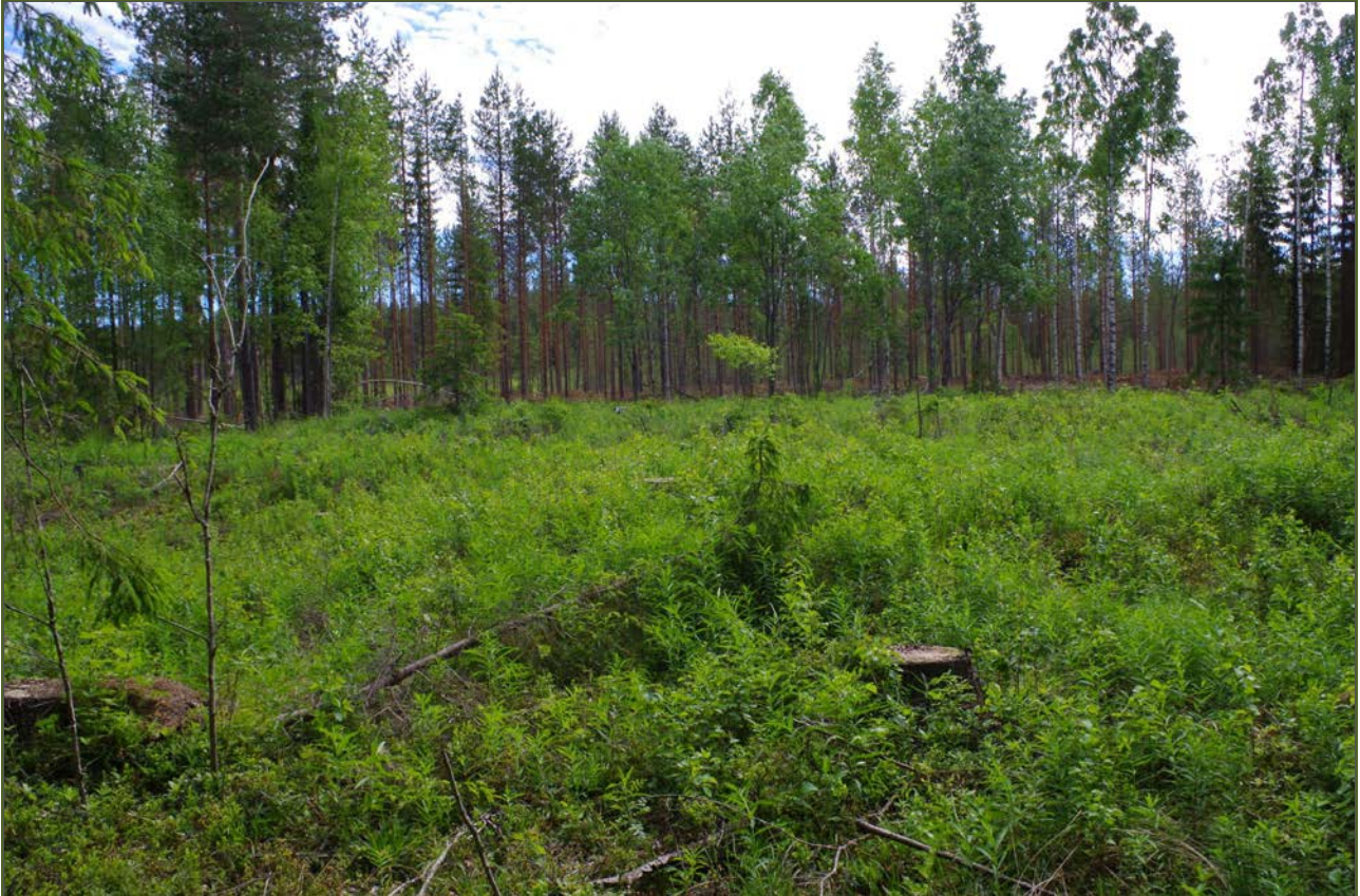
Kuva 4: Tervahaudan E-puolista maastoa. NW.