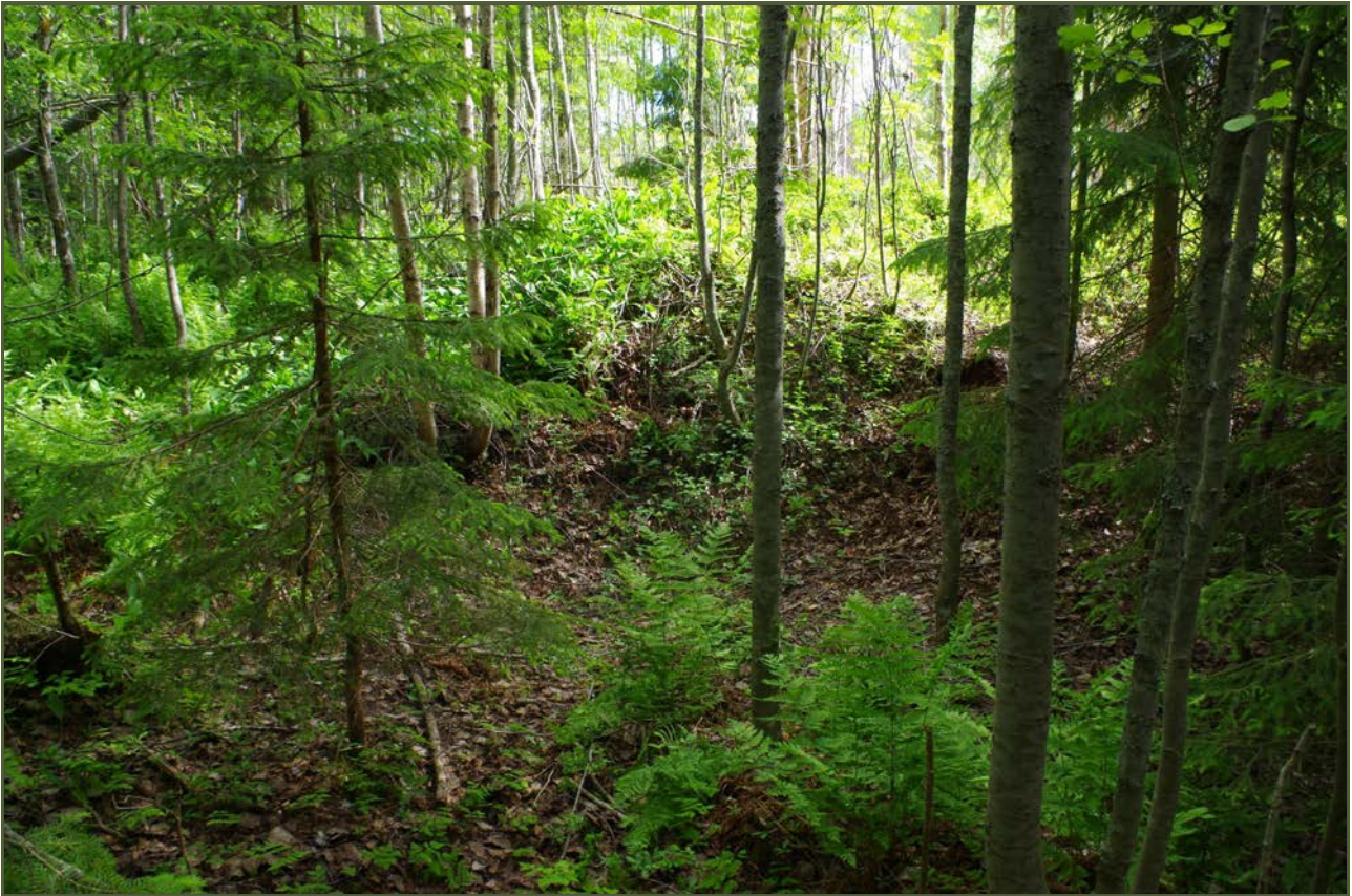
Kuva 3: Tervahauta suunnasta S.