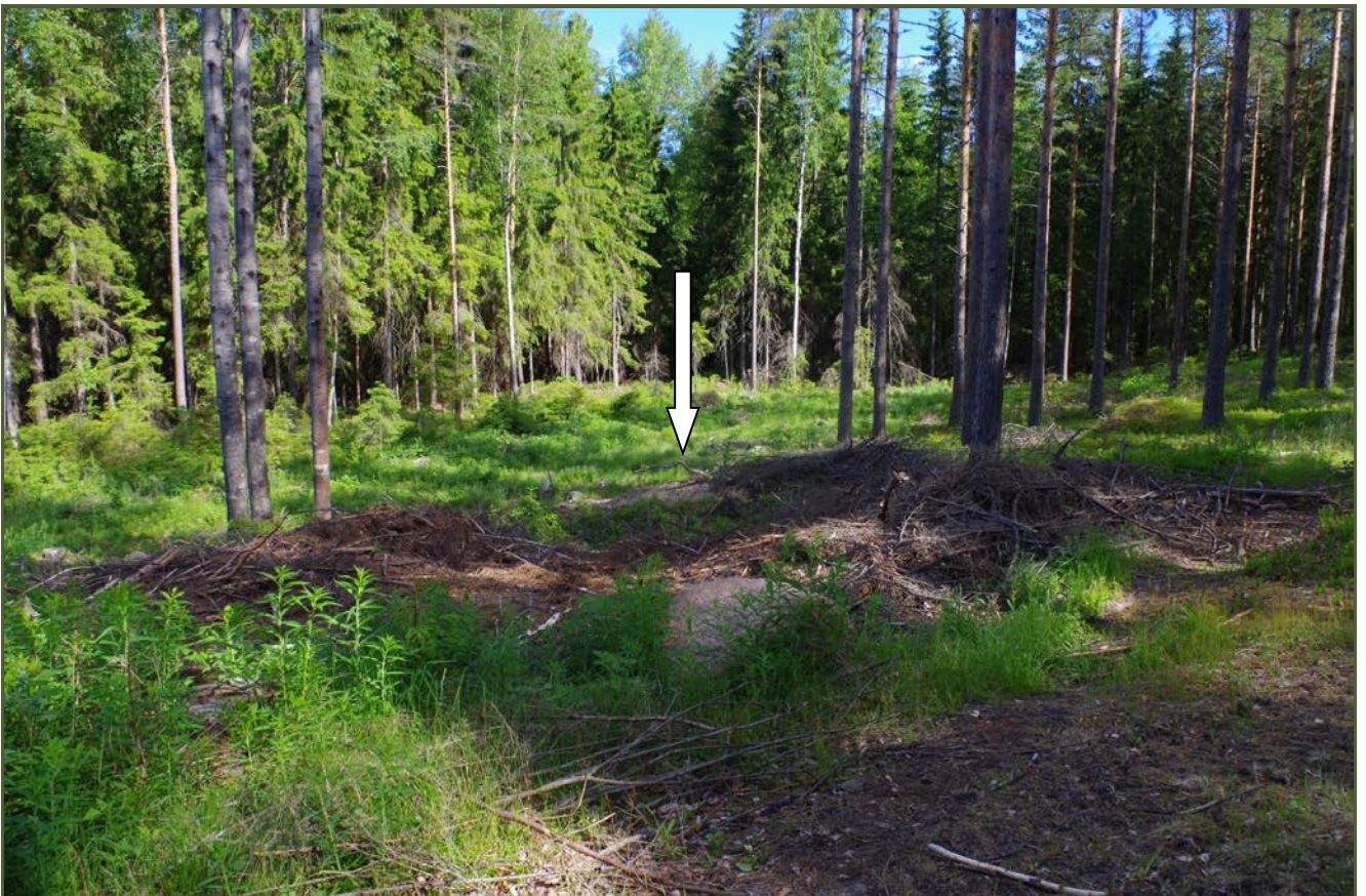
Kuva 2: Hakkuujätteellä täytetty tervahauta suunnasta E.