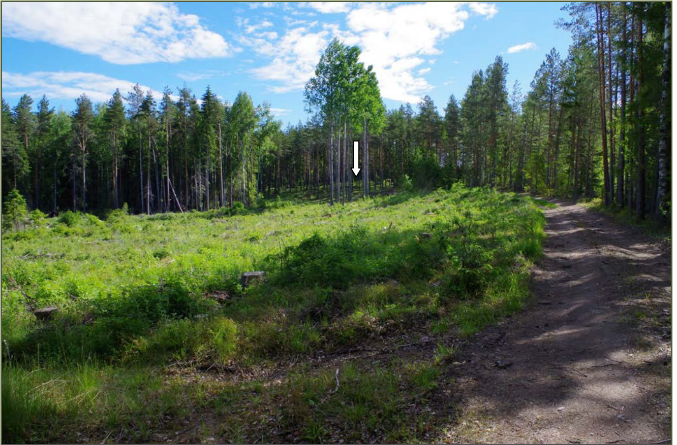
Kuva 1: Tervahaudan sijainti maastossa. S.