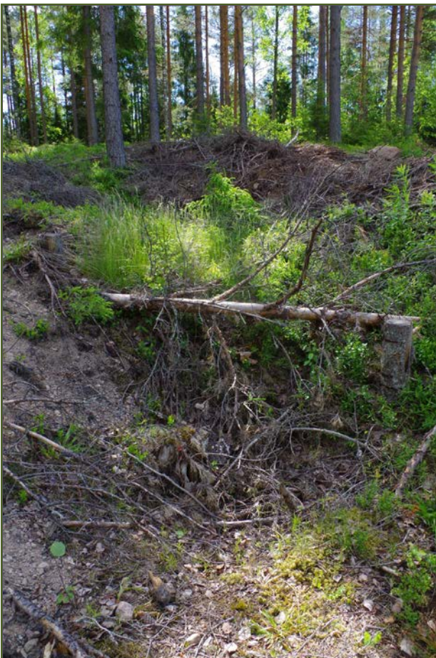
Kuva 4: Tervahaudan halssin paikka. W.