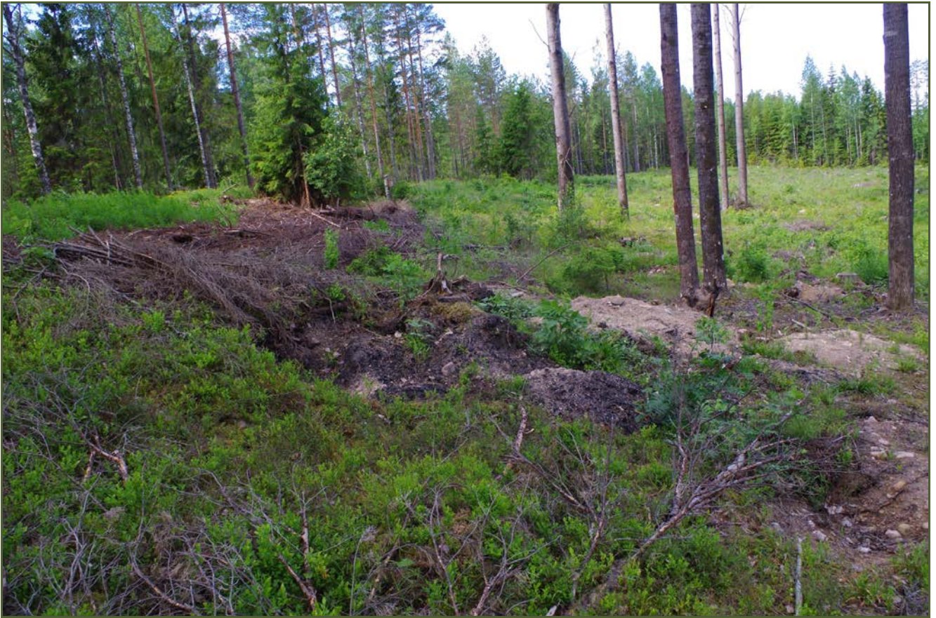
Kuva 3: Tervahaudan N-sivustaa, joka oli vaurioitunut metsäpohjan mätästyksen yhteydessä. Pintaturpeen alla sijaitsi runsaasti nokimaata ja puuhiiltä. N.