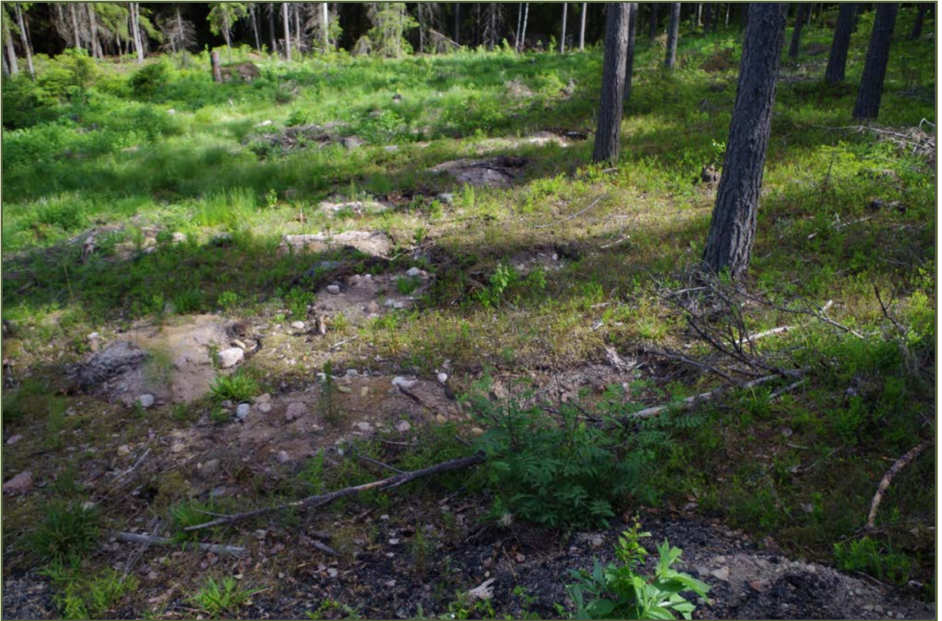
Kuva 5: Tervahaudan NW-sivustan mätästettyä aluetta. SE.