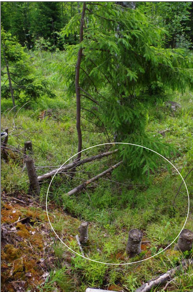
Kuva 4: Tervahaudan halssin paikka. W.