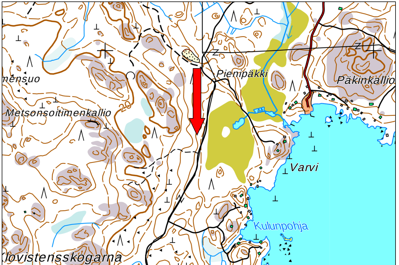
Kartta 1: Kohteen sijainti punaisen nuolen kärjen kohdalla. Karttapohja: Maanmittaushallituksen paikkatietoiikkuna. https://www.paikkatietoikkuna.fi