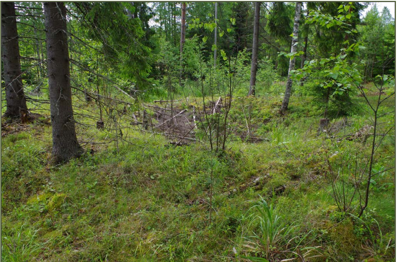
Kuva 2: Tervaudan N-sivustan vällia. N.