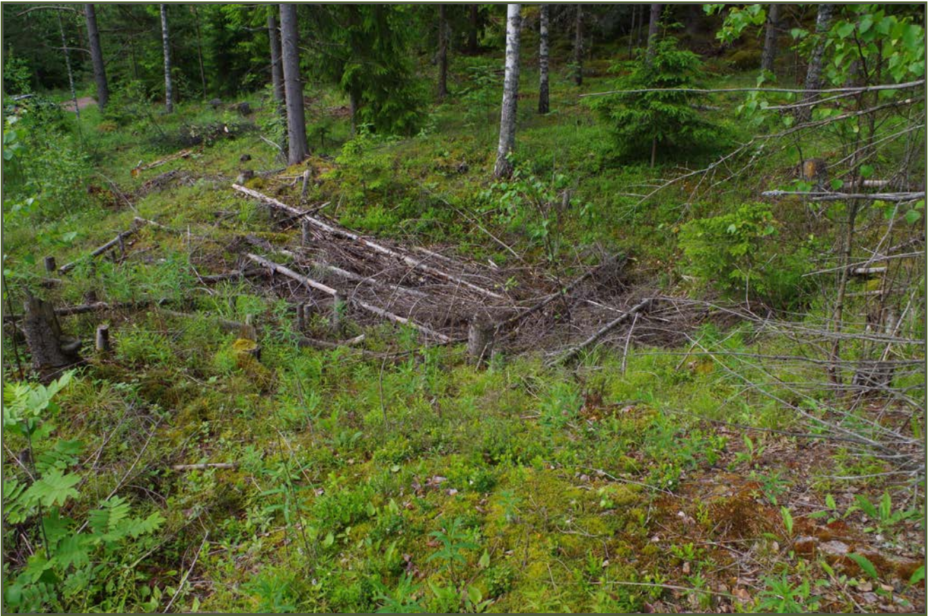
Kuva 3: Tervahaudan hakkuujätteellä täytettyä keskustaa. NE.