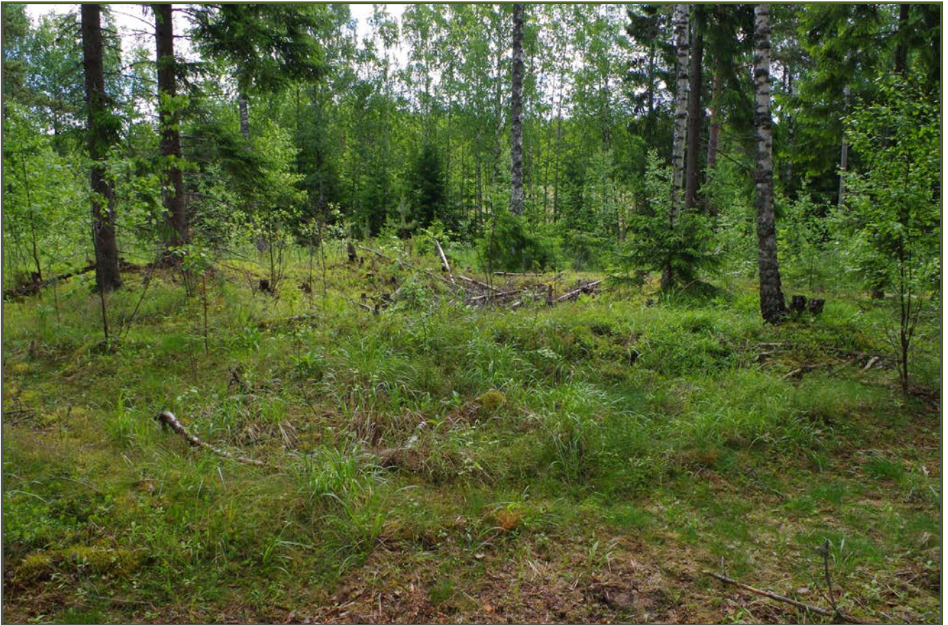
Kuva 1: Tervahauta suunnasta NW.