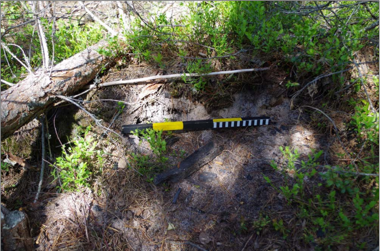
Kuva 3: Miilun rikkoutunutta SE-päätä ja hiekkamaasta paljastunutta puuhiiltä. SE.