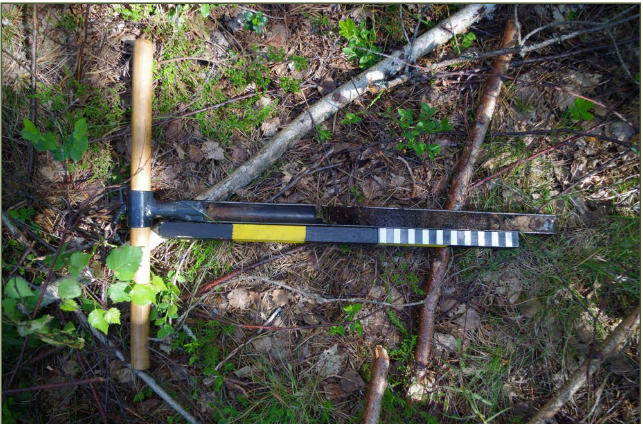
Kuva 4: Miilunpohjasta otettu kairausnäyte sisälsi runsaan 20 cm:n paksuudelta nokimaata ja hiiltä.