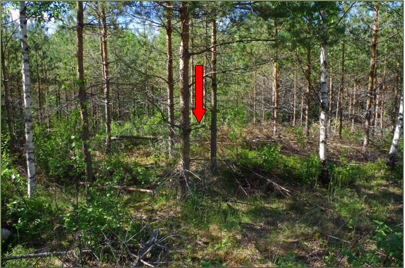
Kuva 1: Miilunpohja suunnasta N.