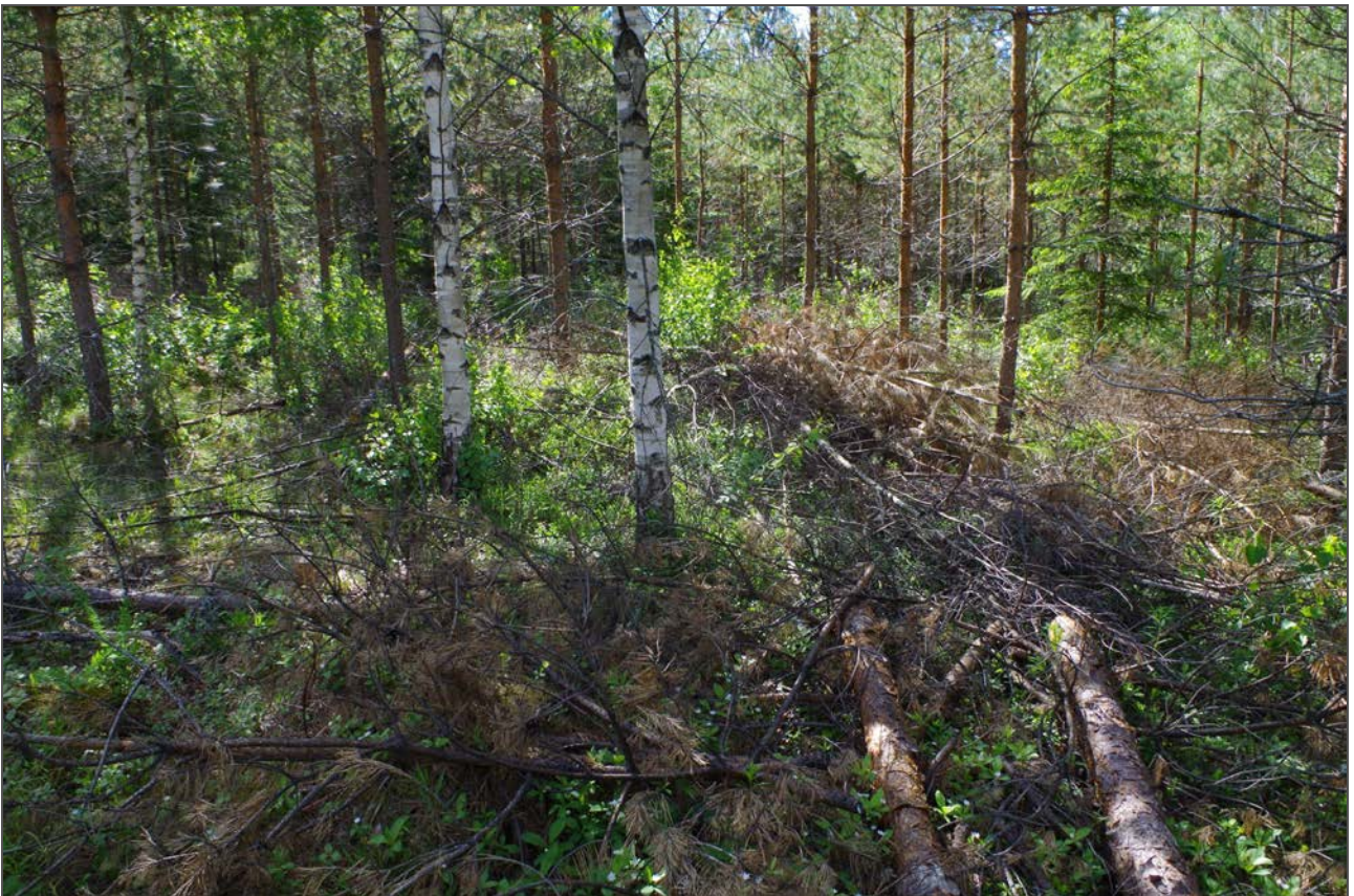
Kuva 2: Miilunpohja suunnasta NW.