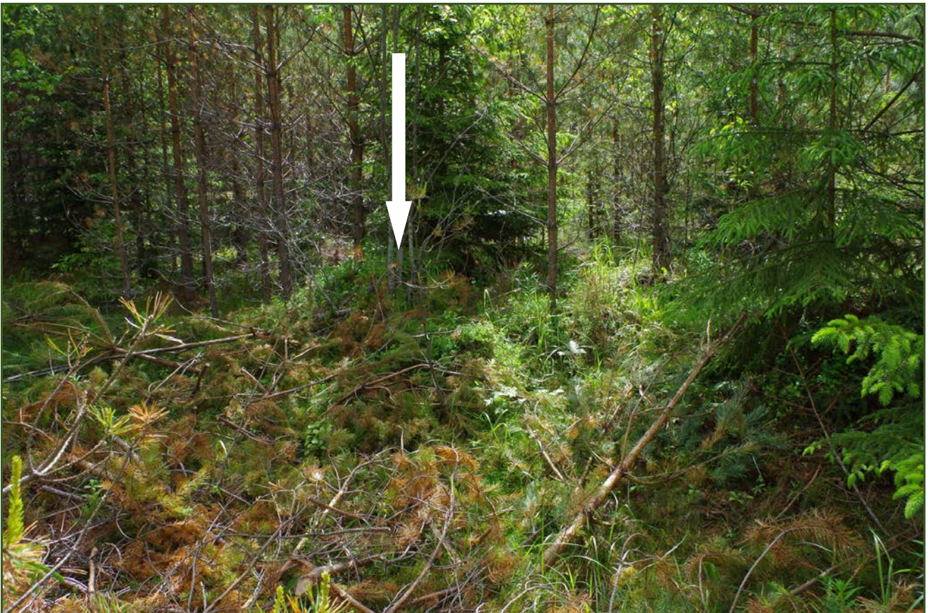
Kuva 6: Miilu M2 suunnasta N.