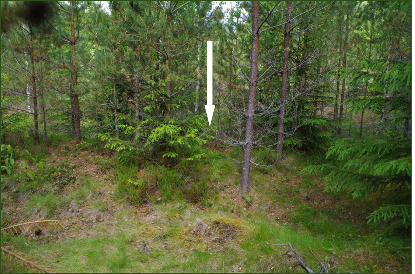
Kuva 5: Miilu M2 suunnasta SE.