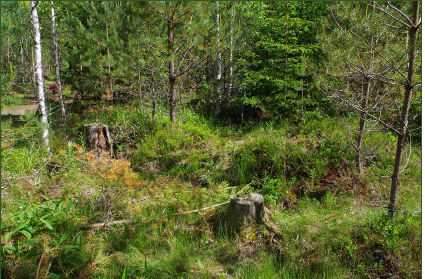
Kuva 3: Miilu M1 suunnasta S.