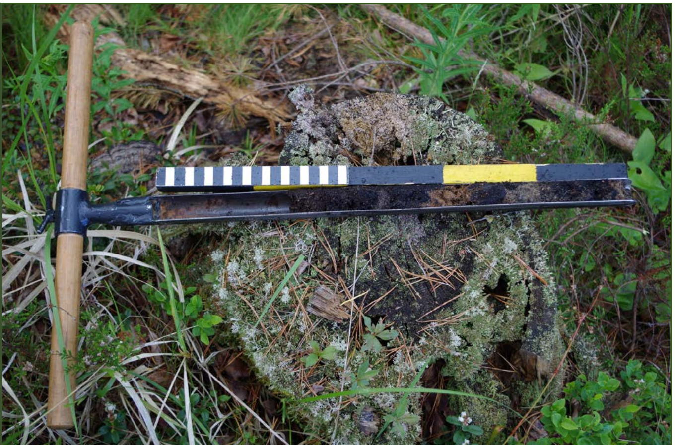
Kuva 4: Kairausnäyte miilusta M1 sisälsi runsaasti nokea ja puuhiiltä.