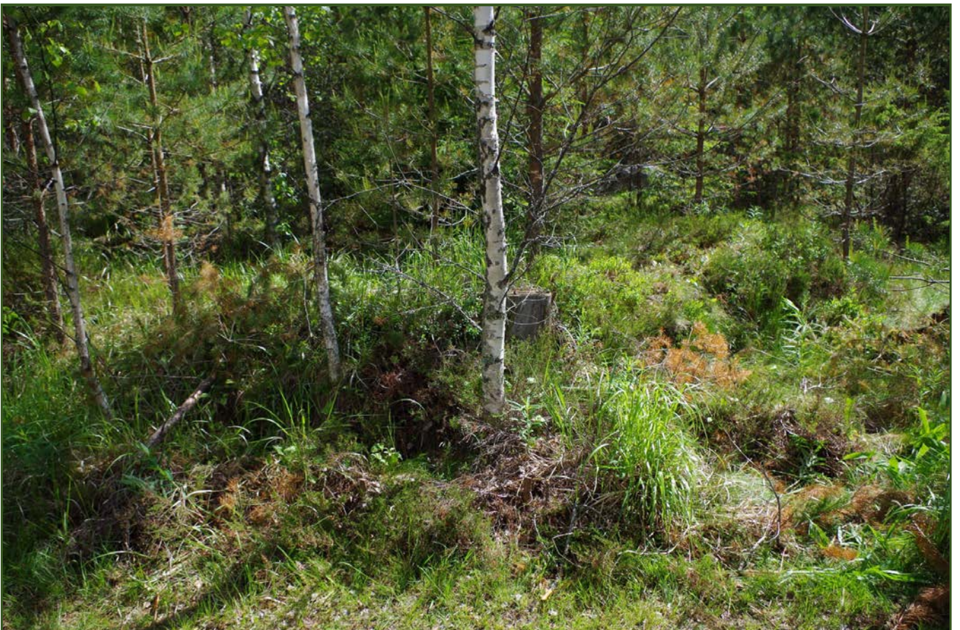
Kuva 2: Miilu M1 suunasta W.