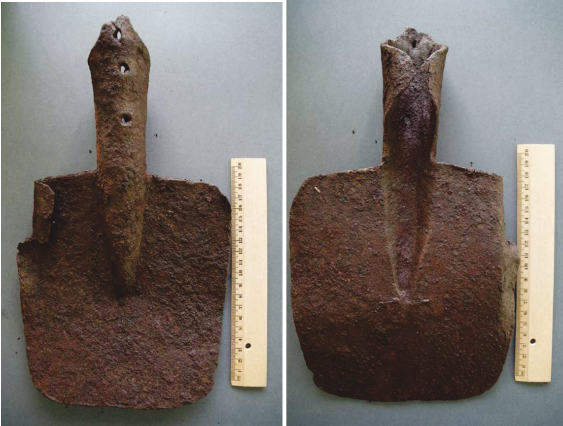
Kuvat 7-8: Miilusta M1 löytynyt rautainen lapionterä.