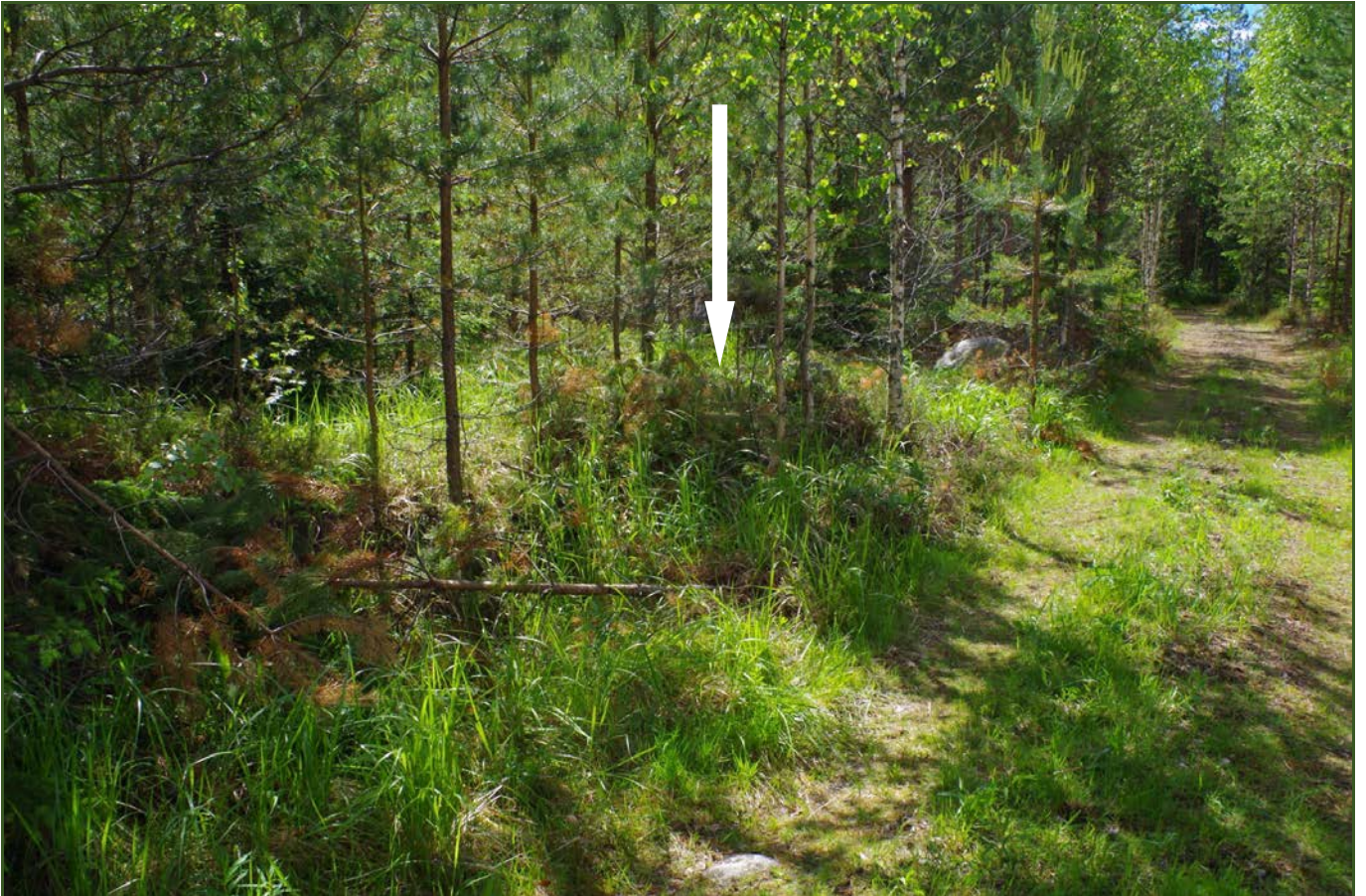
Kuva 1: Miilu M1 suunasta N.