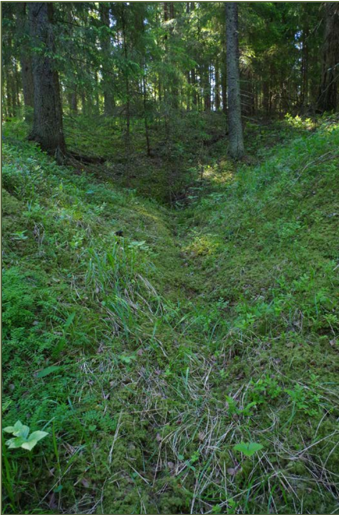
Kuva 3: Tervahaudan keskustaa ja W-sivustaa. W.