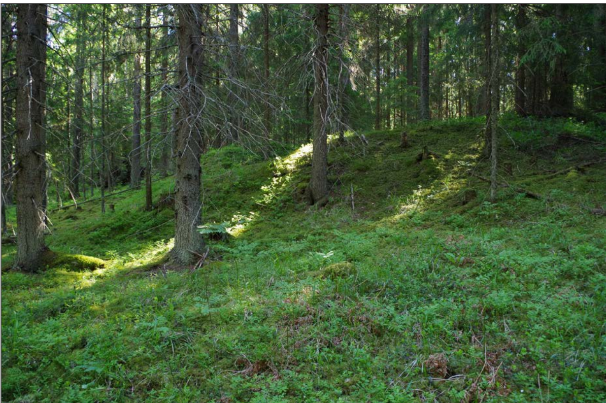
Kuva 4: Tervahaudan S-sivustan profiili. S.