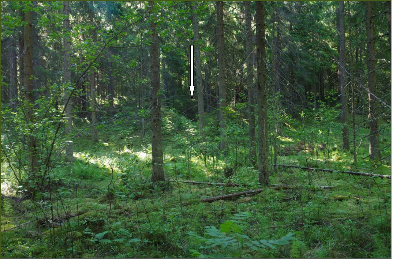
Kuva 1: Kohde kuvattuna suunnasta W.