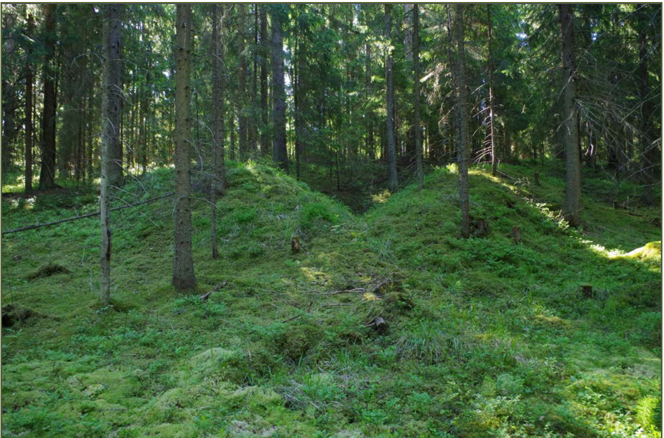
Kuva 2: Kuten kuva 1. Lähikuva kohteesta. W.