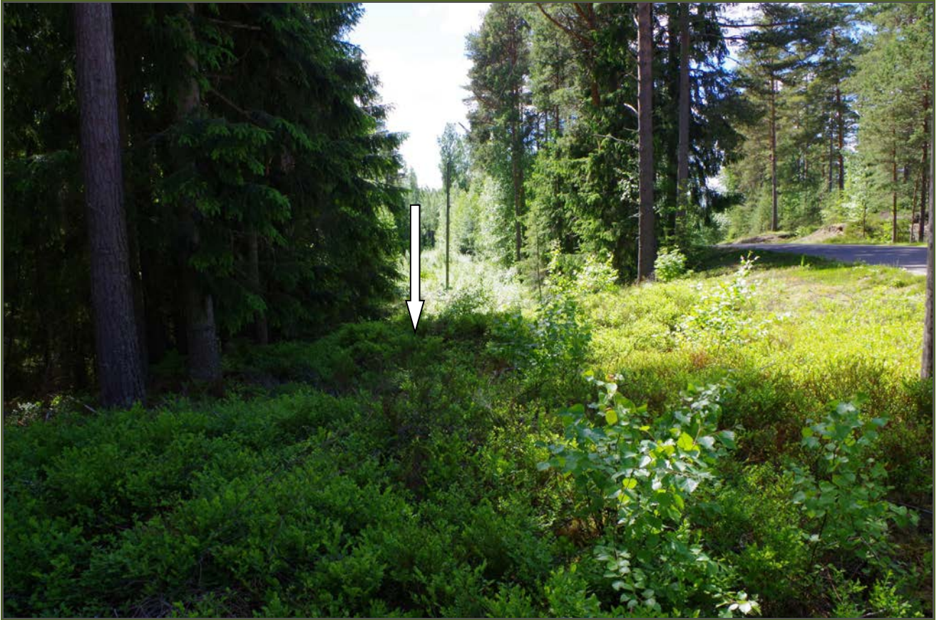
Kuva 1: Tervahaudan sijainti maastossa. Oikealla Purolantie. N.