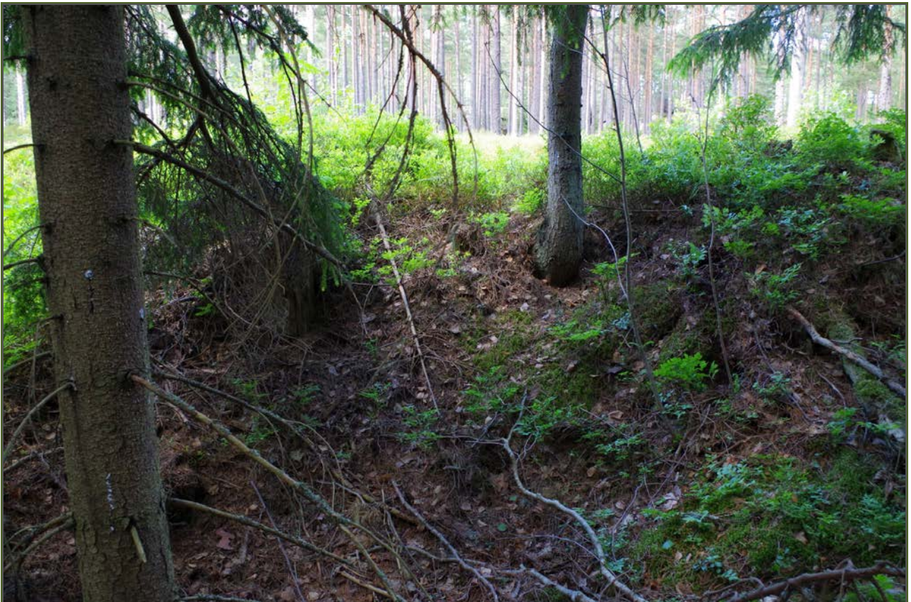
Kuva 4: Tervahaudan halssin paikka. E.