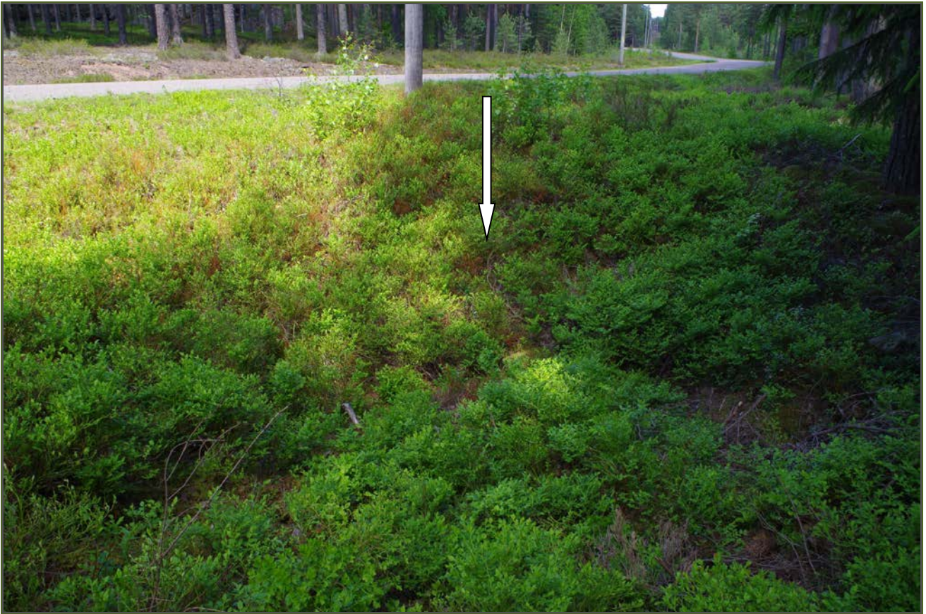
Kuva 3: Tervahauta suunnasta SE. Taustalla Purolantie.