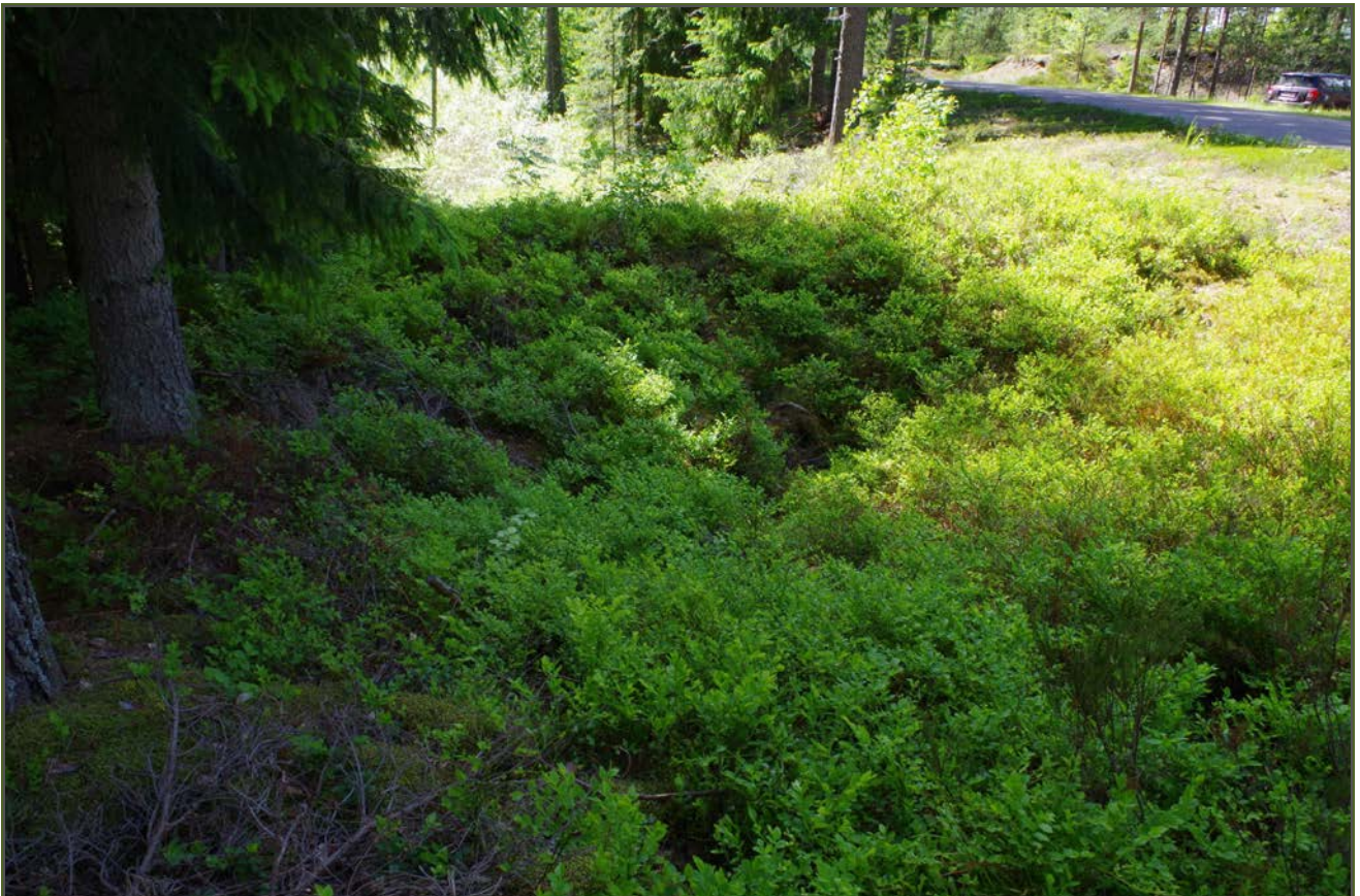
Kuva 2: Tervahaudan keskustaa. NE.