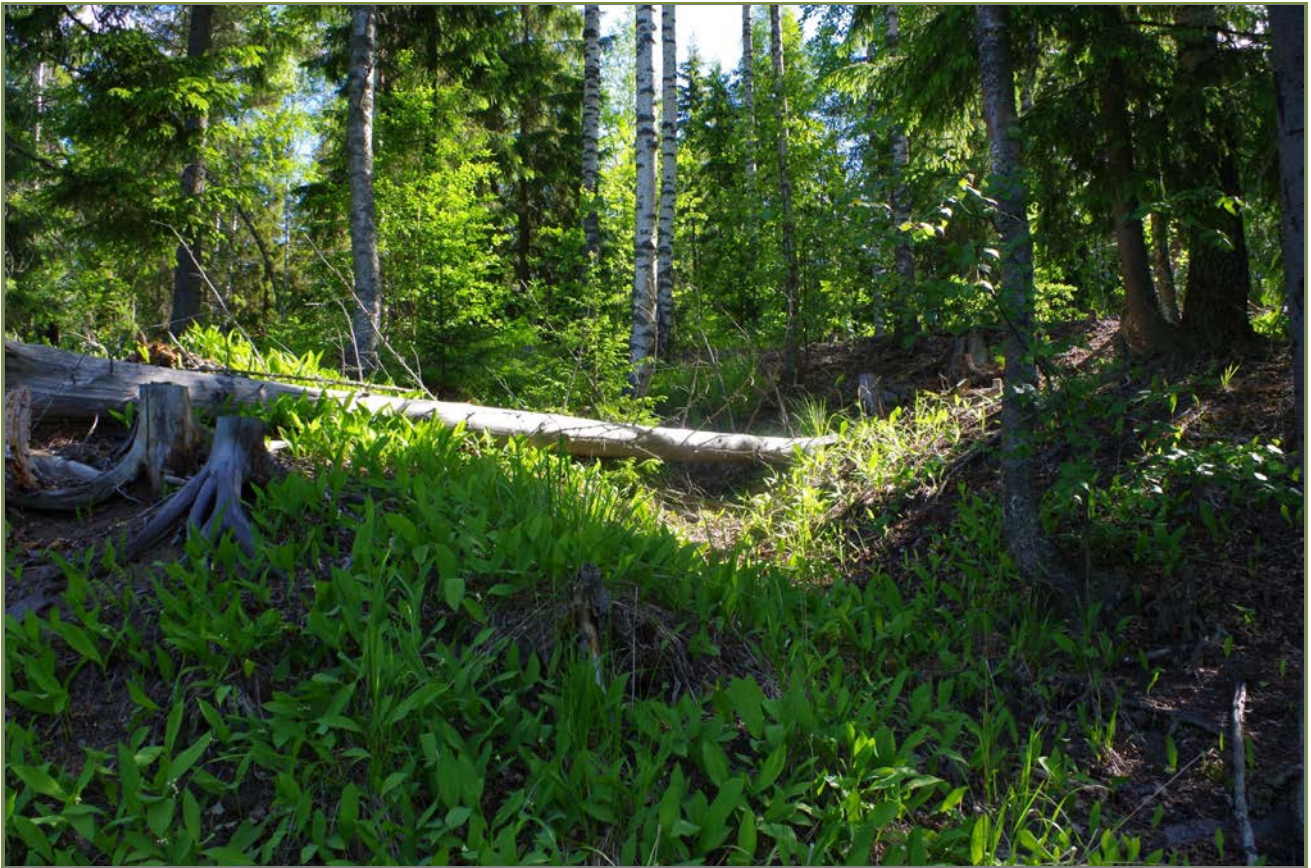
Kuva 1: Kohde kuvattuna ylämäkeen päin. SW.