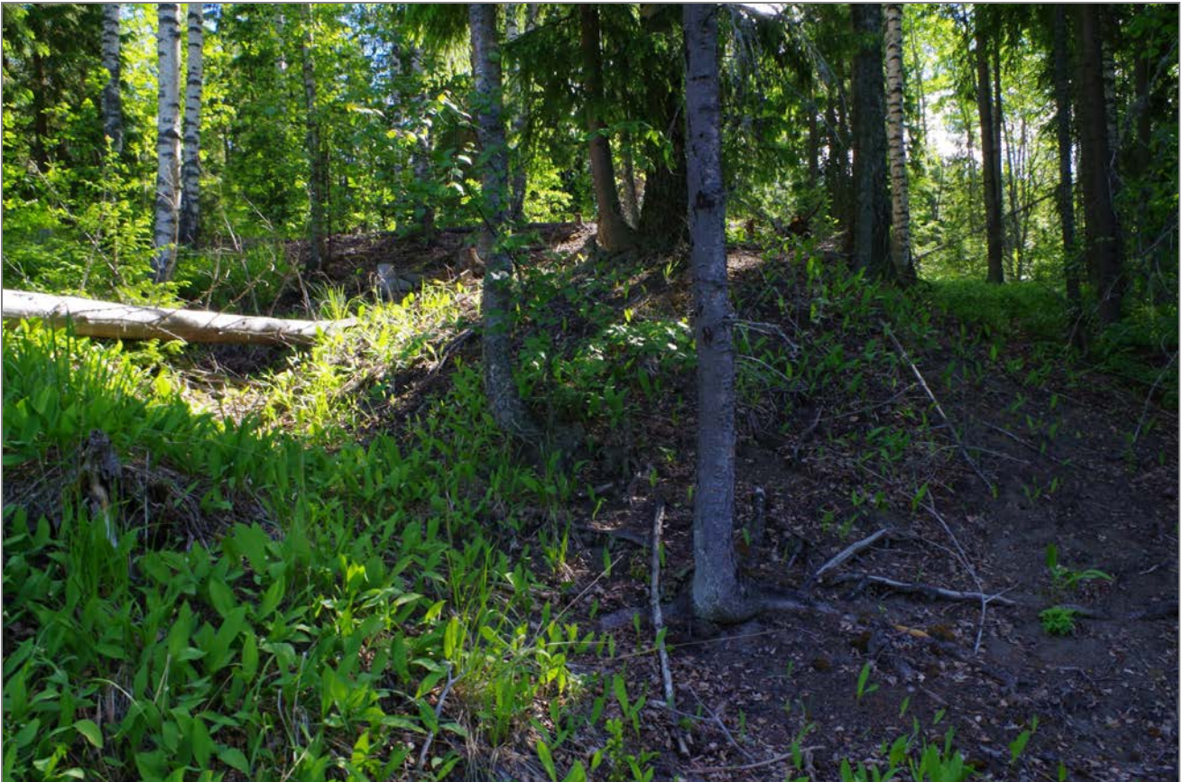
Kuva 3: Tervahaudan halssin paikka (suoraan edessä) ja leveää vallia SW.