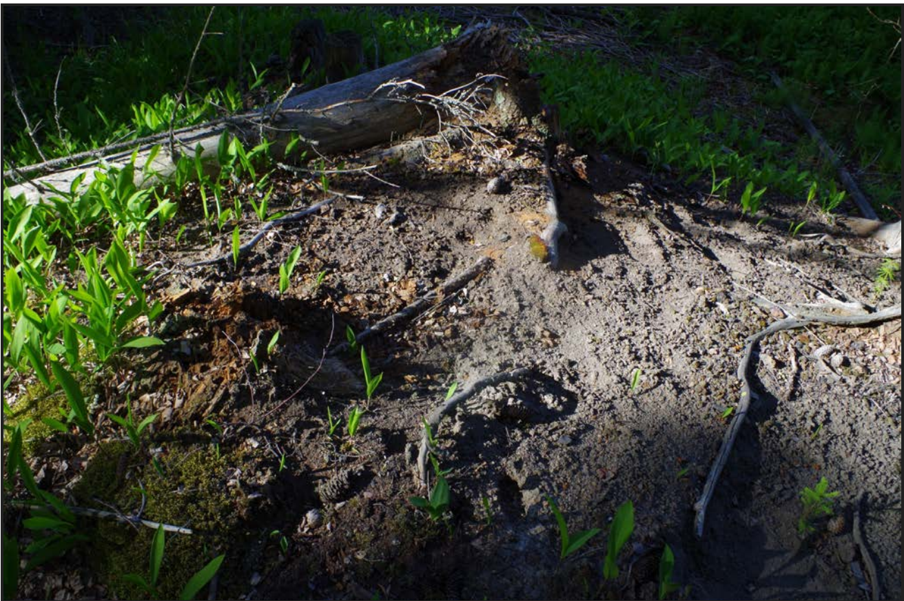
Kuva 4: Tervahaudan S-sivustalla pintaturpeen alta pilkotti tummanharmaa noen- ja puuhiilensekainen hiekkamaa. W.