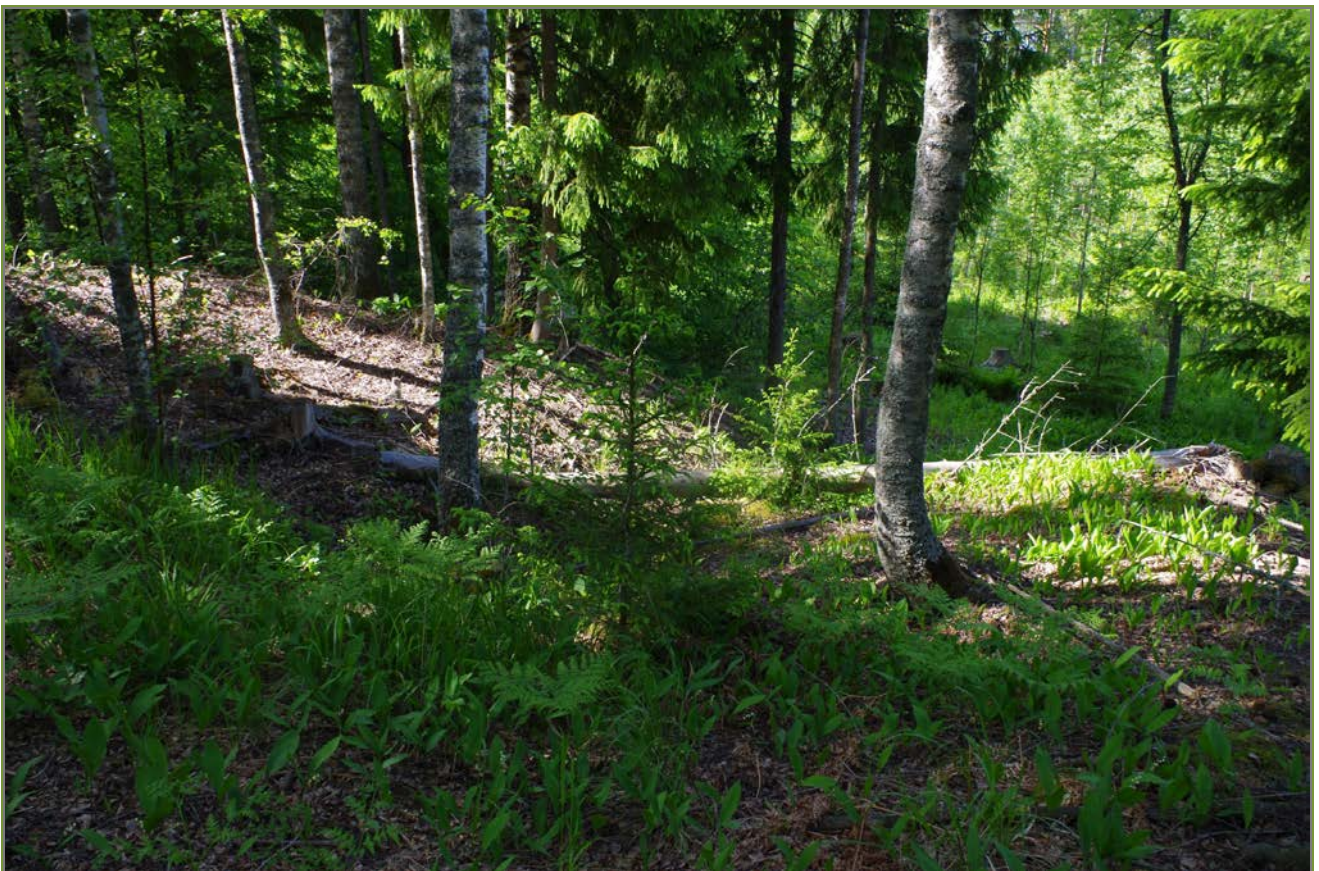
Kuva 2: Tervahaudan W-sivustaa suunnasta W.