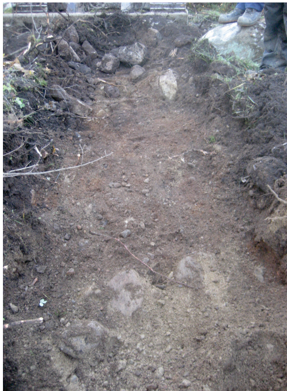
Punertava, selvärajainen maakerros koeajan kaakkoispäässä.

Koeajan ylärinteen eli kaakkoispään kohdalla maanpinnan korkeus on 21,53 m mpy ja luoteispään kohdalla 20,34 m mpy.