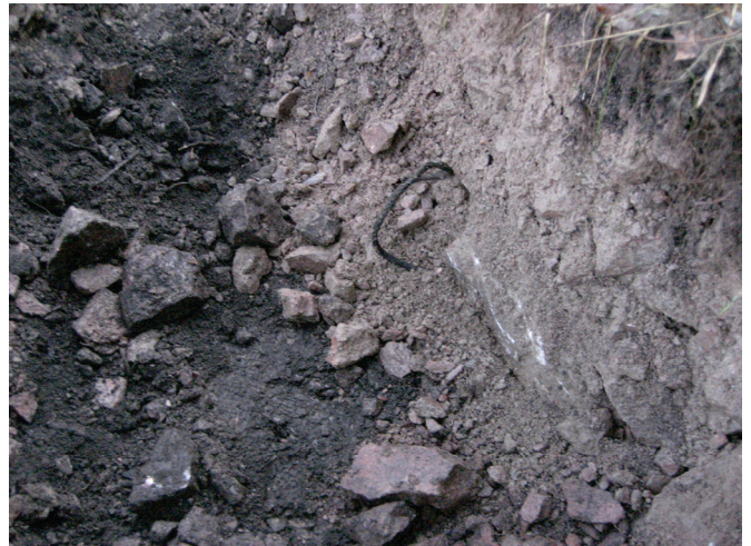
Kaivannon seinämässä noin metrin syvyydessä oli uusi vajjeri.