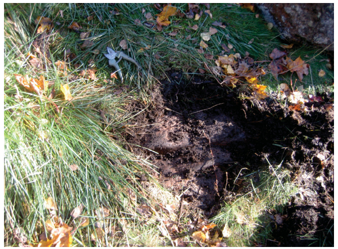
Koekuoppa 2 ja mahdollinen ahdekaura.

Koekuoppa 3 kaivettiin alueelle 6 tasanteelle kallion itäpuolelle. Paikalla kasvaa sikoangervoa ja mahdollisesti ahdekauraa. Kuoppa kaivettiin 3,5 m uuden rajan reunasta pohjoisluoteen ja 7 m kallion reunasta itäkaakkoon. Se oli 50 x 50 x 60 cm kokoinen ja kaivettiin paikalla olleeseen vanhaan kuoppaan. Länsiseinä näyttäisi olevan ehjää maata: 0-5 cm ruohohumus, 5-25 cm juurien sekainen tumman harmaa humus, 25-33 cm ruskea soran sekainen hiekka, 33-52 cm keltainen soran sekainen hiekka, 52-60 cm vaalean harmaa savinen huuhtoutunut moreeni, jossa 5-15 cm kokoisia kiviä ja kosteana savinen maa. 5-25/33 cm syvyydessä oli isohkoja 25-25 cm kiviä jokunen kappale. Lopuksi koekuopan pohjoisreunaa laajennettiin niin, että se ulottui varmasti vanhan kuopan rajojen ulkopuolelle jolloin ilmeni, että ruskea hiekka alkoi kivien alapinnan tasolta noin 15-25 cm syvyydestä.