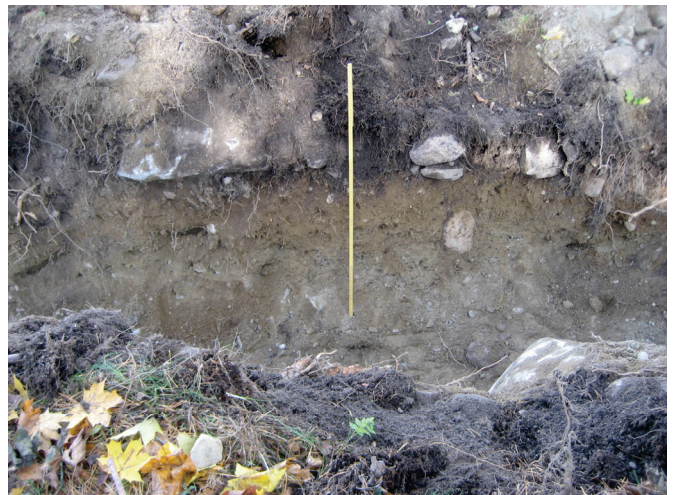
Koeojan 2 maakerrokset.