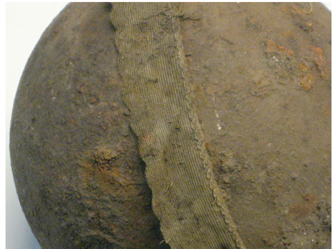
Kuvia kuulasta ja siihen tarttuneesta kankaan kaistaleesta.

Kuula on joko tykin ammus tai miesten urheilukisoissa käyttämä kuulantyöntökuula. Molemmat sopivat löytöpaikkaan, sillä Korppolaismäeltä tai mäen edustalta tiedetään tulitetun linnaa tykein ainakin jo 1500-luvun puolivälistä alkaen. Toisaalta taas alue on pitkään ollut omakotiasutuksen takamaastoa ja paikalla oleva tasanne olisi sopinut omaehtoisen kuulantyönnön harjoitteluun. Missään tapauksessa kuula ei ole alkuperäisellä paikallaan vaan se on voinut pitkäänkin pyöriä paikalla. Sen sijaan varmaankin alue on alkuperäinen, ts. jonnekin mäen joen puoleiselle lakialueelle se on aikoinaan hukattu.