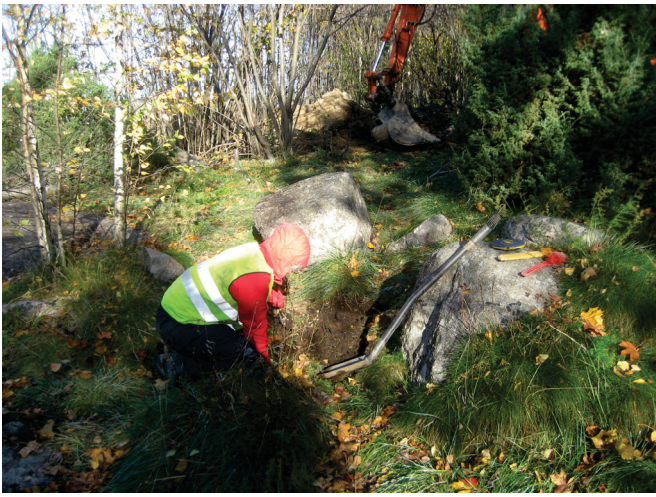
Koekuopan 2 sijainti.