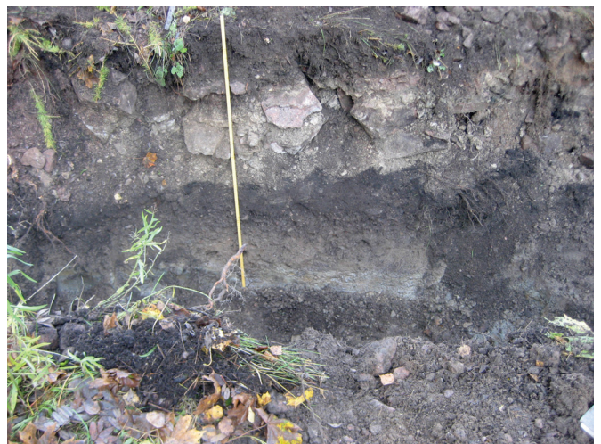
Kaivannon seinämän maakerrokset.