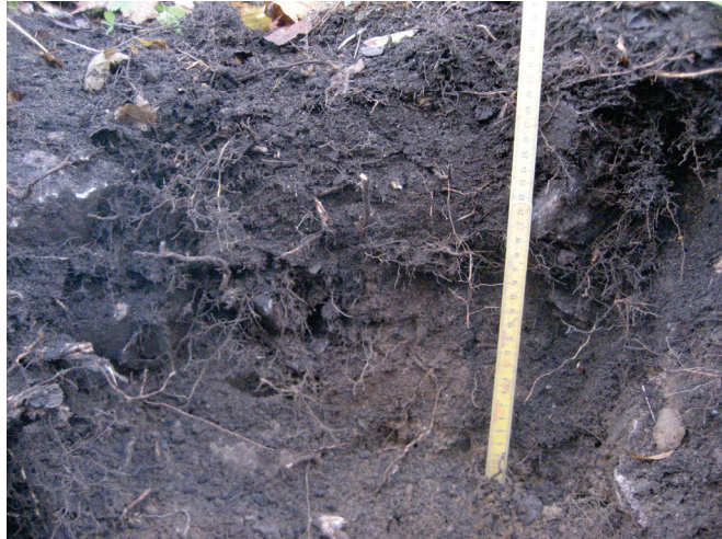
Koekuopan 1 maakerrokset.

Koekuoppa 1 tehtiin kivikon kaakkoispuolella. Sen pohjoiskoillisessa seinämässä dokumentoitiin seuraavat maakerrokset: 0-15 cm, humuksensekainen tummanharmaa hiekka 15-25 cm, 25-30 (→) ruskea hiekka. Resenttiä lasia löydettiin noin 20-25 cm syvältä, humuksensekaisen hiekkakerroksen pohjasta.