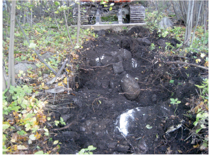
Koeijan 3 luoteispään pintakerrosta.

Aidan perustuskiveyksen kohdalta dokumentoitiin seuraavat maakerrokset: 0-10 cm musta juurihumus, 10-35 cm tummanharmaa juurien ja humuksen sekainen multa, jonka seassa on hieman hiekkaa, 35-50 cm punertavanruskea hiekka, 50-70 cm ruskea hiekka, 70 cm → kivinen vaaleanharmaa, ilmeisesti huuhtoutunut moreenin pintakerros. Aidan perustuskiveyksen luoteispuolella erottuu leikkauksessa pyöreäpohjainen kuoppajäännös: 0-16 cm juurihumus, 16-60 cm kivien (halkaisija 10-20 cm) ja harmaan hiekan täyttämä kuoppajäännös, joka leikkaa syvimmässä kohdassa punertavan hiekkakerroksen ja tulee kiinni ruskean hiekan yläpintaan (vaaleanruskea hiekkakerros tässä kohtaa 60-75 cm), jonka alla on vaaleanharmaan kerros.