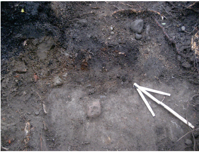
Kääntöpaikan lounaisen alueen pientareelle jatkuneessa koeojassa havaittiin maatonutta puuta ja nauvoja sisältänyt kuoppajäännös.