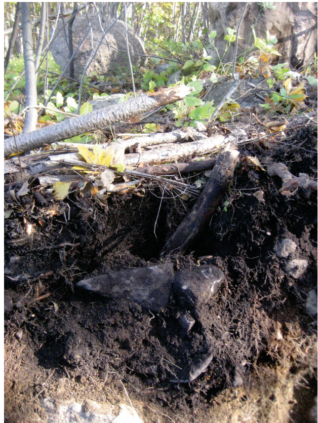
Oja leikkauksessa kuvattuna siten, että sijainti suhteessa perustuskiveykseen on nähtävissä (lähimmät kivet oksien takana).