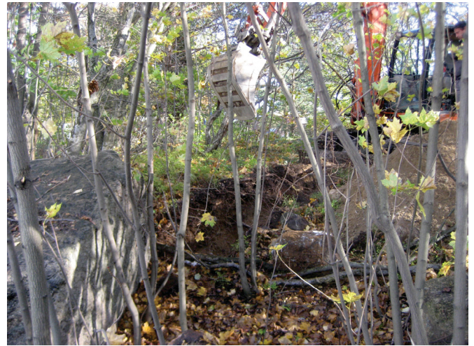
Koeoja 1 kaivettiin kivikkoisen kumpareen reunan kohdalle.

Koillisseinämästä dokumentoitiin seuraavat maakerrokset: 0-13 cm musta turve, jossa on paljon juuria, 13-26 cm tummanruskea juurten sekainen hiekka, 0-26 cm paljon kiviä, 26-37 cm ruskea hiekka, 37-68 cm vaaleanruskea soran sekainen hiekka, 68-88 cm ruskea hiekka, joka syvemmällä on hienompaa, 88 cm → vaaleanharmaa hiekka. Ojan koko syvyys oli 95 cm.