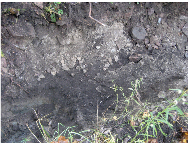
Musta maakerros, josta löydettiin mm. rautalankaa