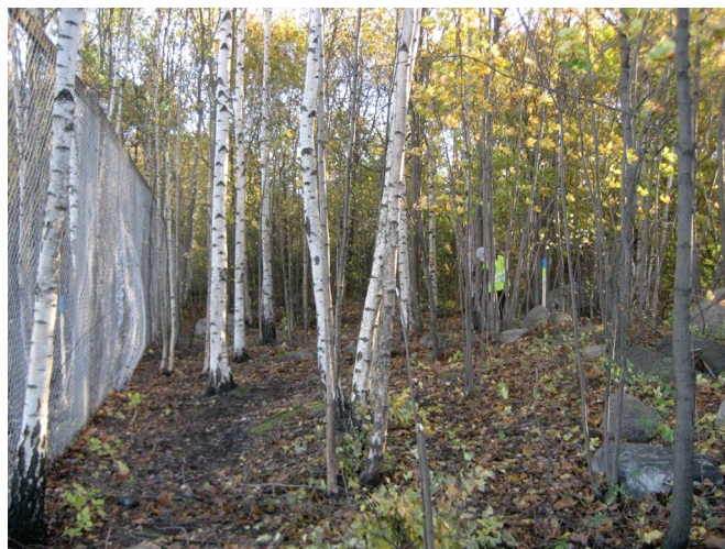
Kivikkoisen alueen sijainti.