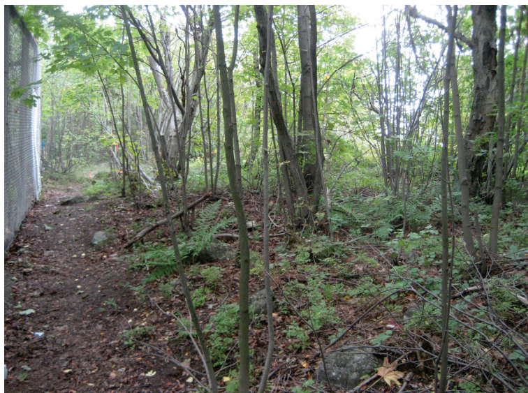
Alueen 6 lehtipuuvaltaista rinnettä.

Maasto kääntöpaikasta itään ja kaakkoon on jyrkkää, metsäistä ja kivikkoista länteen ja lounaaseen viettävää kallionalusrinnettä ( alue 6 ). Kasvillisuus on lehtipuustoa, mistä johtuen aluskasvillisuus on niukkaa mutta karikerros paksu. Alueen 6 kaakkoisreunassa alkaa avokallio ja ylempänä kaakon suunnassa maasto tasaantuu ja muuttuu avoimemmaksi maisemaksi ( alue 7 ). Alueen korkeus koillisosassa on 20 m mpy kummankin puolin.