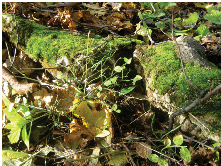
Aidan perustuksen kohdalla oleva betonivalu, jossa erottuu metallipylvään painama pyöreä jälki (kuvan keskellä).