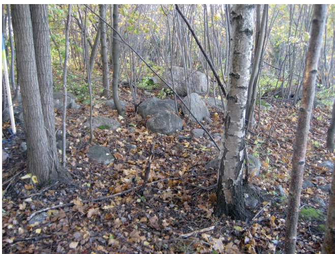
Epämääräinen kivikoinen muodostuma alueella 7.

Koekuoppa 4 tehtiin aivan alueen rajalla olevan kivikkoisen, halkaisijaltaan noin 4 m ja 30–40 cm korkean epämääräisen muotoisen kumpareen pohjoisreunaan. Paikalla oli isompien kivien yhteydessä pienempiä, 10-15 cm kokoisia kiviä parin neliön alalla. Kokonaisuutena kumpare vaikuttaa äskettäin muokatulta ja siitä ja sen ympäristöstä löytyy resenttiä materiaalia. Kuopan koko oli 40x30x20 cm. Kuopan pohjoiskulmasta löytyi heti maanpinnan alta kangasta ja sen alta halkaisijaltaan 12 cm ja 7,65 kg painoinen rautakuula, jonka ympärillä on kangassuikale. Kuopassa oli koko kaivussyvyydeltä kiviä ja humuksen sekaista hiekkaa ja sen alla ruskeasta vaaleanruskeaan väritään vaihteleva hiekka. Kuopan kaivu lopetettiin ja saavutettu taso merkittiin kuitukankaan palalla. Noin 15 cm syvyydestä, siis rautakuula syvemältä löytyi uuden ruskealasisen pullon pohja–kylkipala.