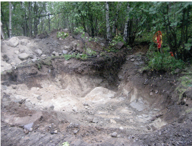
Kääntöpaikan koillisreunaan kaivettu alue ja siihen liittyvä koeoja.

Syyskuussa 2011 Tuupikkalanpolun kääntöpaikan ja sitä reunustavien metsittyneiden piennaralueiden muodostamalle kokonaisuudelle avattiin koneellisesti isoja tutkimusalueita sen selvittämiseksi, onko paikalla merkkejä tien rakentamisen yhteydessä löydettyksi kerrotuista luurangoista. Alueet olivat laajoja siksi, että jos luurangot olisivat hautakuopissa, niiden havaitseminen kapeasta ojasta olisi ollut epävarmaa. Isompien kuoppien kaivussa maata liikuteltiin enemmän, jolloin todennäköisyys irrallisten luiden havaitsemiseksi lisääntyi. Kääntöpaikalle, avattiin kolme aluetta, sen koillislaidalle noin 4 x 4 m laajuinen kuoppa ja siihen liittyvä koeoja, lounaislaidalle ja pientareelle hieman pienempi alue (3x2,5 m) ja sen jatkeeksi pientareelle ulottuva koeoja sekä kolmantena kuoppien ja aluetta rajaavan aidan välille noin 10 m pitkä koeoja. Lounaislaidan kuopassa ja aidan vieressä tehdyssä koeojassa todettiin maakerroksia, jotka selvästi osoittivat jotain toimintaa paikalla olleen. Resentin löytöaineiston perusteella toiminta ajoittuu lähinnä 1900-luvulle. Näihin kerroksiin todennäköisesti liittyi myös piennaralueella havaittu, nauvoja ja maatonutta puuta sisältänyt noin 40x30 cm kokoinen maajälki sekä betonivalu, jonka laidassa oli nykyaikaisista tiilistä tehtyä muurausta. Ruumishautoja tai merkkejä luurangoista ei sen sijaan löydetty.