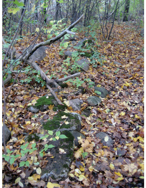
Kasvillisuuden alta paljastunutta aidan perustusta, johon liittyviä rakenteita pystyttiin erottamaan 60 m matkalla.