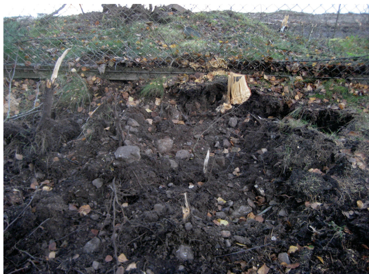
Polun tai aidan pohjustuskivikko on edellisten tutkimusten jälkeen tullut esiin myös aidan vierestä.

Kun tutkimuksia lokakuussa tehtiin, oli aiemmin tutkittu alue jo vapautettu maarakennustöitä varten, mutta se kuitenkin tarkastettiin vielä kerran. Pintahavainnoinnin lisäksi ei käytetty muita menetelmiä. Alueen 3 kumpareen laella oli syyskuun tutkimuksissa todettu sorasta tehty pohjustus tms. aidan polun vieressä. Maarakennustöissä sitä oli paljastunut myös itse polulta aidan kohdalta.