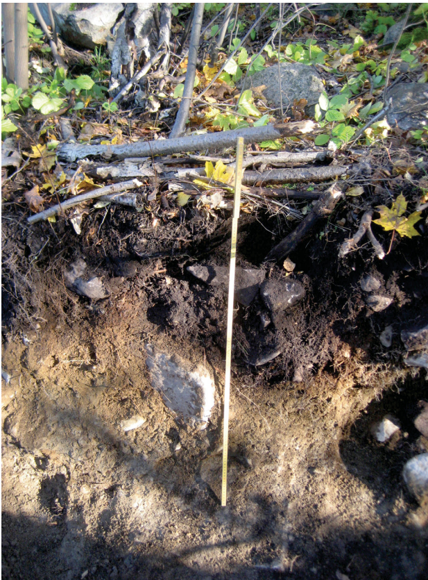
Koeijan 3 seinämä aidan perustan kohdalla.

Jälki erottuu toisessakin seinämässä, joskin ison maakiven takia epämääräisemmän muotoisena. Koska kuoppajäännös on ainakin tällä kohtaa pitkänomainen, lienee kyseessä aita telakka-alueen puolella reunustanut oja. Ojan ura ei erotu maanpinnalle eli maa ei ole ehtinyt painua täyttämisen jälkeen. Leveys pintaturpeen alapinnan tasolla on 60 cm ja syvyys keskikohdassa 40-45 cm.