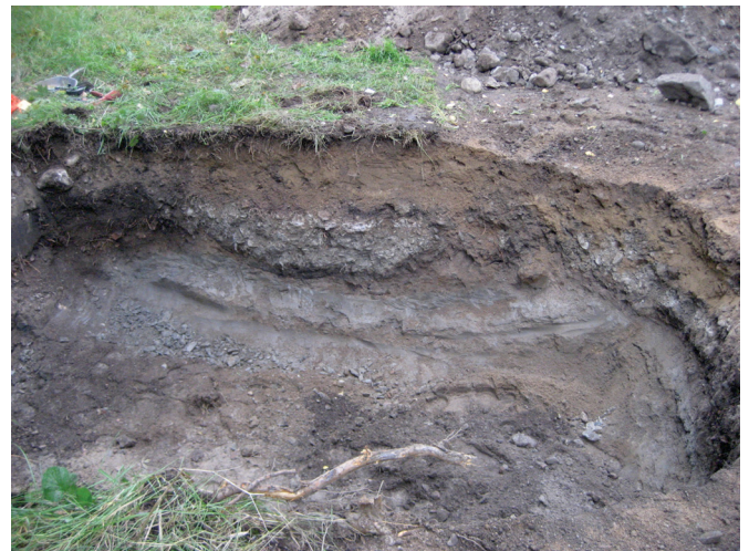
Kääntöpaikan lounaisreunalle kaivetun alueen seinämässä näkyviä maakerroksia.