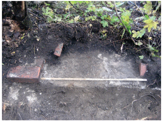
Kääntöpaikan lounaisen alueen pientareelle jatkuneessa koeojassa havaittiin myös melko uusi rakennuksen jäännös.