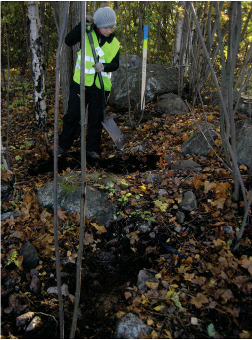
Etualalla kuoppa, josta kuula löytyi, taaempänä aloitetaan toisen kuopan kaivamista