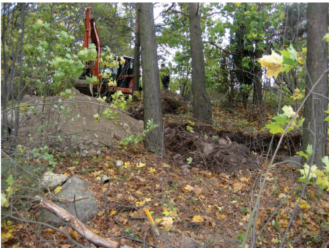
Koeojan 2 sijainti.

Koeojan ylärinteen eli kaakkoispään kohdalla maanpinnan korkeus on 19,34 m mpy ja luoteispään kohdalla 18,07 m mpy.