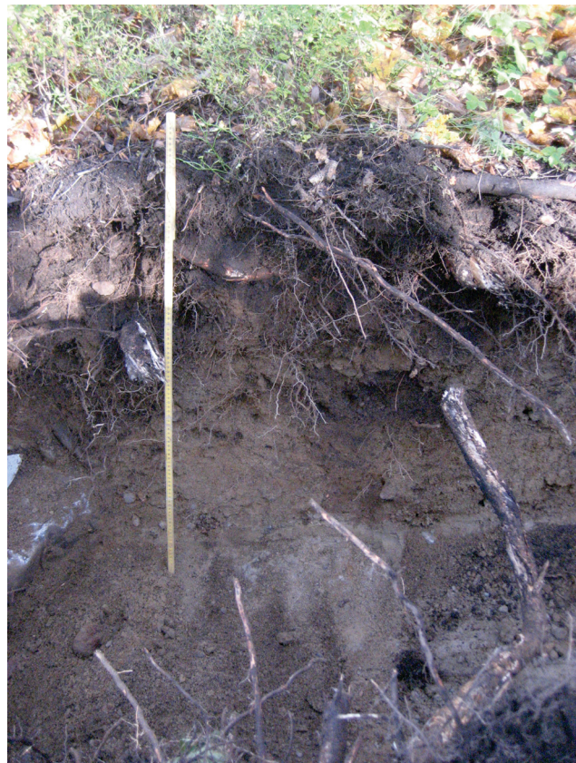
Koeojan 1 koillisseinämän maakerrokset.

Koeojan ylärinteen eli kaakkoispään kohdalla maanpinnan korkeus on 18,45 m mpy ja luoteispään kohdalla 17,69 m mpy.