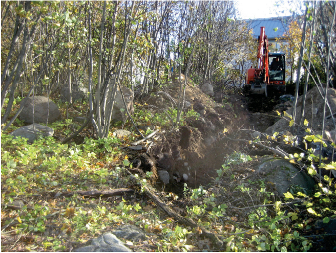
Koeijan 3 sijainti.