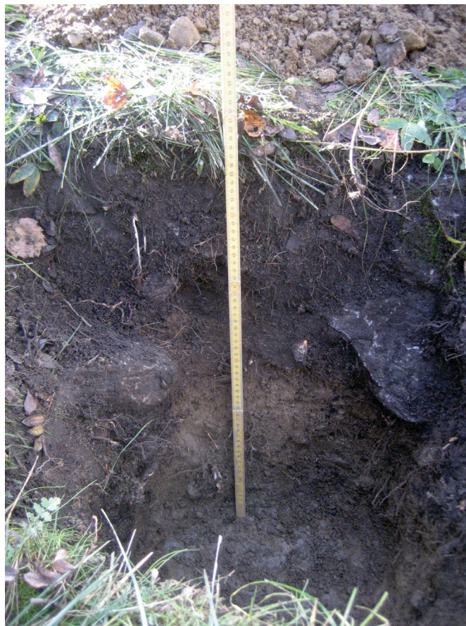
Koekuopan 3 länsiseinä.

Koekuoppa 3 kaivettiin alueelle 6 tasanteelle kallion itäpuolelle. Paikalla kasvaa sikoangervoa ja mahdollisesti ahdekauraa. Kuoppa kaivettiin 3,5 m uuden rajan reunasta pohjoisluoteen ja 7 m kallion reunasta itäkaakkoon. Se oli 50 x 50 x 60 cm kokoinen ja kaivettiin paikalla olleeseen vanhaan kuoppaan. Länsiseinä näyttäisi olevan ehjää maata: 0-5 cm ruohohumus, 5-25 cm juurien sekainen tumman harmaa humus, 25-33 cm ruskea soran sekainen hiekka, 33-52 cm keltainen soran sekainen hiekka, 52-60 cm vaalean harmaa savinen huuhtoutunut moreeni, jossa 5-15 cm kokoisia kiviä ja kosteana savinen maa. 5-25/33 cm syvyydessä oli isohkoja 25-25 cm kiviä jokunen kappale. Lopuksi koekuopan pohjoisreunaa laajennettiin niin, että se ulottui varmasti vanhan kuopan rajojen ulkopuolelle jolloin ilmeni, että ruskea hiekka alkoi kivien alapinnan tasolta noin 15-25 cm syvyydestä.