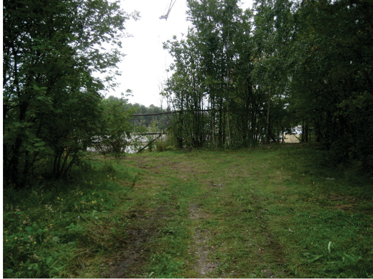
Alue 5, Tuupikkalanpolku ja kääntöpaikka, vallimaiset rakenteet ovat sijainneet kuvan oikeassa laidassa.

Alueen 5 muodostaa vahvasti muokatun Tuupikkalanpolun sorapohjainen, heinittynyt tieura, sen pohjoispäässä oleva kääntöpaikka ja piennaralueet sekä kääntöpaikan itäpuolella olevat vallimaiset rakenteet. Kääntöpaikka on noin 10 x 15 m laaja ja sen pohjoisosan yli kulkee aitaa reunustava polku. Kääntöpaikan koilliskulmasta näyttää lähtevän ainakin kaksi eriaikaista, nyttemmin käytöstä jäänyttä tielinjausta alas rinnettä kohti telakka-aluetta.