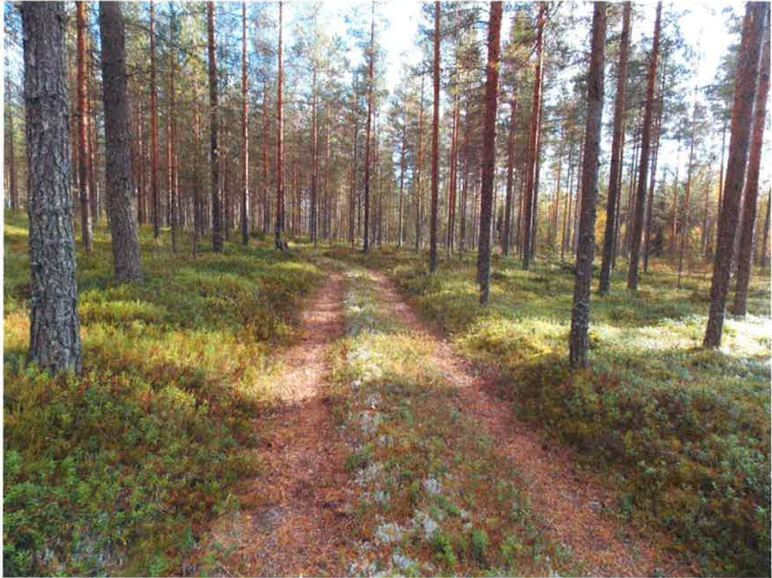
Yleiskuva kvartzialueelta itäkaakkoon kohti kuoppaa 1.