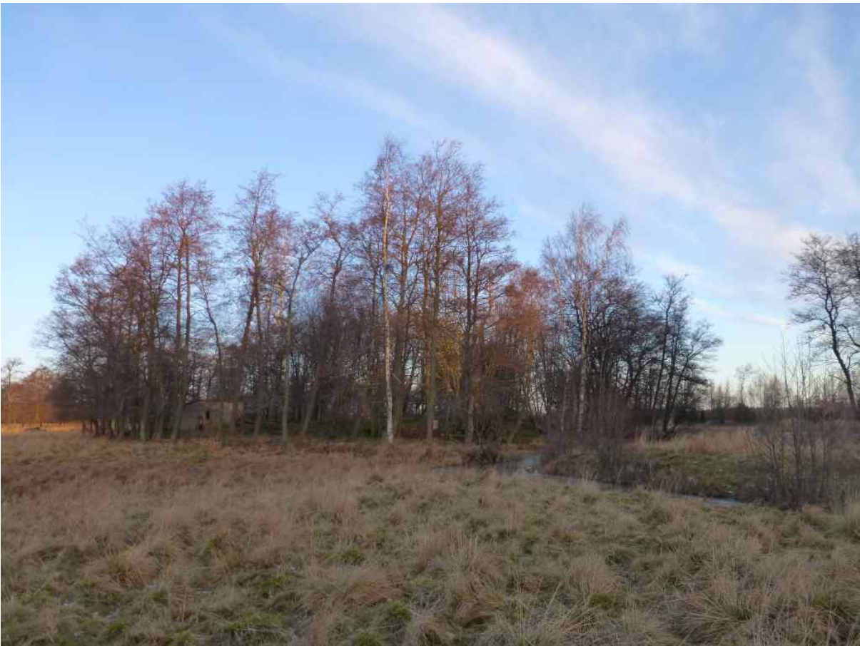
Norssikari kuvattuna kaakosta