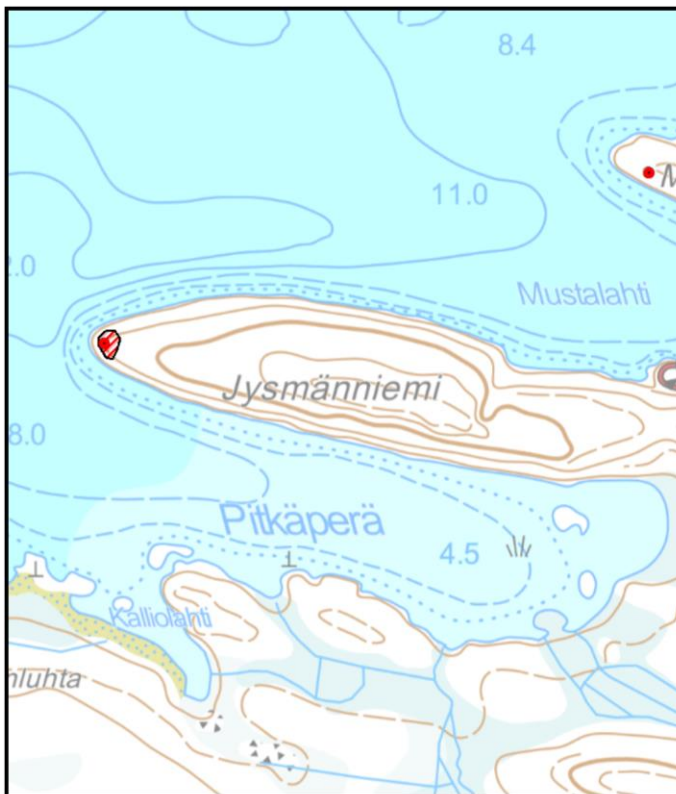
Kartta 2. Kohde rajattuna. Museoviraston tietokanta ja Maanmittauslaitos.