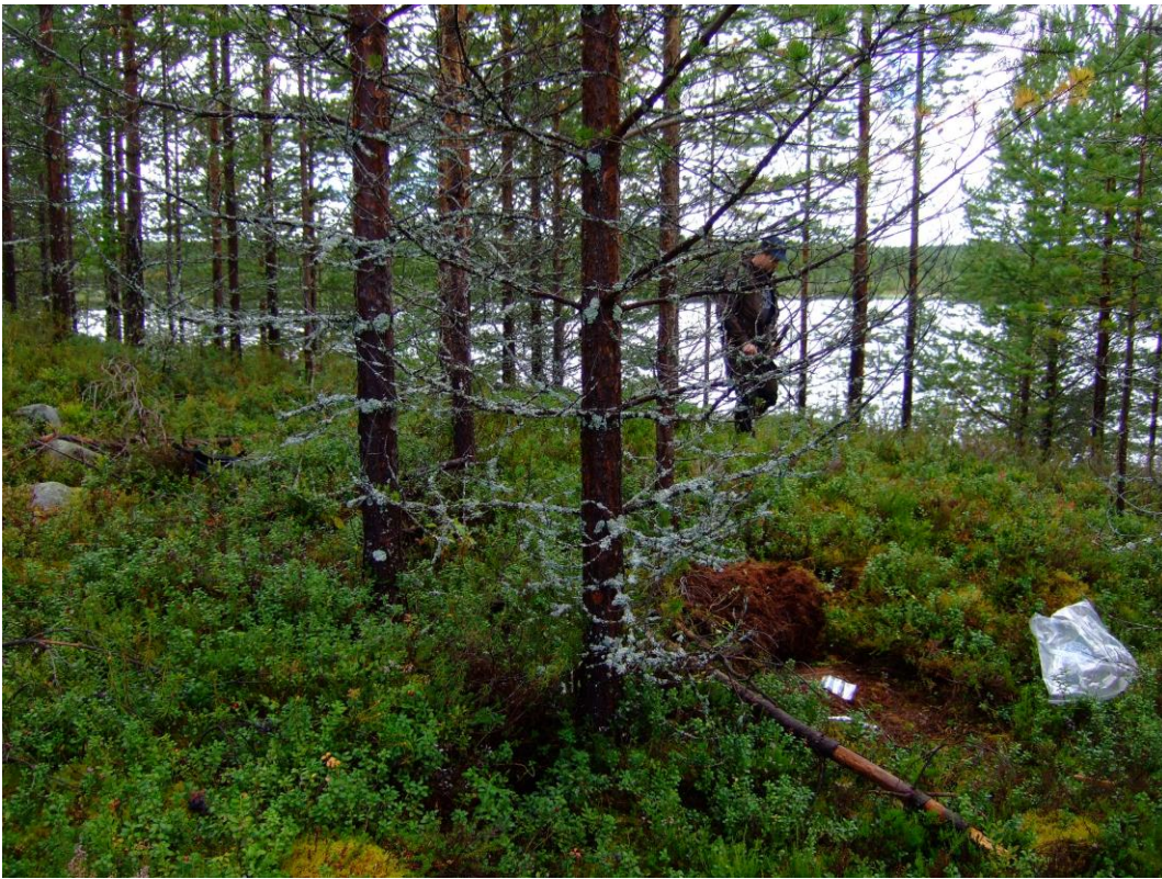
Kuva 5. Yleiskuva kohteesta, kuvattu koillisesta. KaiM 8193_5