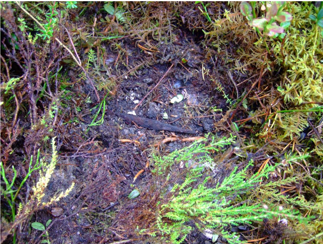
Kuva 3. Veitsi löytöpaikassaan. KaiM 8193_3