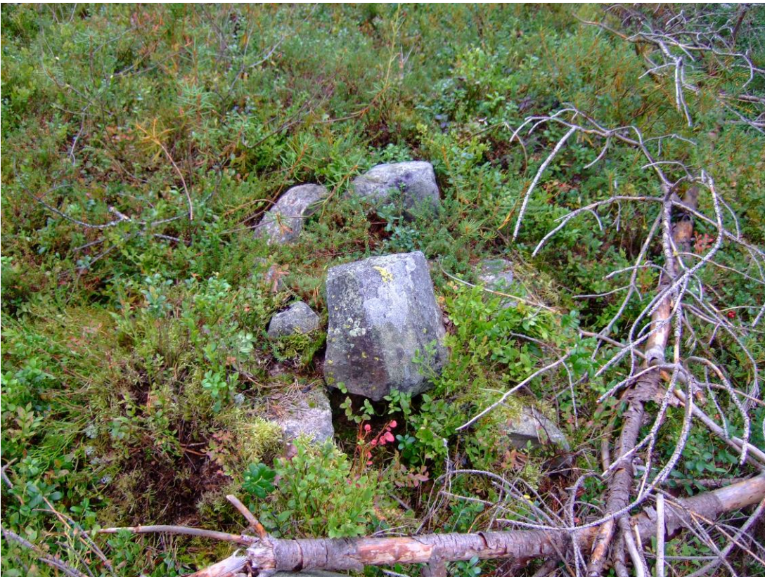
Kuva 4. Kivilatomus, kuvattu pohjoisesta. KaiM 8193_4