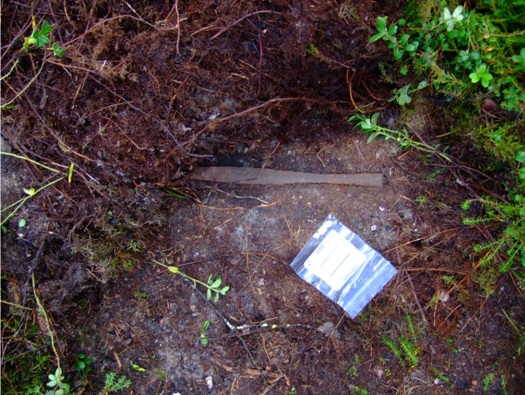
Kuva 1. Putkivartinen keihäänkärki löytöpaikassaan. KaiM 8193_1