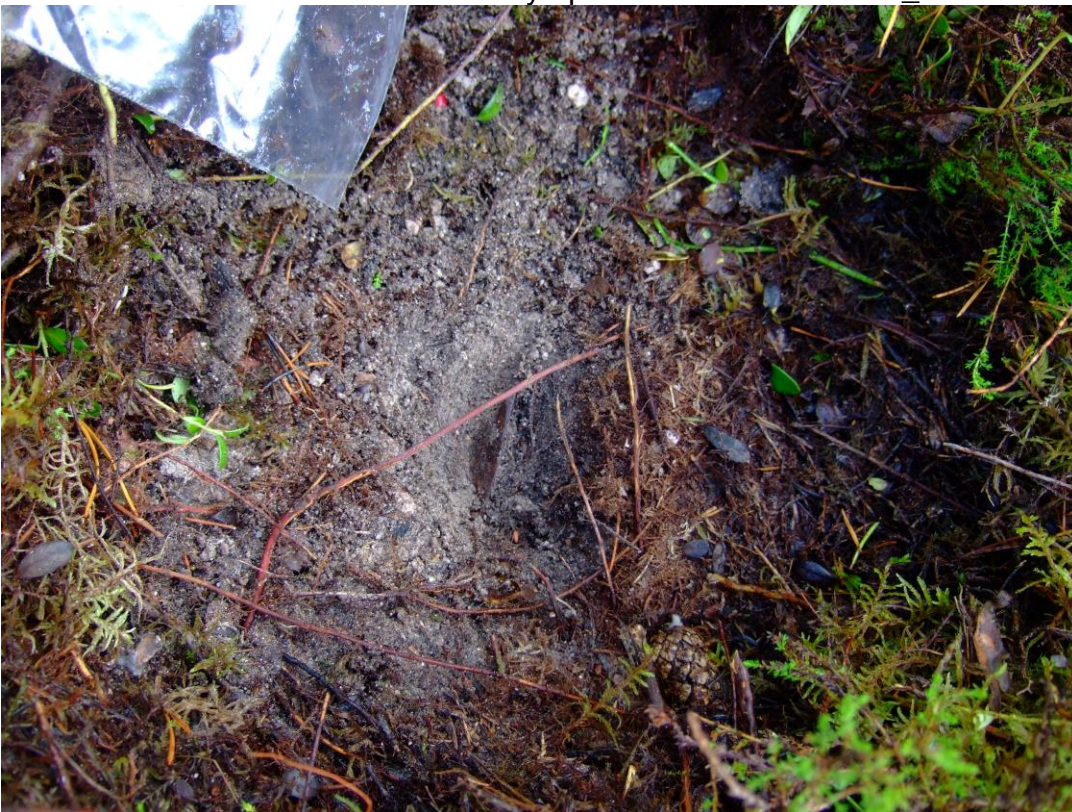
Kuva 2. Nuolenkärki löytöpaikassaan. KaiM 8193_2