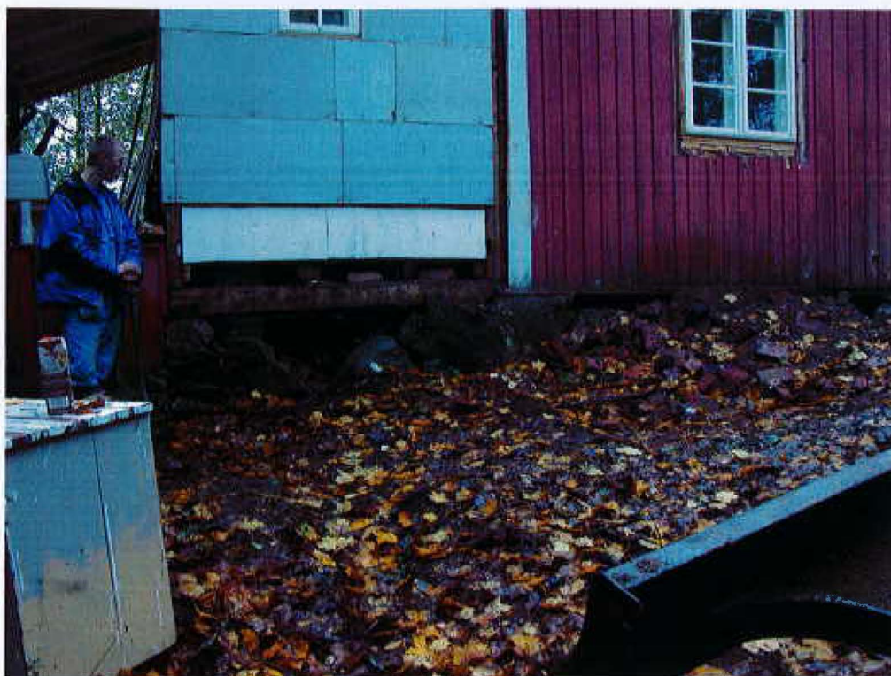
1. Asuinrakennuksen edustan maanpintaa ennen viemärikaivannon avaamista. Kuvattu koillisesta.