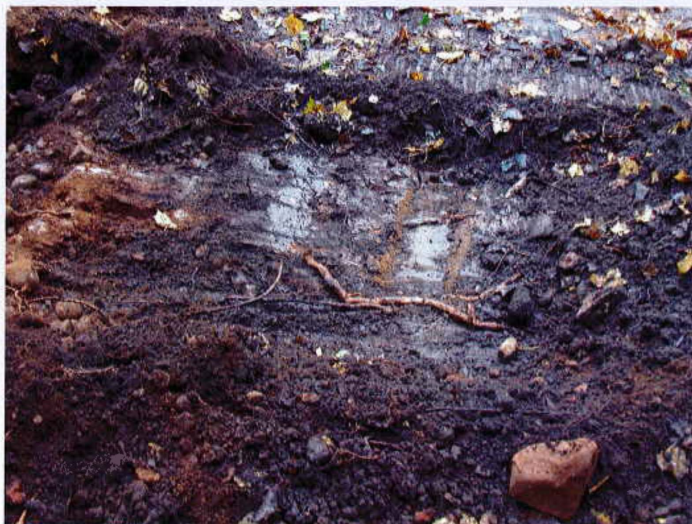
2. Viemärikaivannon pintakerrosten kaivaminen, esillä sekoittunut humuksensekainen hiekka. Kuvattu idästä.