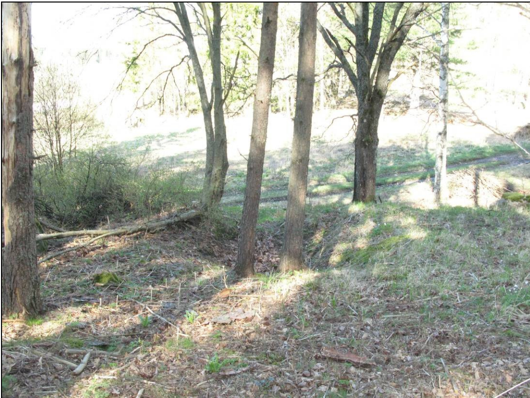
Kuva 2: Rakennuksen pohja Edön kartanon tontilla.

Yhtenäiskoordinaatit: pkoo: 6 696 632, ikoo: 3 445 696 (GPS-mittaus rakennuksen pohjan keskeltä)