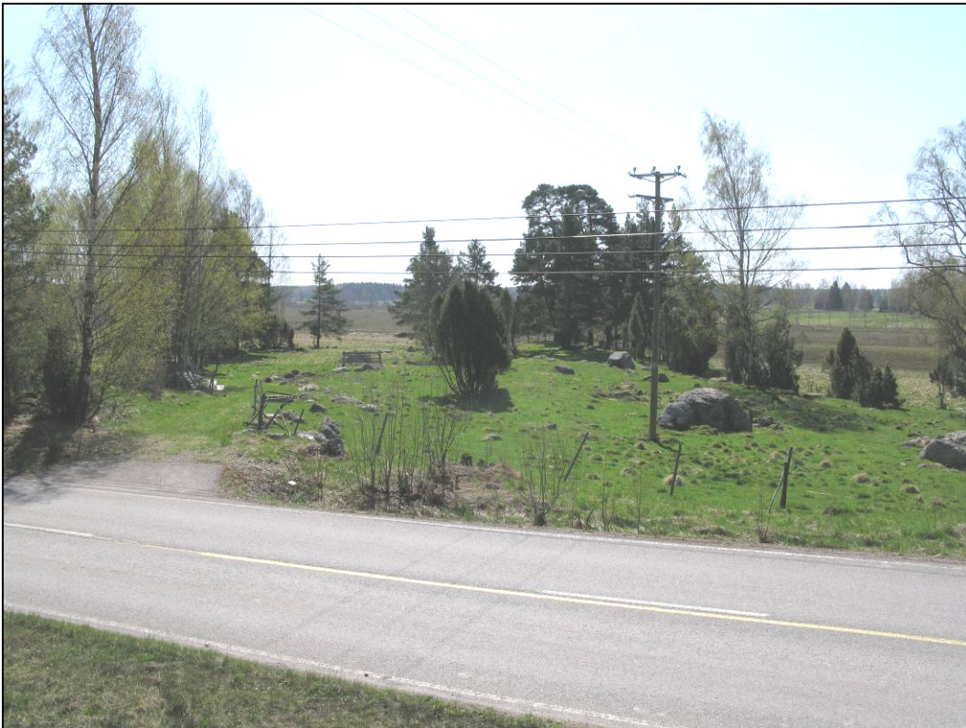
Kuva 3: Edesby kuvattuna pohjoispuoliselta mäeltä.

Yhtenäiskoordinaatit: pkoo: 6 696 491, ikoo: 3 445 732 (kylän alueen laskennallinen keskipiste)