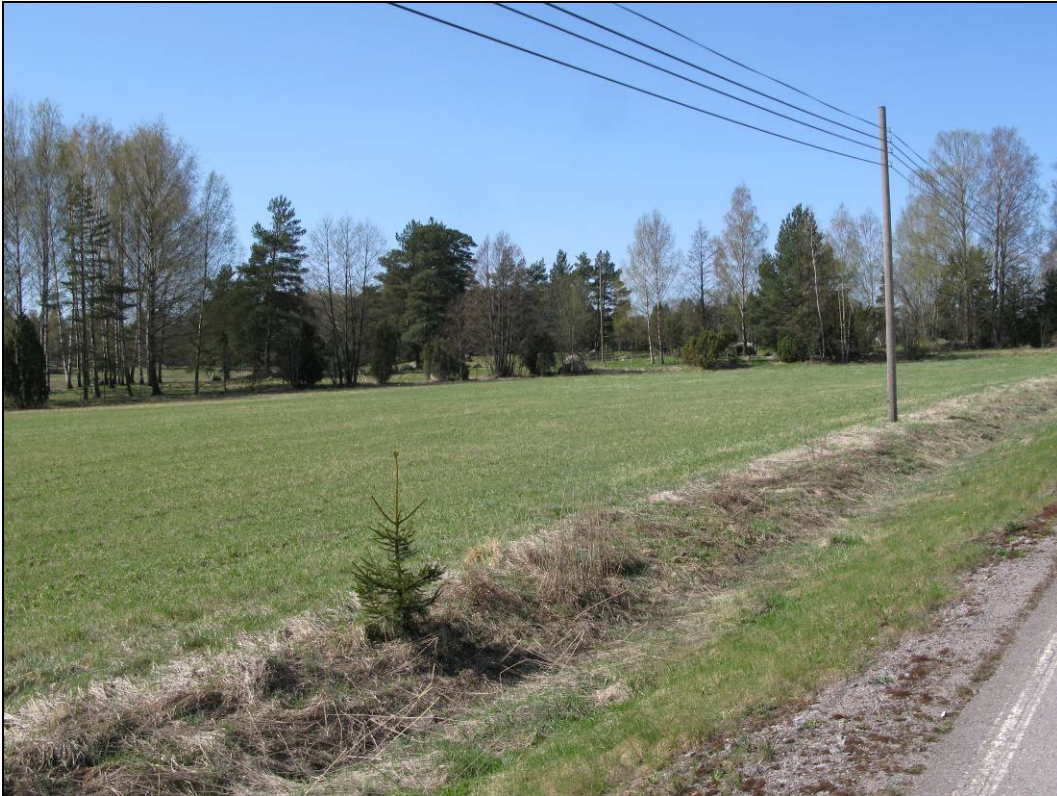
Kuva 1: Edesby kuvattuna idästä.