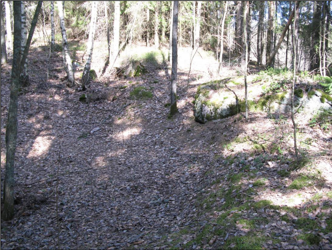
Kuva 5: Majakuopan pohja.

Kartanonmäen luoteispuolisella mäellä on iso kuoppa (halk. 10 m, syv. n. 1 m.) Kuoppaa kiertää valli. Kyseessä saattaa olla ensimmäisen maailmansodan aikaisten linnoitteiden rakentamisen aikainen majakuopan jäännös.