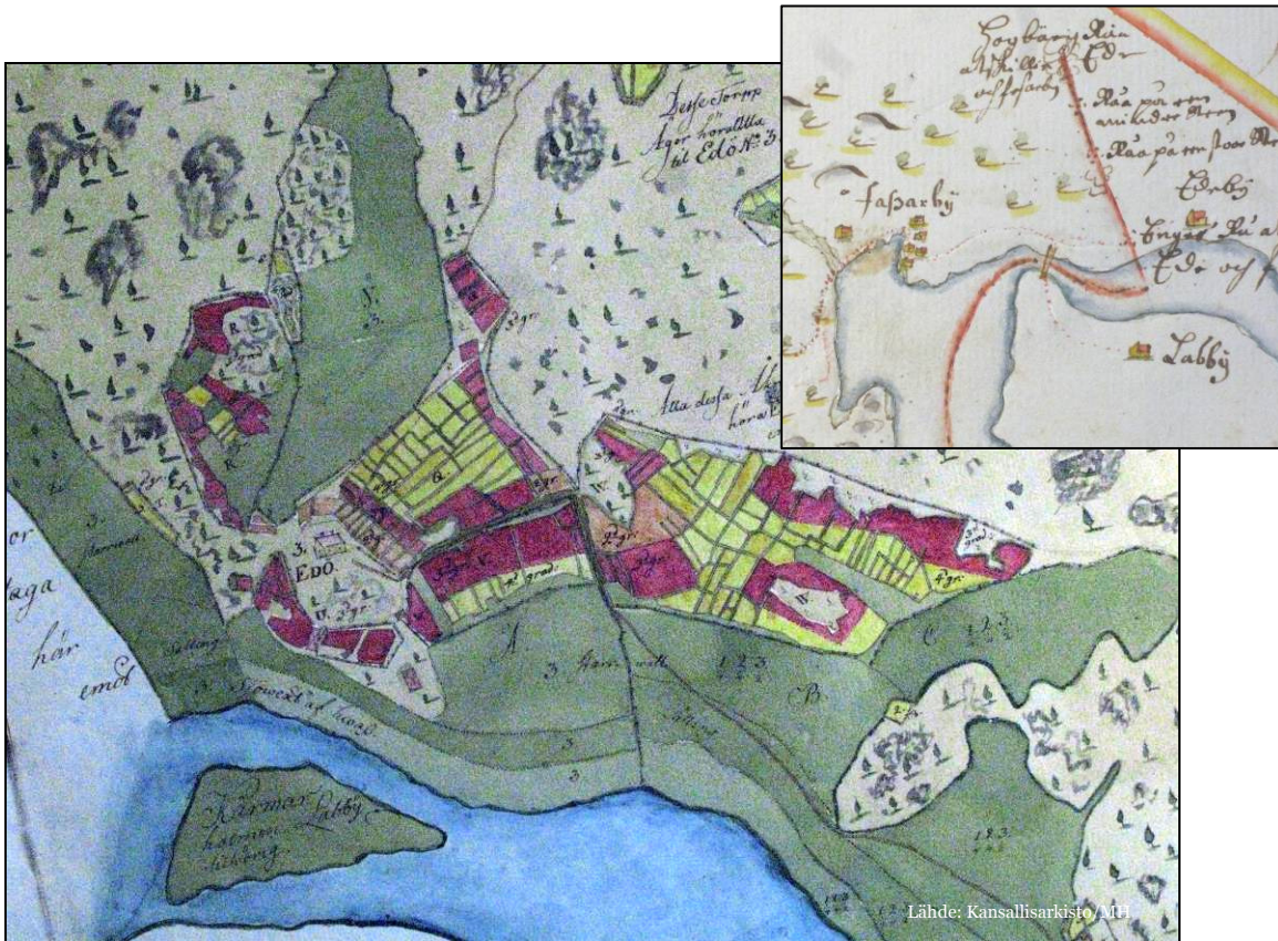
Kartat 1-2: Suuressa karttaan on merkitty Edön kartano vuonna 1755. Oikeassa yläkulmassa on Samuel Broteruksen vuonna 1700 laatima Fasarbyn metsäkarta.

Edesby mainitaan ensimmäisen kerran Porvoon läänin vuoden 1543 maakirjassa. Kylässä oli tuolloin neljä tilaa (3 täysveroa). Edesby päätyi aatelisten käsiin jo 1560-luvulla ja vapaista talonpojista tuli Isnäsin kartanon alaisia lampuoteja. Edö nimi ilmaantuu lähteisiin 1620-luvulla. Samalta vuosikymmeneltä ovat säilyneet ensimmäiset tiedot Edön säteristä.