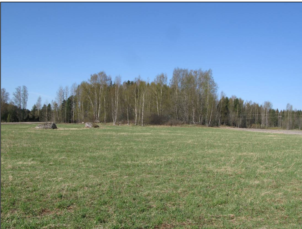
Kuva 4: Riihitontti kuvattuna kaakosta.

Yhtenäiskoordinaatit: pkoo: 6 696 616, ikoo: 3 445 849 (alueen laskennallinen keskipiste)