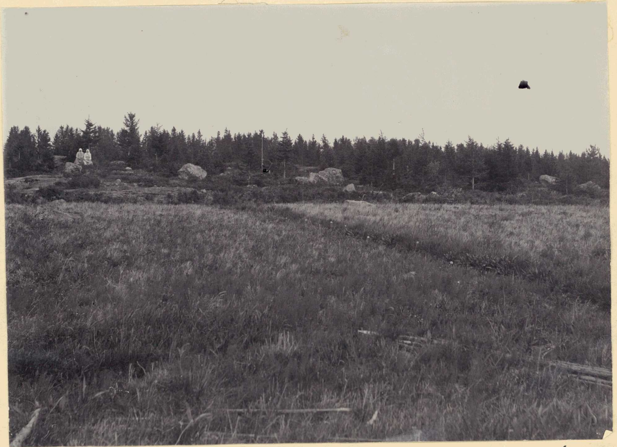
2. Pääkköönmäki nähtynä W:stä, a roomalaisen viini- kauhan löytöpaikka. 2883-4