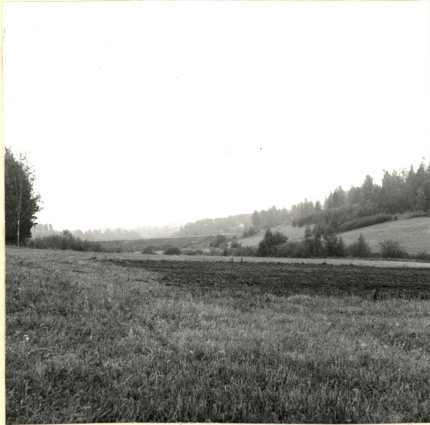
ASUINPAIKKALÖYTOJÄ PELLOSTA. TAUSTALLA LAHDEN MAANTIEN PENKKA. KUVATTU LUOTEESTA. M. HUURRE 1970