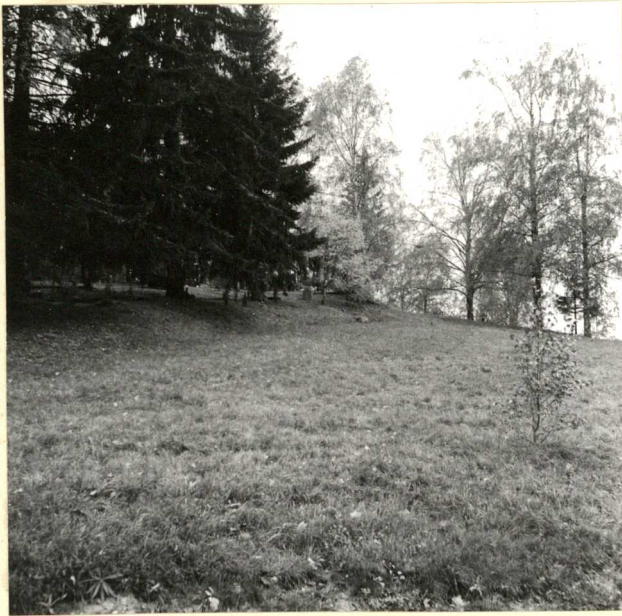
3. KÄTKÖN LÖYTÖPAIKKA KUVAN KESKIVAIHEILLA NÄKYVÄN HAUTA- KIVEN LUONA. KUVA KOILLISESTA. VRT. A. EUROPAEUKSEN KEAT. 1921 KUVA 3 (R. 5553)