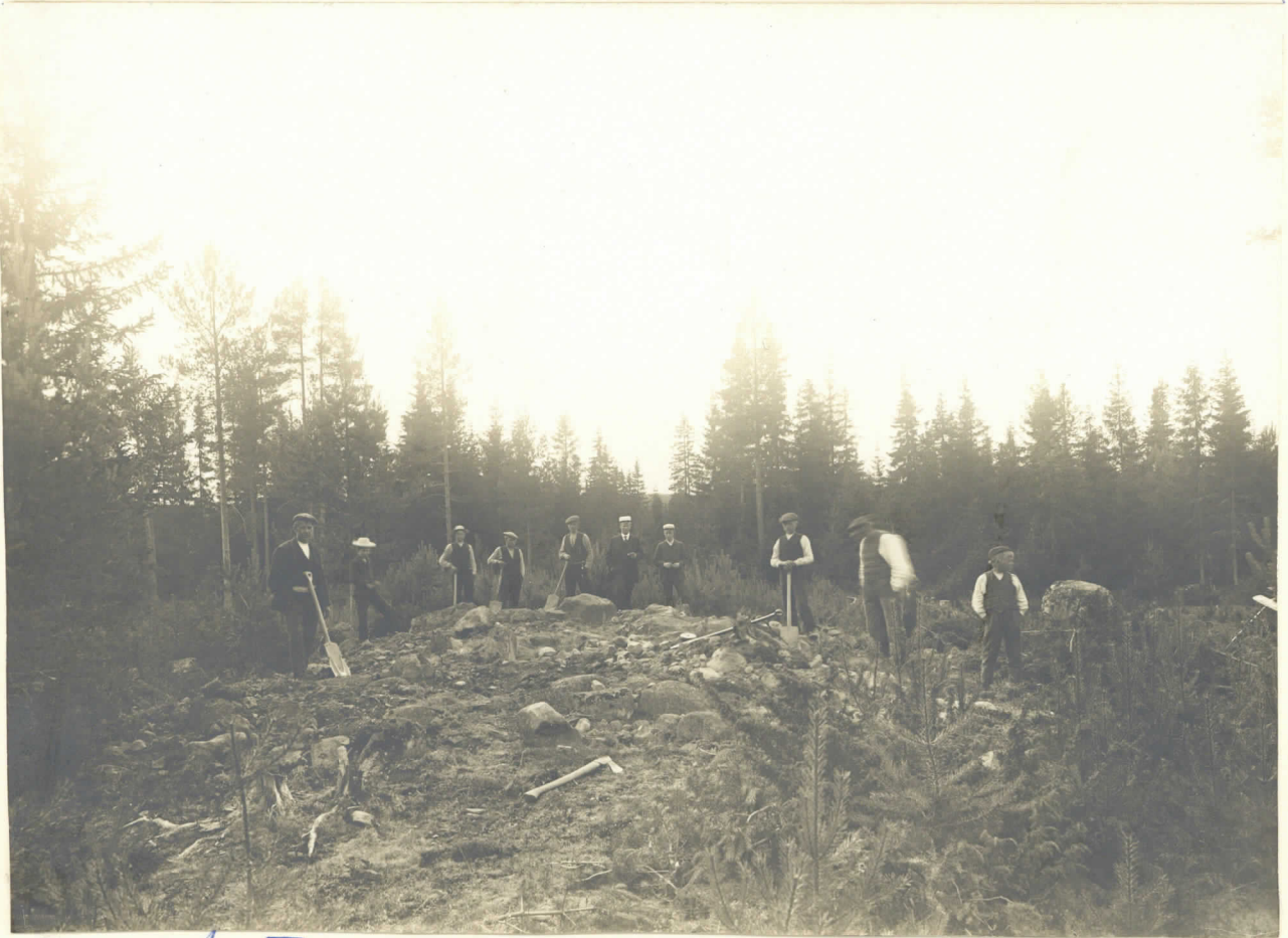
Rauniot I ja II ennen avaamista.

Pronnikautisia raunioita Nakkilan kyllyseen sulmalla. 1912.