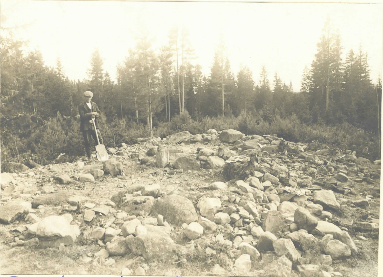
Rauniot I ja II avattuina. Kuvatut loillisesta.