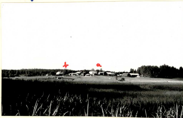
1. TALORYHMÄ KUVATTUNA VEHKJÄRVEN YLI LEHTINIEMEN (PAIJÄRVI 25) NW-KÄRJESTÄ