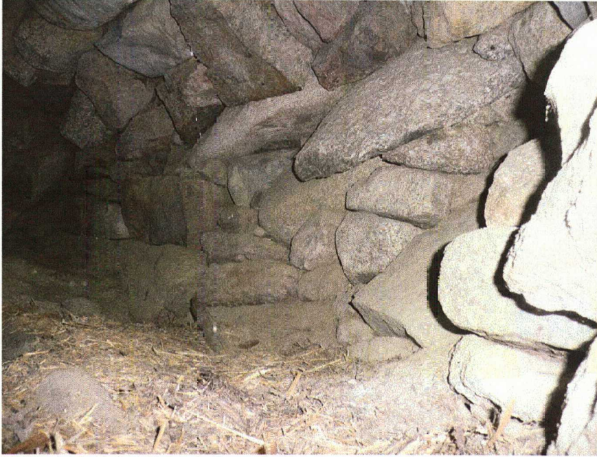
Kellarin holvin oikea laita