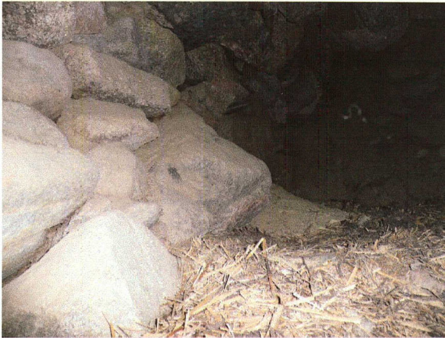
Kellarin holvin vasen laita