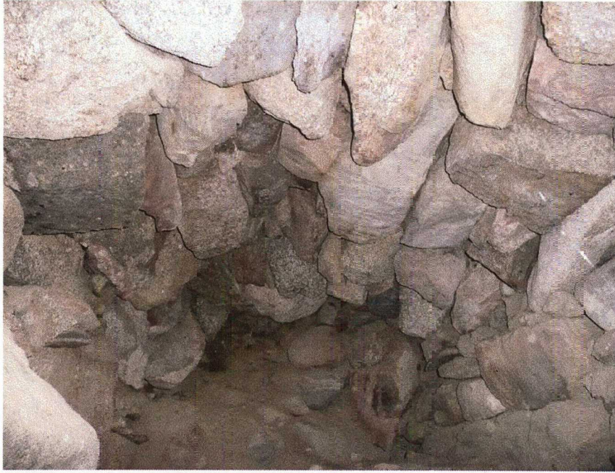
Kellarin holvin keskiosa