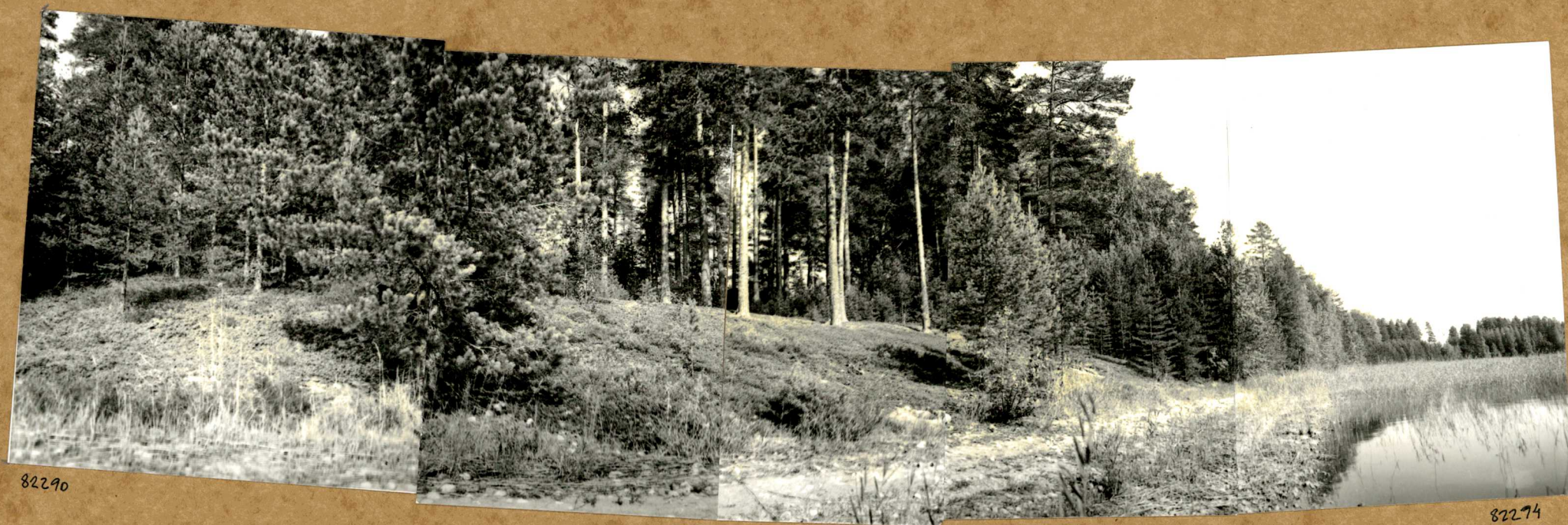
Yleiskuva. Panoraama Ristiniemen kärjestä, eteläranta. SW-NE.