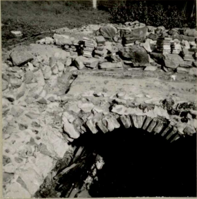
13. NEG. RHO 60507