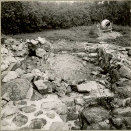
NEG. RHO 60495