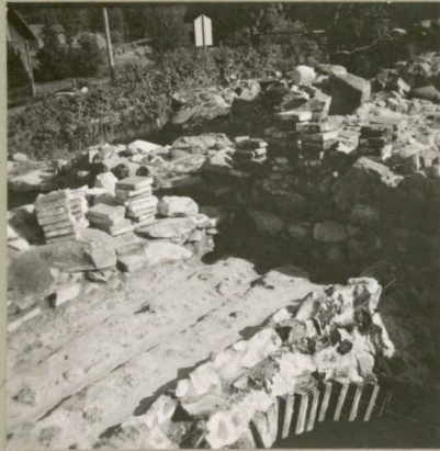
14. NEG. RHO 60508