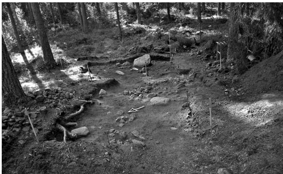
141628. Kaivausalue tasossa 3. Luoteesta.