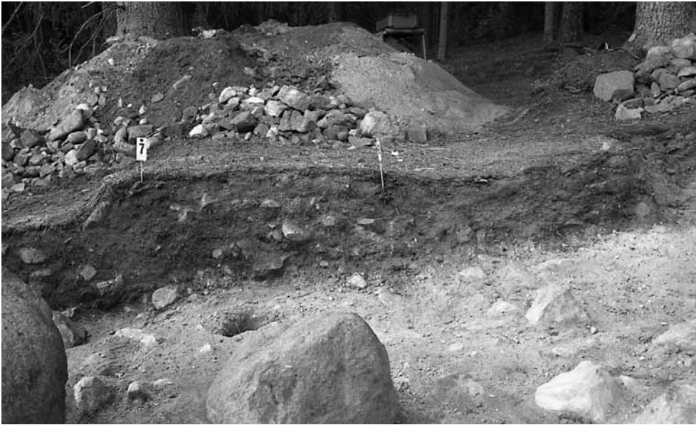
141669. Kaivausalueen länsiprofiilia. Idästä.