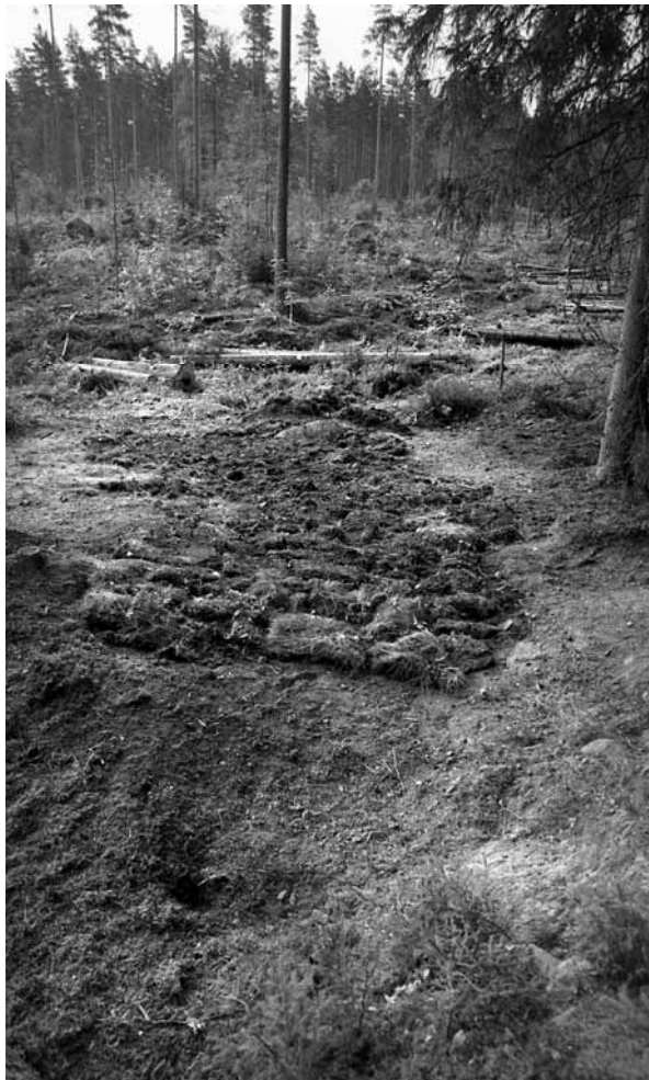
141671 Kaivausalue peitettynä. Luoteesta