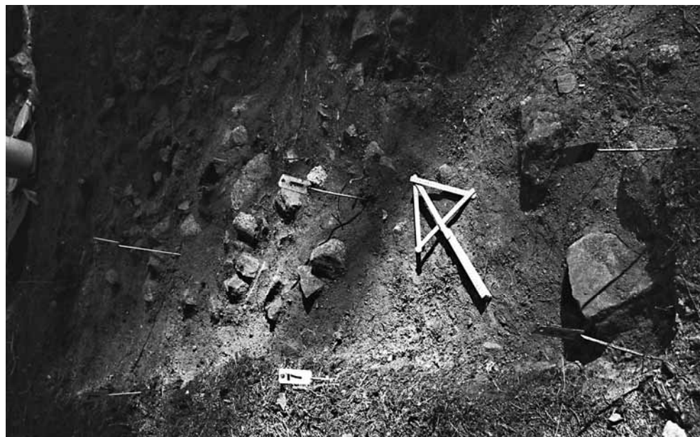
141621. Kaivausalueen lisäosa lounaassa 3x0,5 m suuruinen alue. 10 cm poistettu, taso 1. Kaakosta