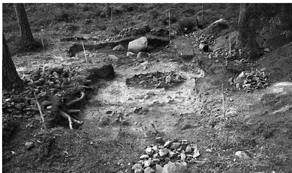
141641. Päävaivausalue tasossa 5. Luoteesta.