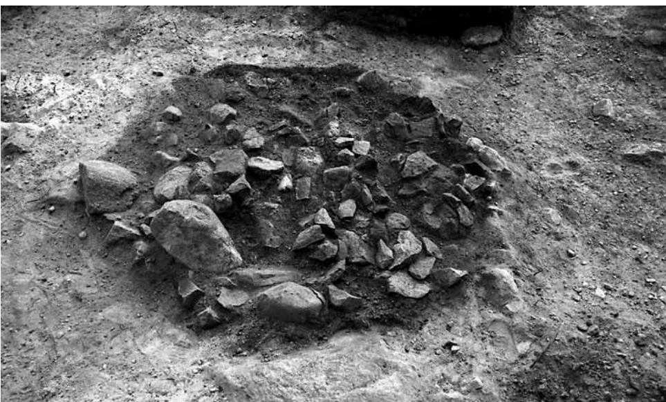
141639. Kuoppaliesi tasossa 4. Poh- joisesta.