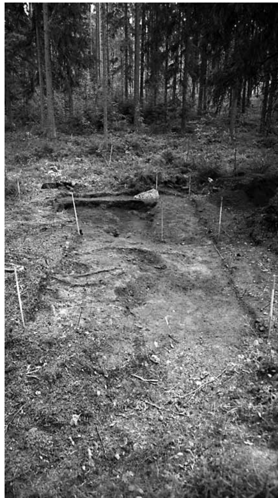
141611. Pintakerros poistettu.