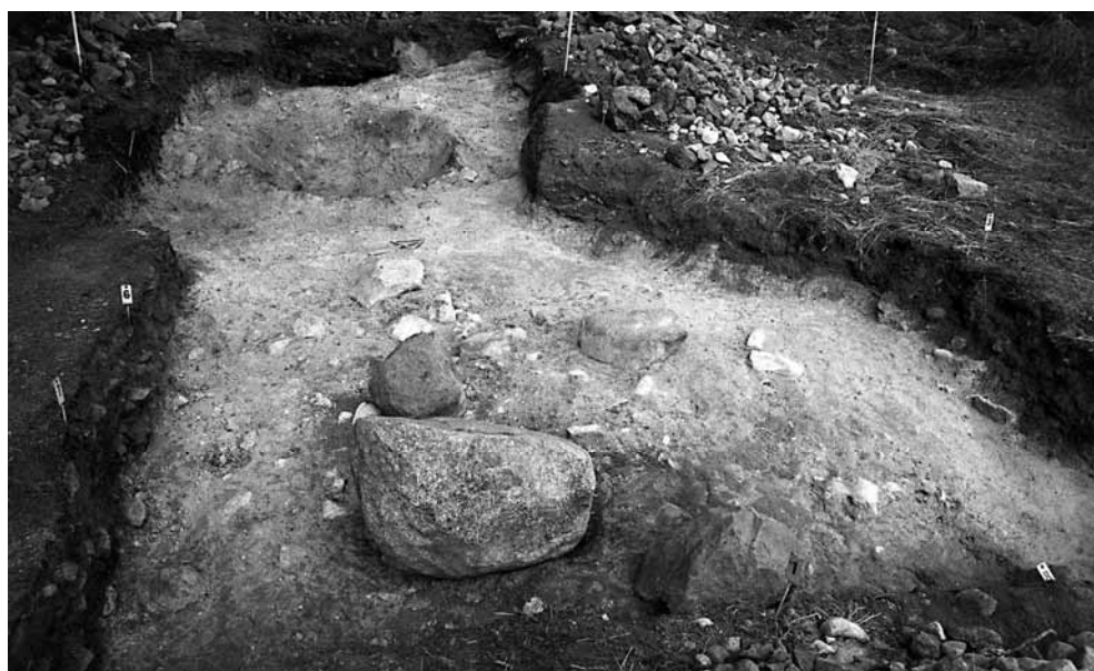
141665. Kaivausalue pohjaan kaivettuna. Kaakosta.