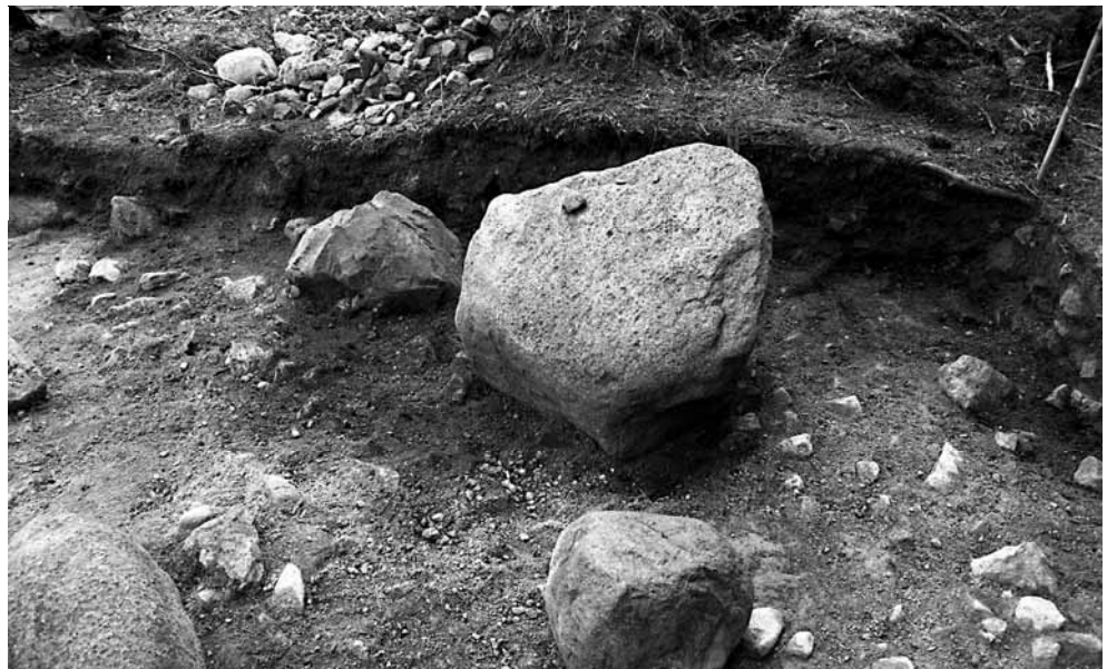
141659. Kaivausalueen eteläosa tasossa 7. Kivien ympärillä oli keramiikka- eskiä. Lounaasta.