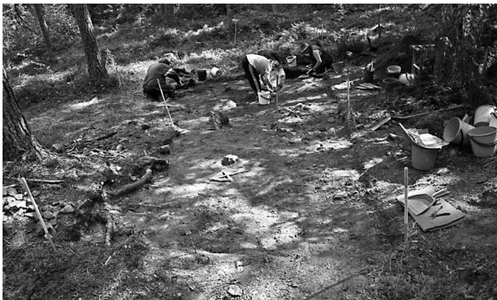
141619. Kaivausalueen pohjoisosassa, ensimmäinen kerros eli 10 cm poistettu. Luoteesta.