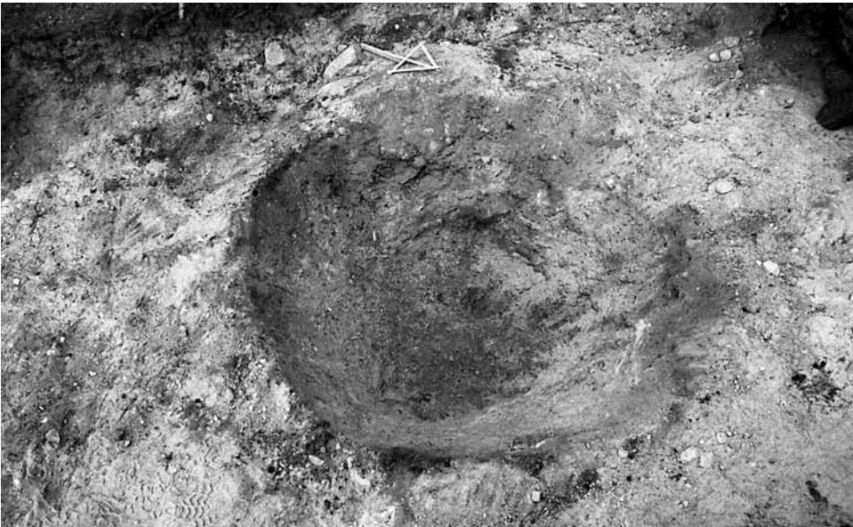
141663. Kuoppaliesi pohjaan kaivetuna. Koillisesta.