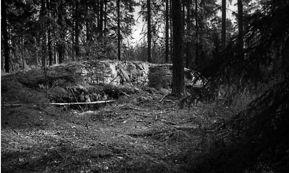
141608. Tahtmaan kaivaussalue ennen kaivausten aloittamista