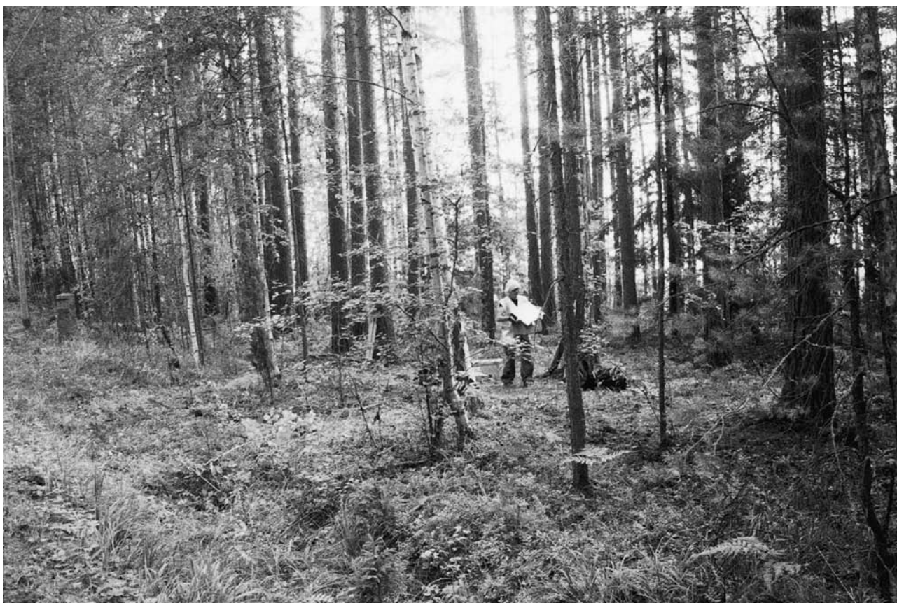
f. 142897 Alue 1 täytettynä. Lounaasta.