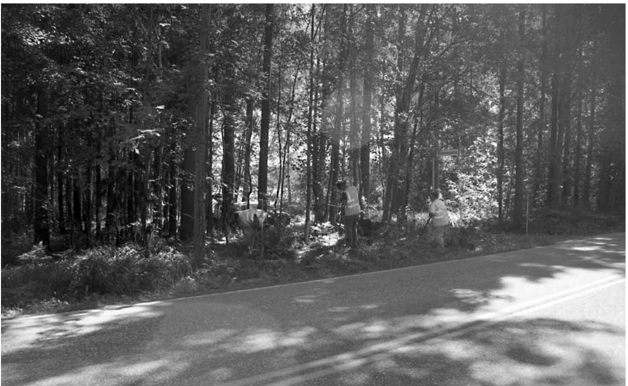
f. 142866 Turpeenpoistoa alueelta 2 (4964–4970/995–996). Pohjoisesta.