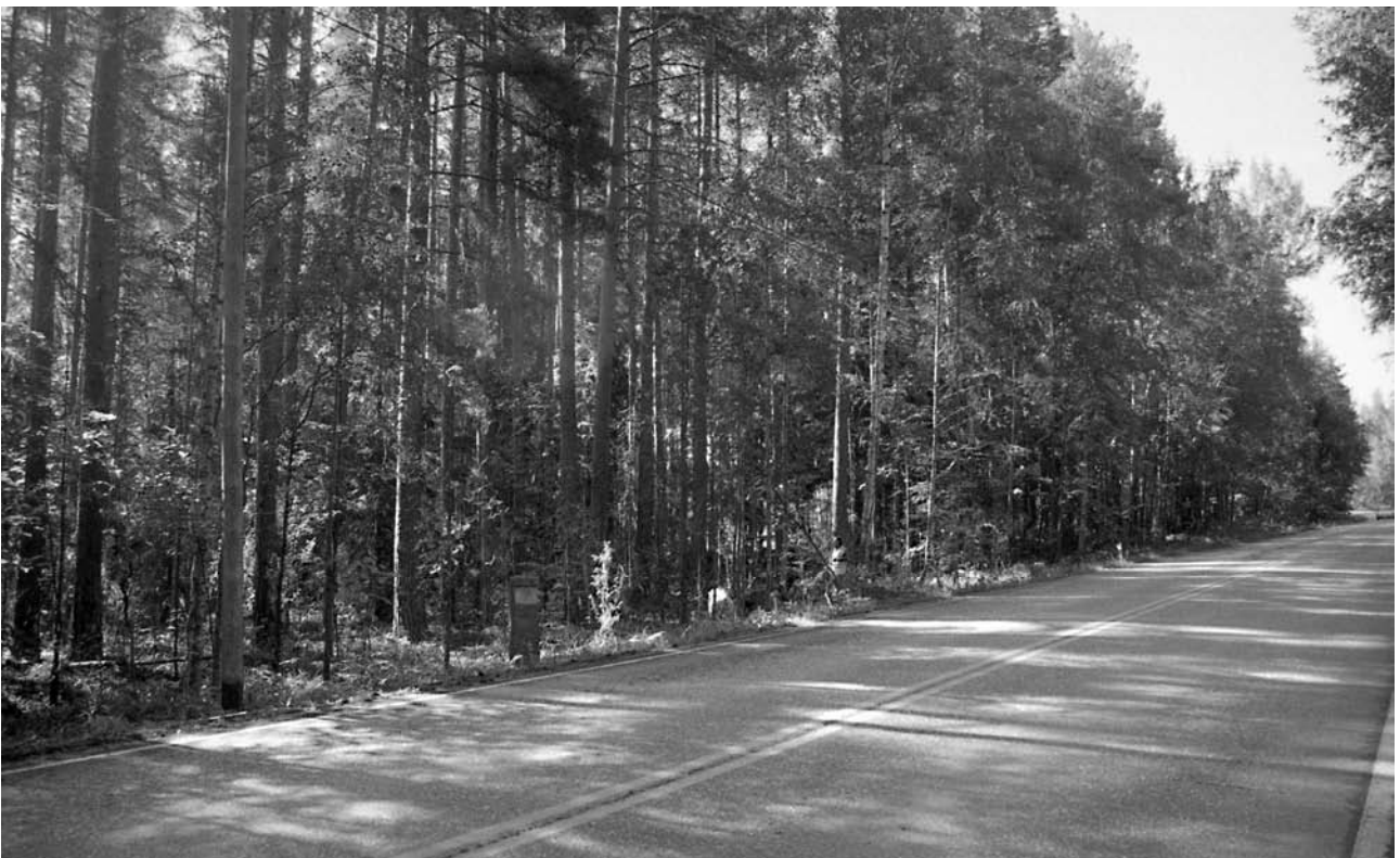
f. 142861 Yleiskuva, tutkittavan alueen keskiosa. Alue 1 sijaitsee kuvan keskellä tienvieressä kilometripylvään oikealla puolella. Pohjoisesta.