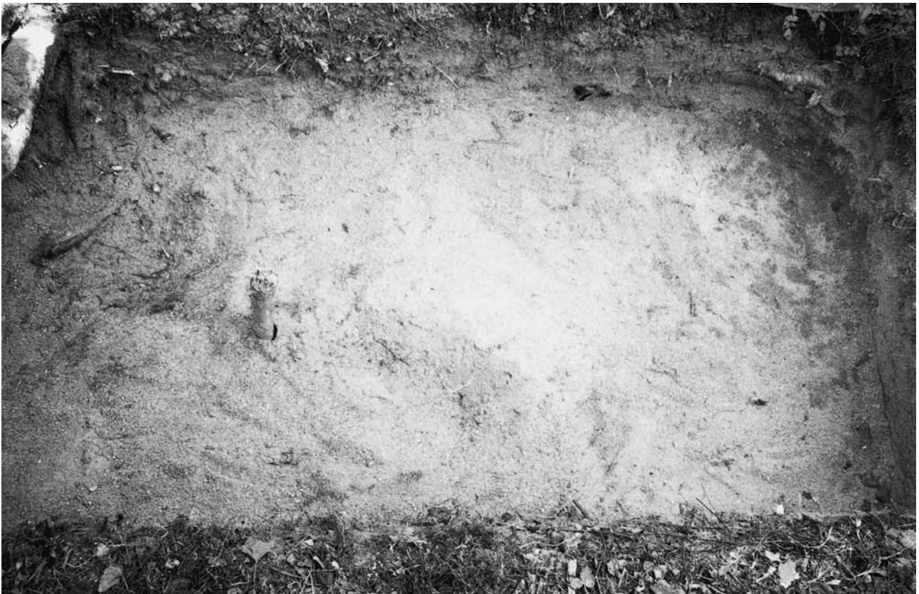
f. 142893 Koekuoppa 2 (5029–5030/1001–1003) tasossa 4 eli pohjaan kaivettuna. Etelälounaasta.