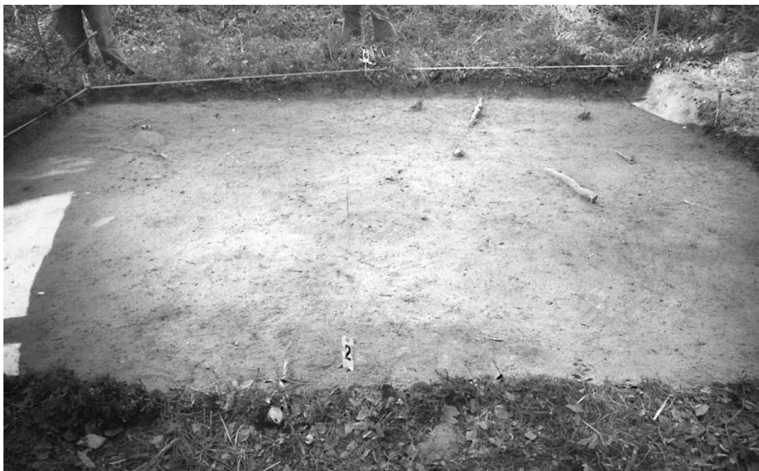
f. 142863 Alue 1 (5006–5010/998–1001) tasossa 1. Itäkaakosta.