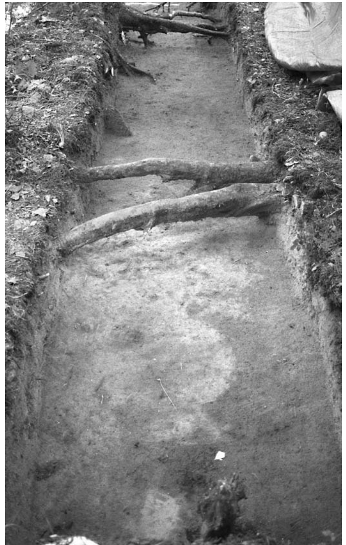
f. 142878 Alue 1 (5000–5006/1000–1001) tasossa 4. Etelälounaasta.