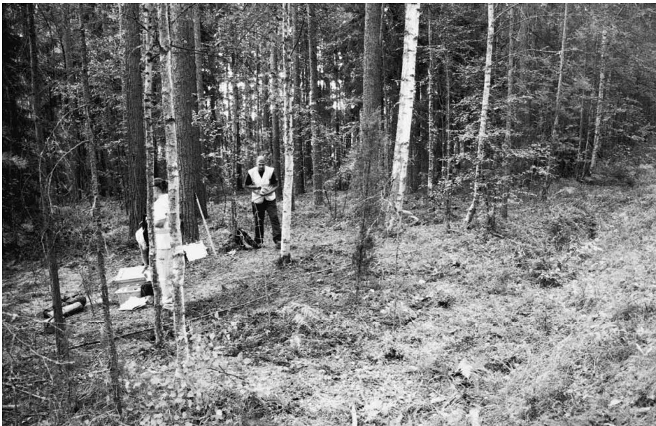
f. 142896 Alue 1 täytettynä. Pohjoisesta.