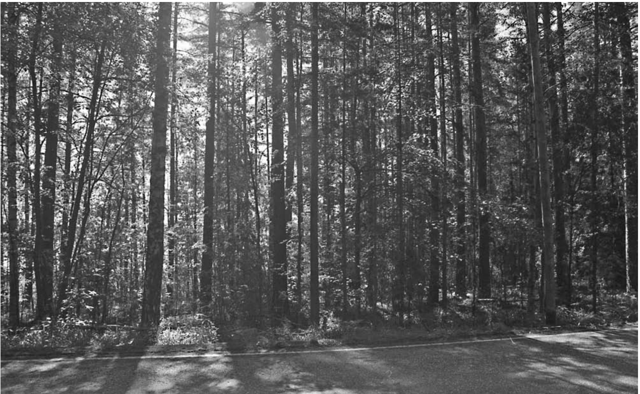
f. 142860 Yleiskuva, tutkittavan alueen pohjoisosa. Luoteesta.