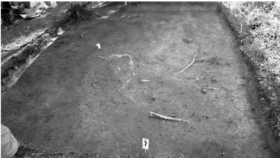
f. 142868 Alue 1 (5006–5010/998–1001) tasossa 2. Itäkaakosta.