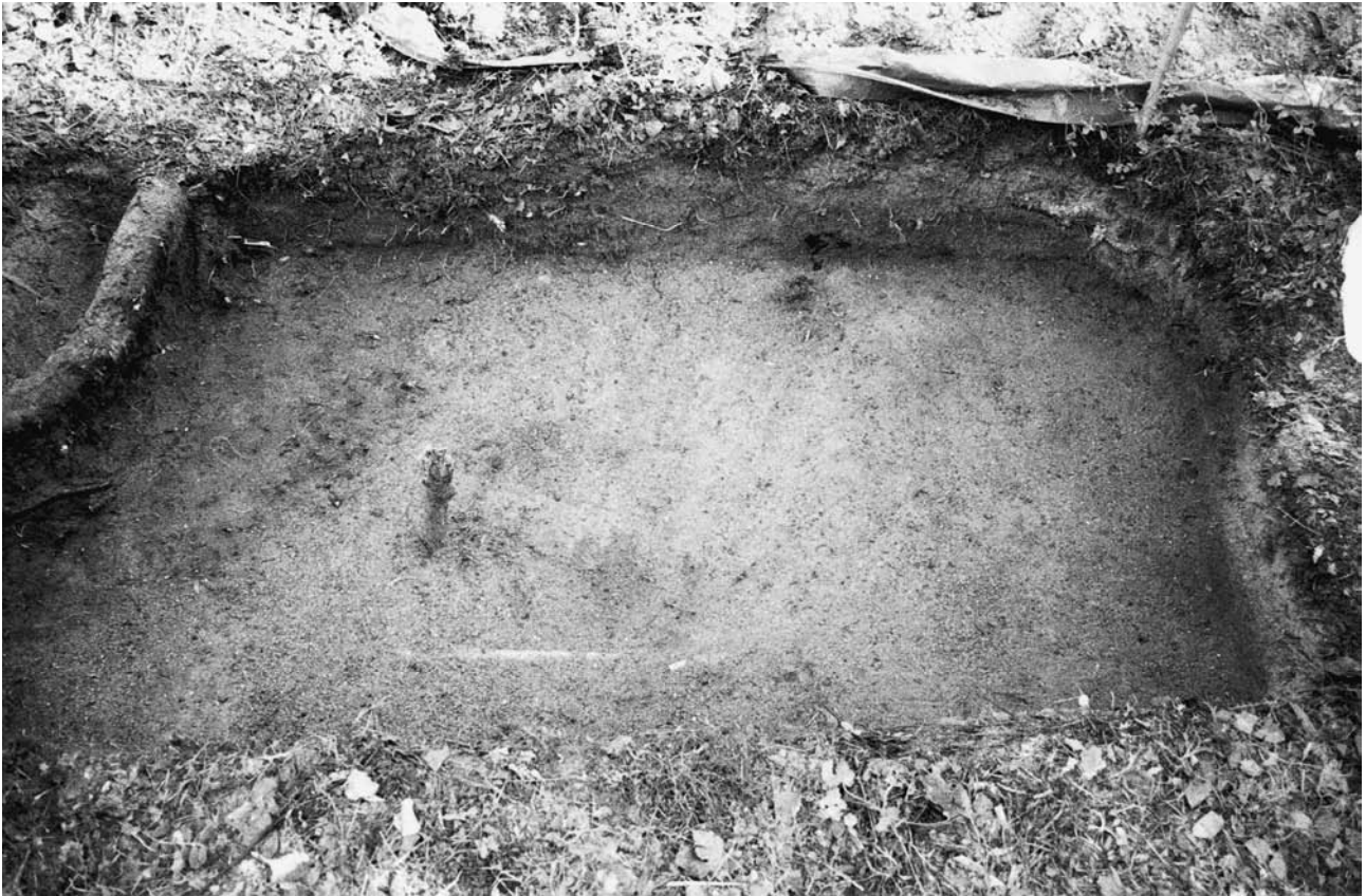
f. 142891 Koekuoppa 2 (5029–5030/1001–1003) tasossa 3. Etelälounaasta.