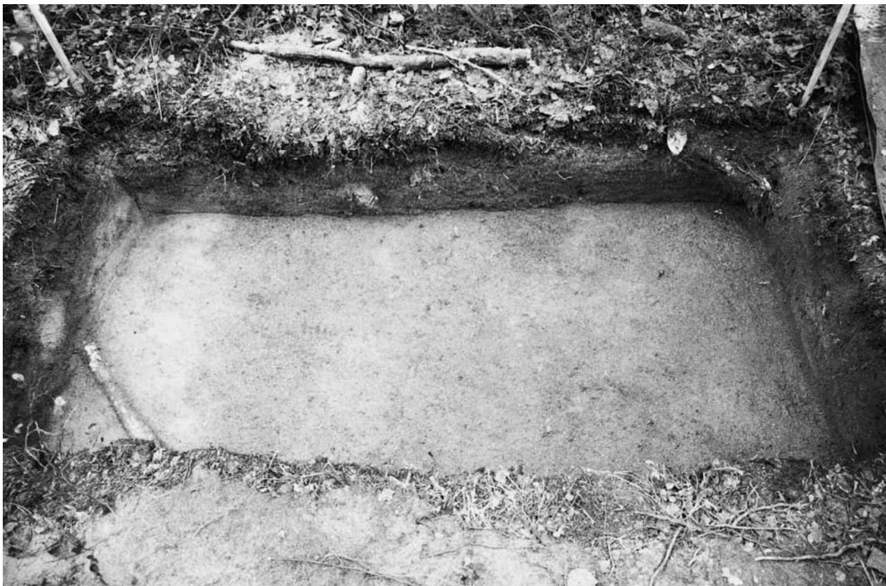
f. 142890 Koekuoppa 1 (4983–4984/999–1001) tasossa 4. Etelälounaasta.