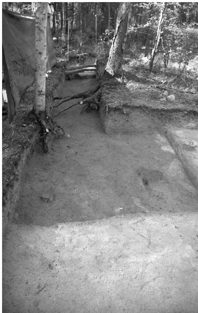
f. 142881 Alue 1 tasossa 6. Pohjoiskoillisesta.