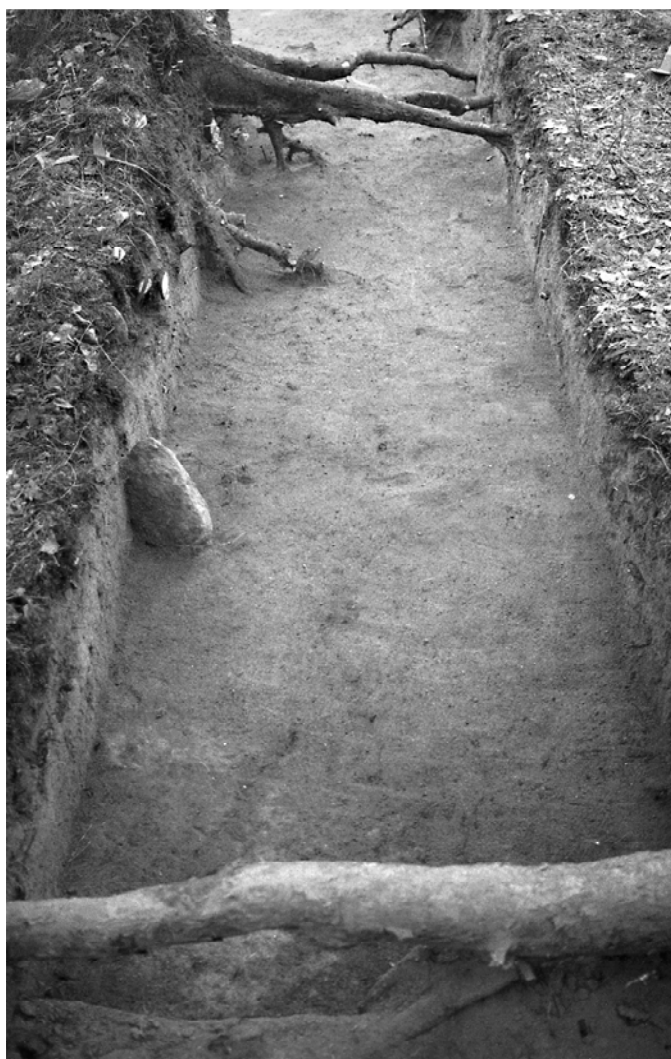
f. 142880 Alue 1 (5000–5006/1000–1001) tasossa 5. Etelälounaasta.