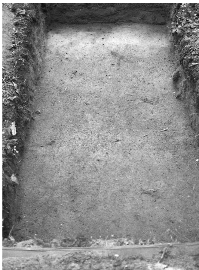
f. 142886 Koekuoppa 1 (4983–4984/999–1001) tasossa 2. Itäkaakosta.