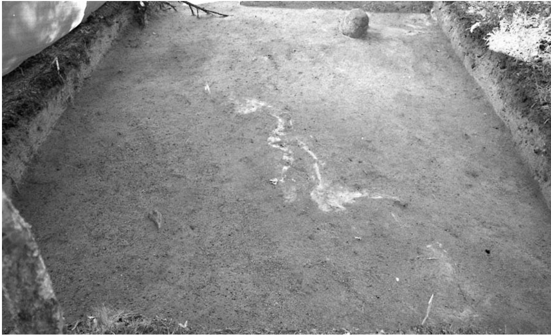
f. 142876 Alue 1 (5006–5010/998–1001) tasossa 4. Pohjoiskoillisesta.