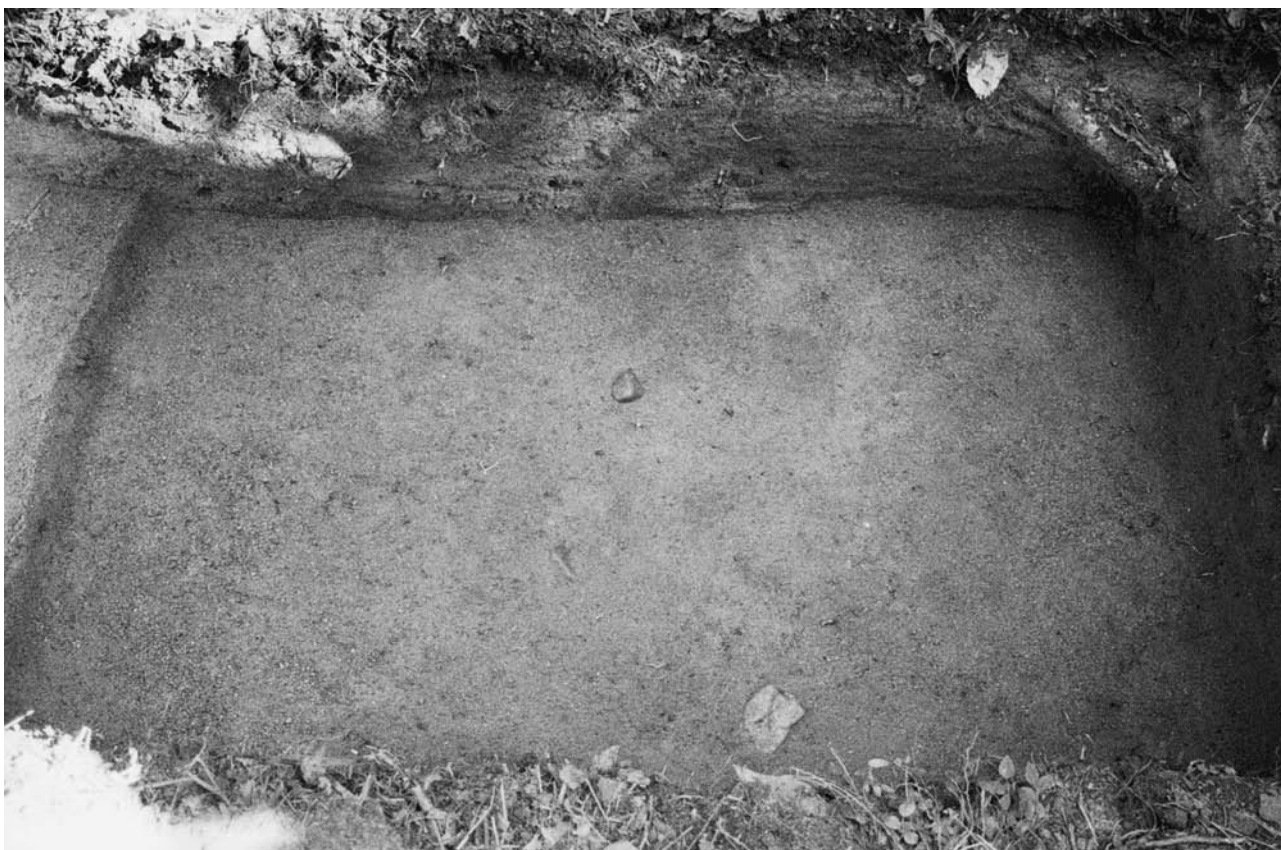
f. 142892 Koekuoppa 1 (4983–4984/999–1001) tasossa 5. Etelälounaasta.