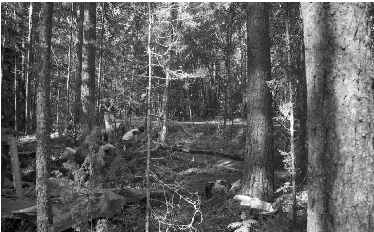
f. 142859 Kaivausalueetta 1 avataan. Koillisesta.