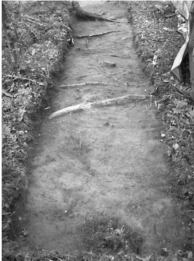
f. 142862 Alue 1 (5000–5006/1000–1001) tasossa 1. Etelälounaasta.