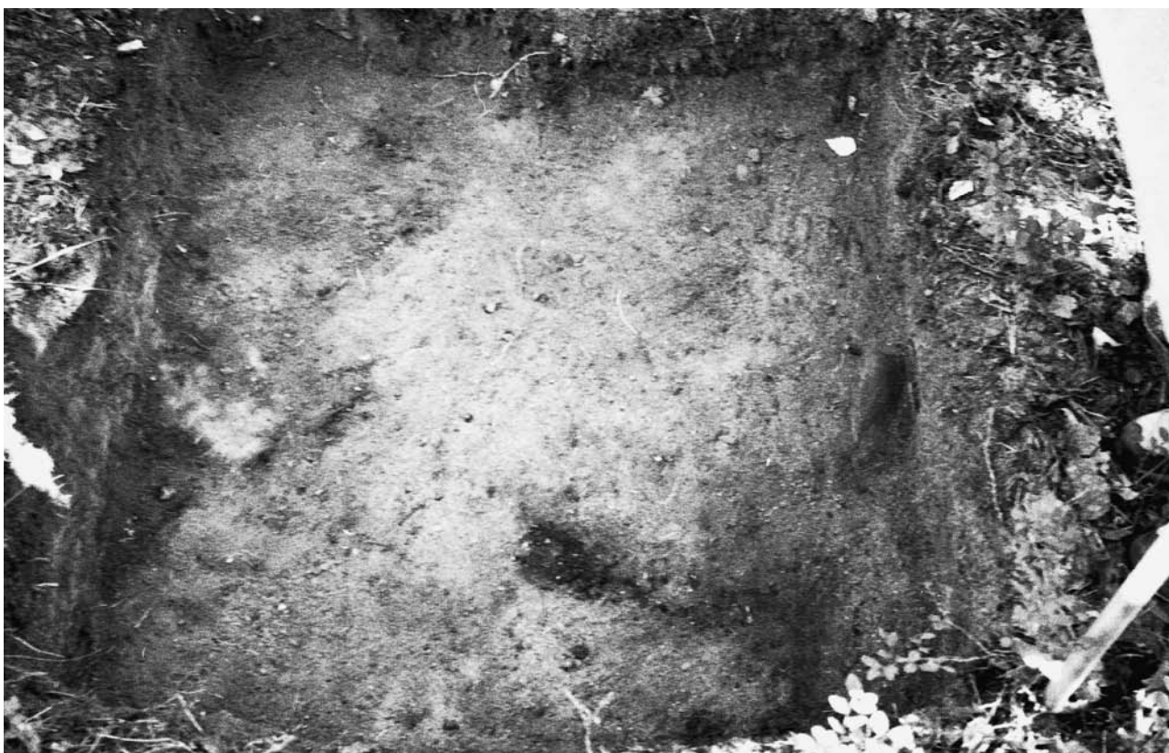
f. 142895 Koekuoppa 4 (5063–5064/1003–1004) tasossa 2. Etelälounaasta.