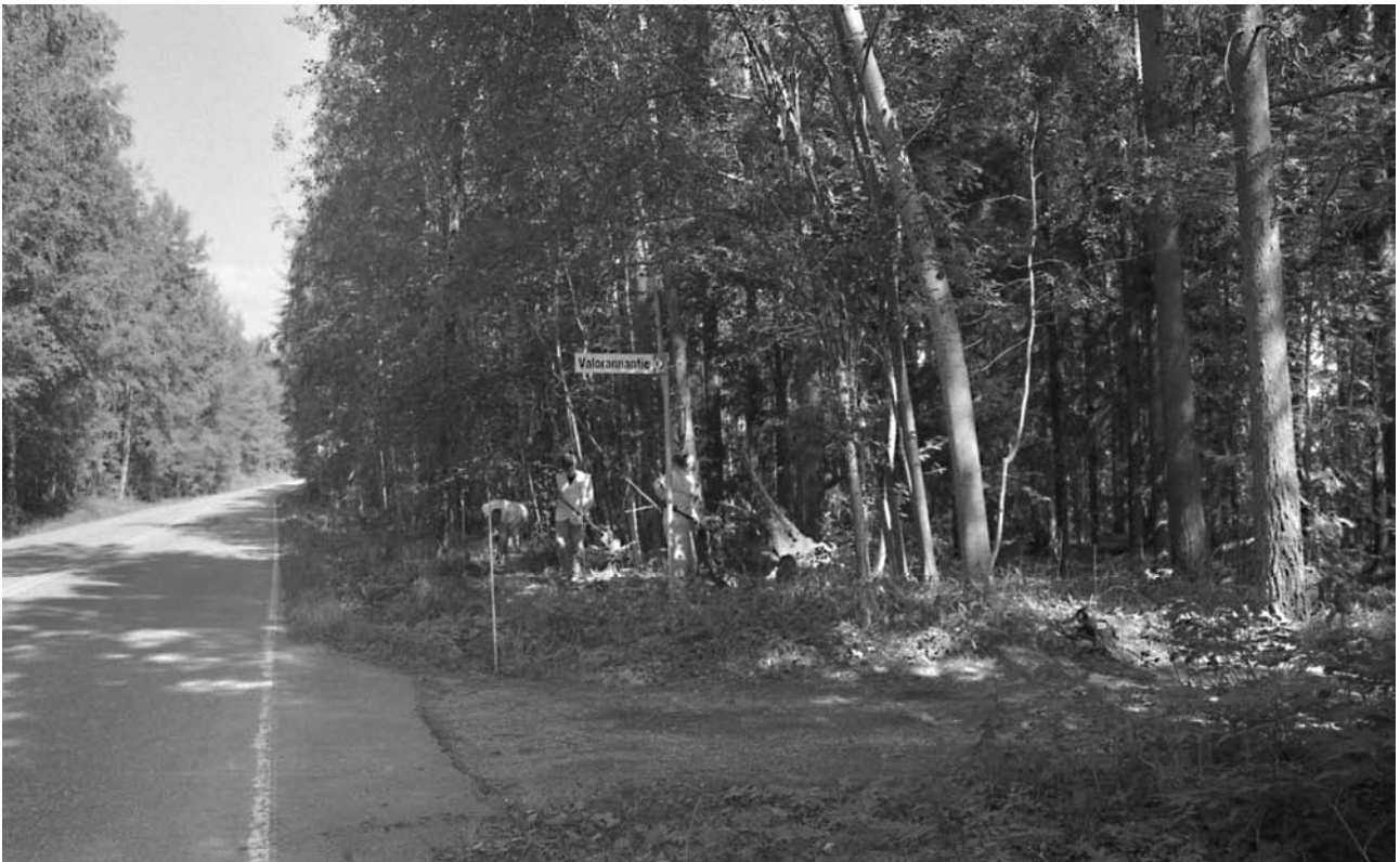
f. 142865 Turpeenpoistoa alueelta 2 (4964–4970/995–996). Lounaasta.