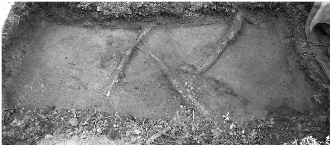
f. 142882 Koekuoppa 1 (4983–4984/999–1001) tasossa 2. Etelälounaasta.