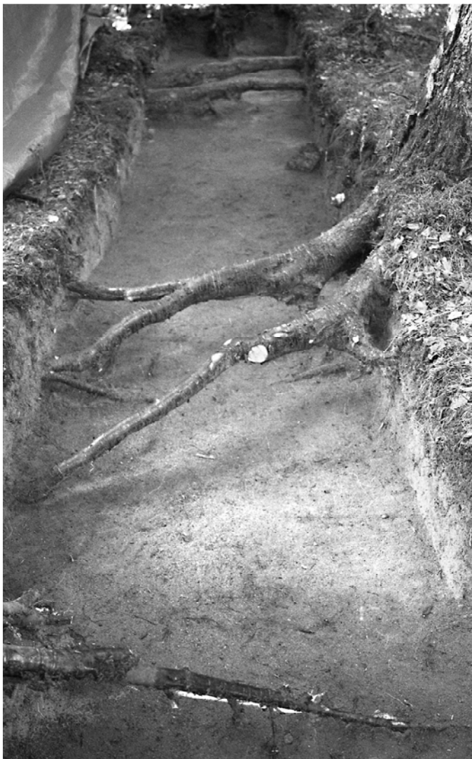
f. 142877 Alue 1 (5000–5006/1000–1001) tasossa 4. Pohjoiskoillisesta.