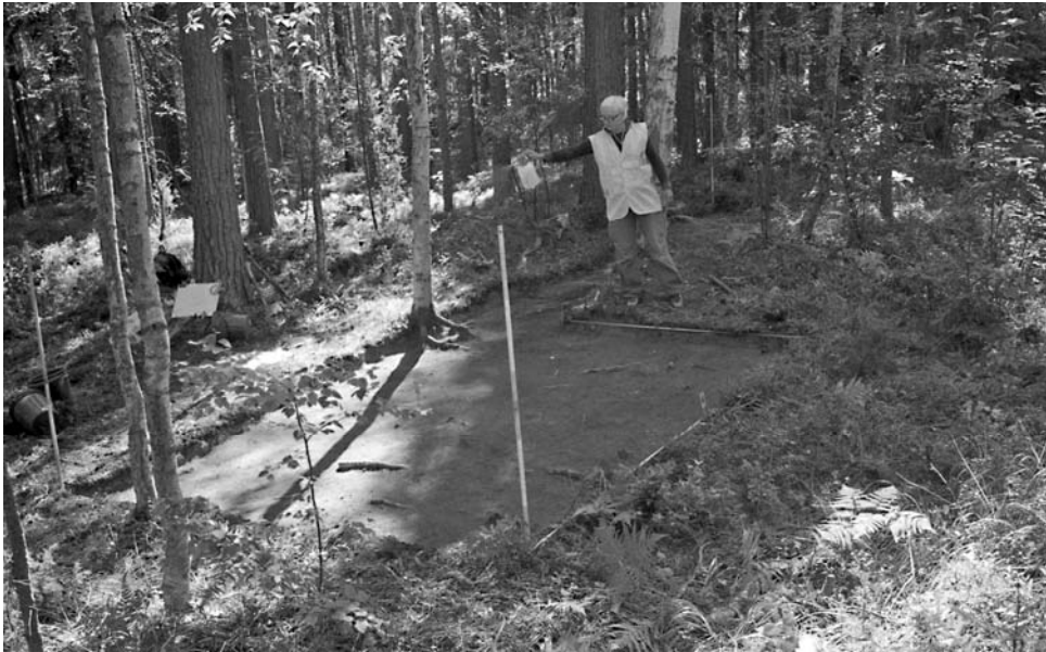
f. 142864 Alue 1 (5006–5010/998–1001) tasossa 1. Hanna Kelola kastelee aluetta piirtämistä varten. Pohjoisesta.