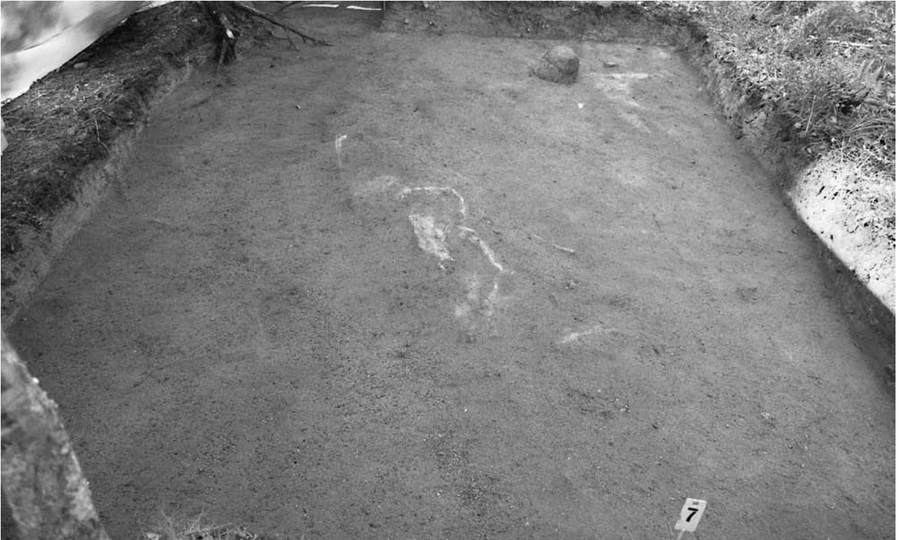
f. 142872 Alue 1 (5006–5010/998–1001) tasossa 3. Pohjoiskoillisesta.