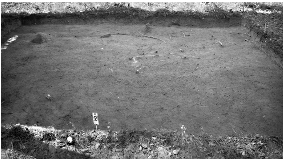
f. 142869 Alue 1 (5006–5010/998–1001) tasossa 2. Pohjoiskoillisesta.