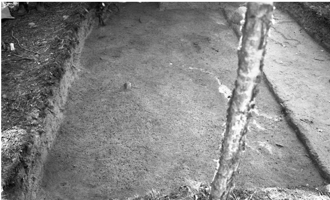
f. 142879 Alue 1 (5006–5010/998–1001) tasossa 5. Pohjoiskoillisesta.