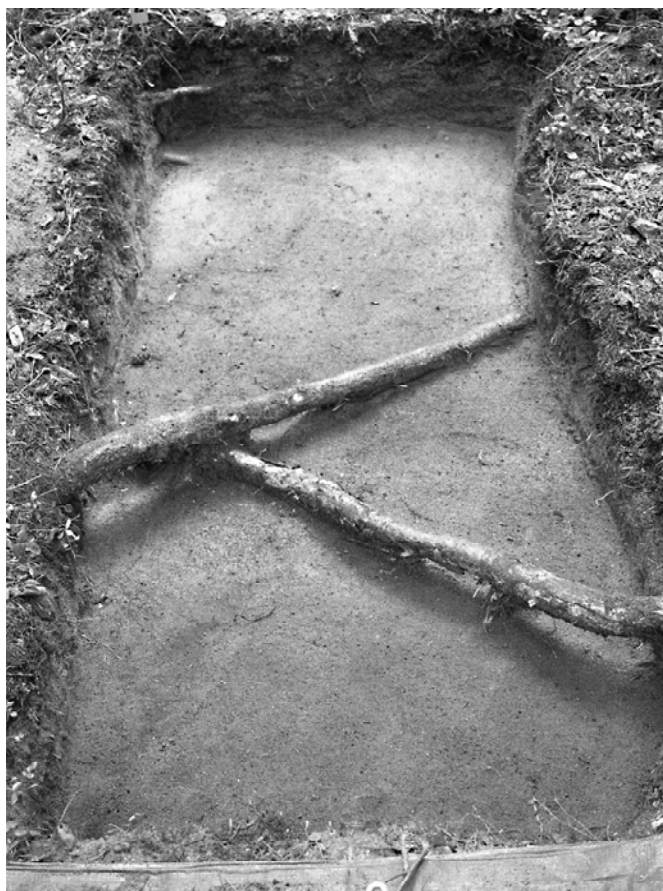
f. 142884 Koekuoppa 1 (4983–4984/999–1001) tasossa 2. Itäkaakosta.