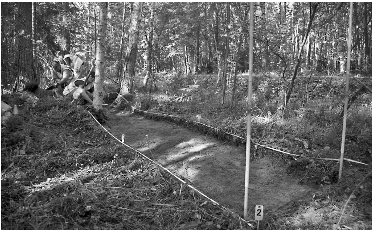
f. 142858 Kaivausalueetta 1 avataan. Pohjoiskoillisesta.