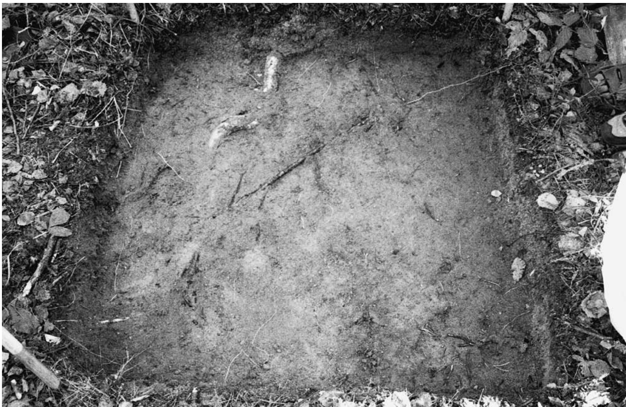
f. 142894 Koekuoppa 3 (5029–5030/1003–1004) tasossa 2. Etelälounaasta.