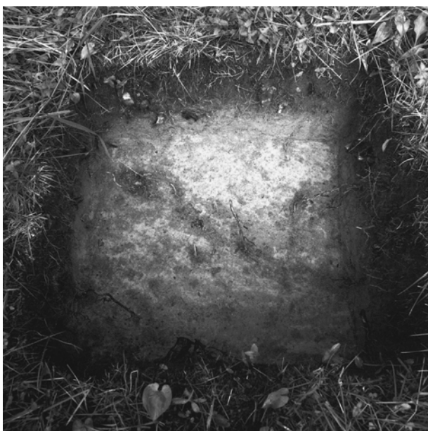
Kuva 3/F. 144538

Koekuoppa 2237/3609, kuvattu eteläkaakosta.