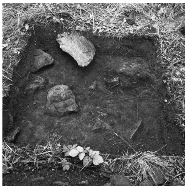
Kuva 4/F. 144539

Koekuoppa 2224/3585, kuvattu itäkaakosta.