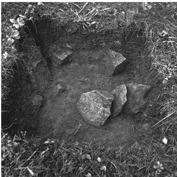
Kuva 1/F. 144537

Koekuoppa 2195/3585, kuvattu pohjoiskoillisesta.