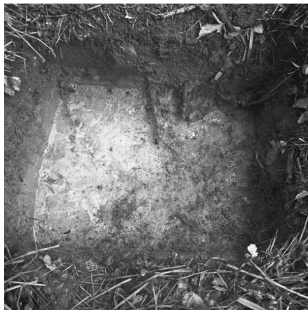
Kuva 2/F. 144538

Koekuoppa 2195/3585, kuvattu pohjoiskoillisesta.