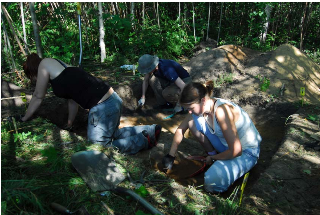
Työkuva. Koekuopan 280/480 laajennusta kaivetaan (DG7:5).