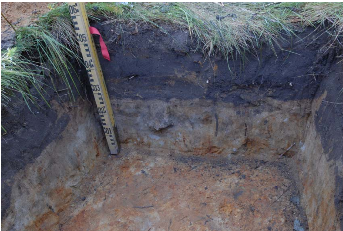
Tyypillinen koekuopan maannos, koekuopan 300/500 profiili kuvattuna lännestä (DG7:3).