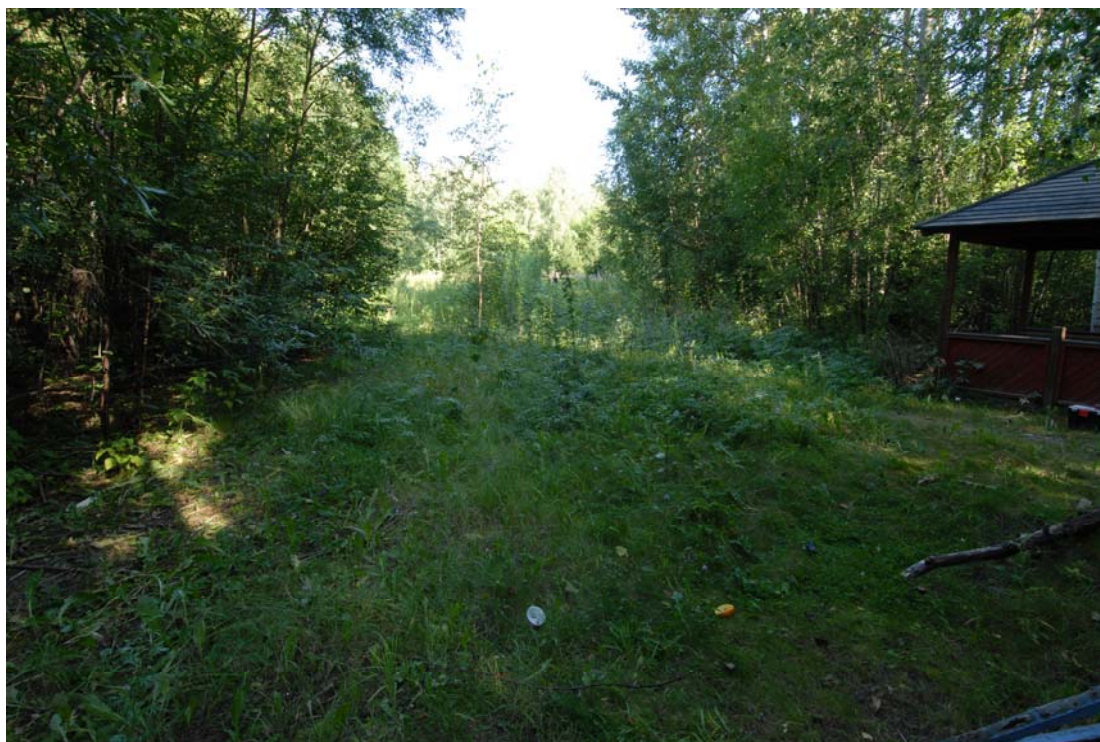
Tutkimusalueetta kuvattuna kaakosta (DG7:1).