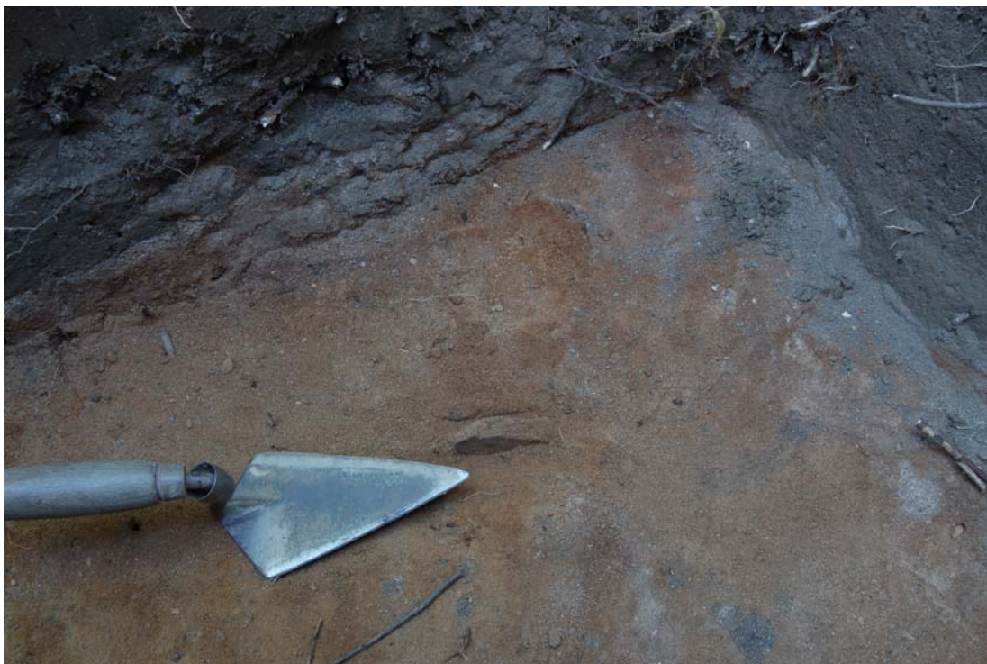
Keramiikkaa "in situ" koekuopassa 280/480 (DG7:4).