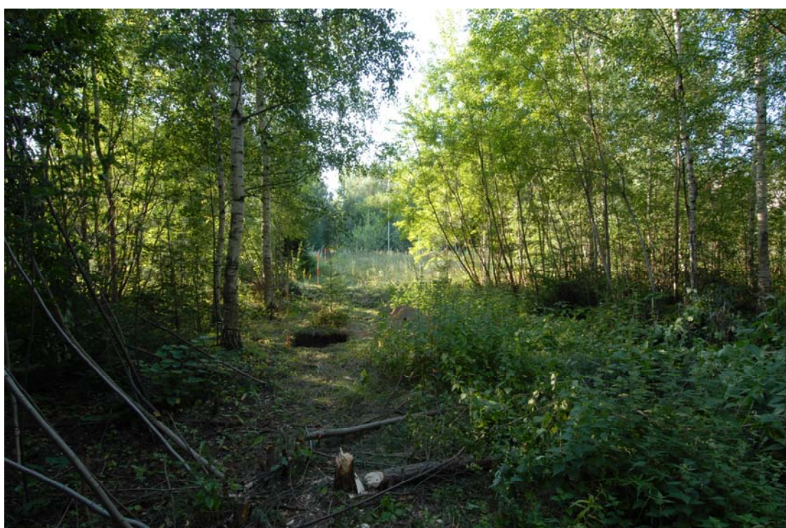
Tutkimusalueetta kuvattuna luoteesta (DG7:2).