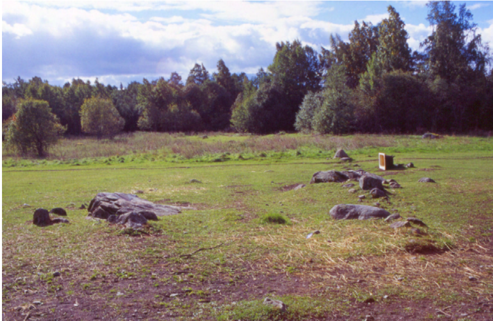
Kuva 5. Tammelan Kankaisten rusthollin paikka.