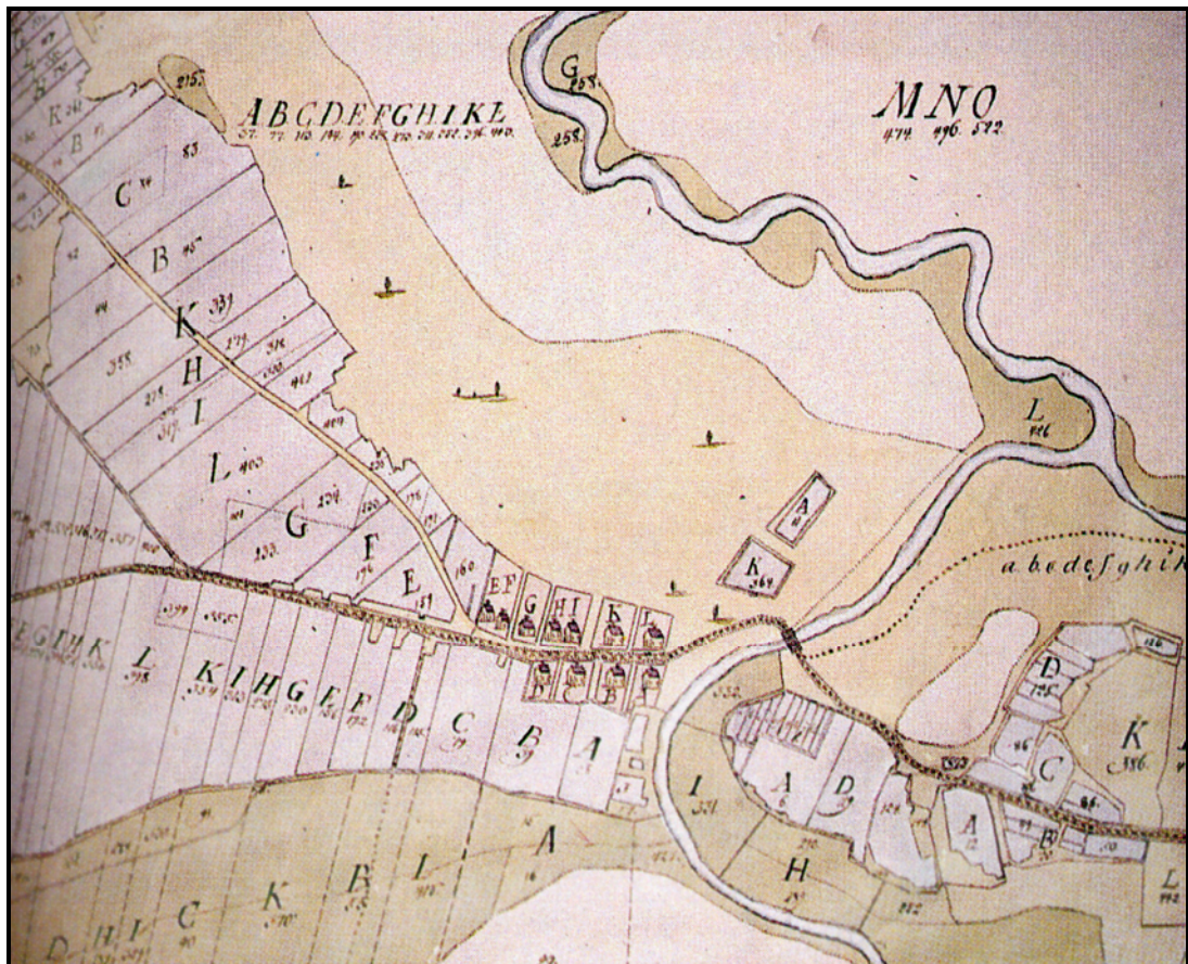
Kuva 2. Tammelan Portaan kyläkeskus v. 1787 isojakokartassa (Alanen 1991:15; orig. MHA, H 80 5/1).