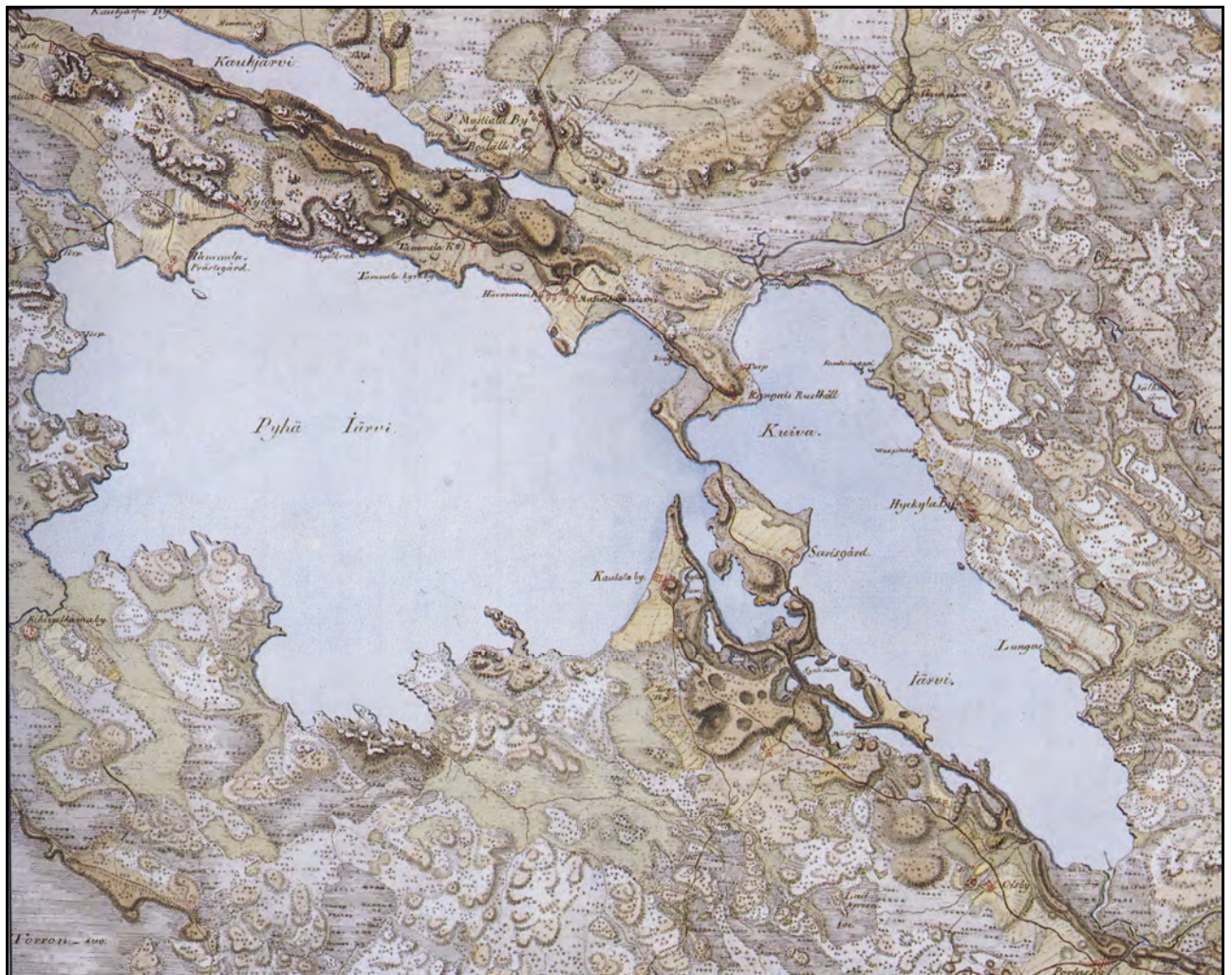
Kuva 3. Tammelan Riihivalkaman, Kaukolan, Ojaisten, Portaan, Hykkilän, Lunkaan, Hevonniemen, Mustialan, Kaukjärven ja Kydön kylät; Tammelan kirkonkylä ja pappila; Saaren kartano, Kankaisten ja Mustialan rusthollit sekä krouvit; tiiliruukki, 4 myllyä ja 18 torppaa merkittyinä Kuninkaan kartastoon (Alanen & Kepsu 1989: 153).