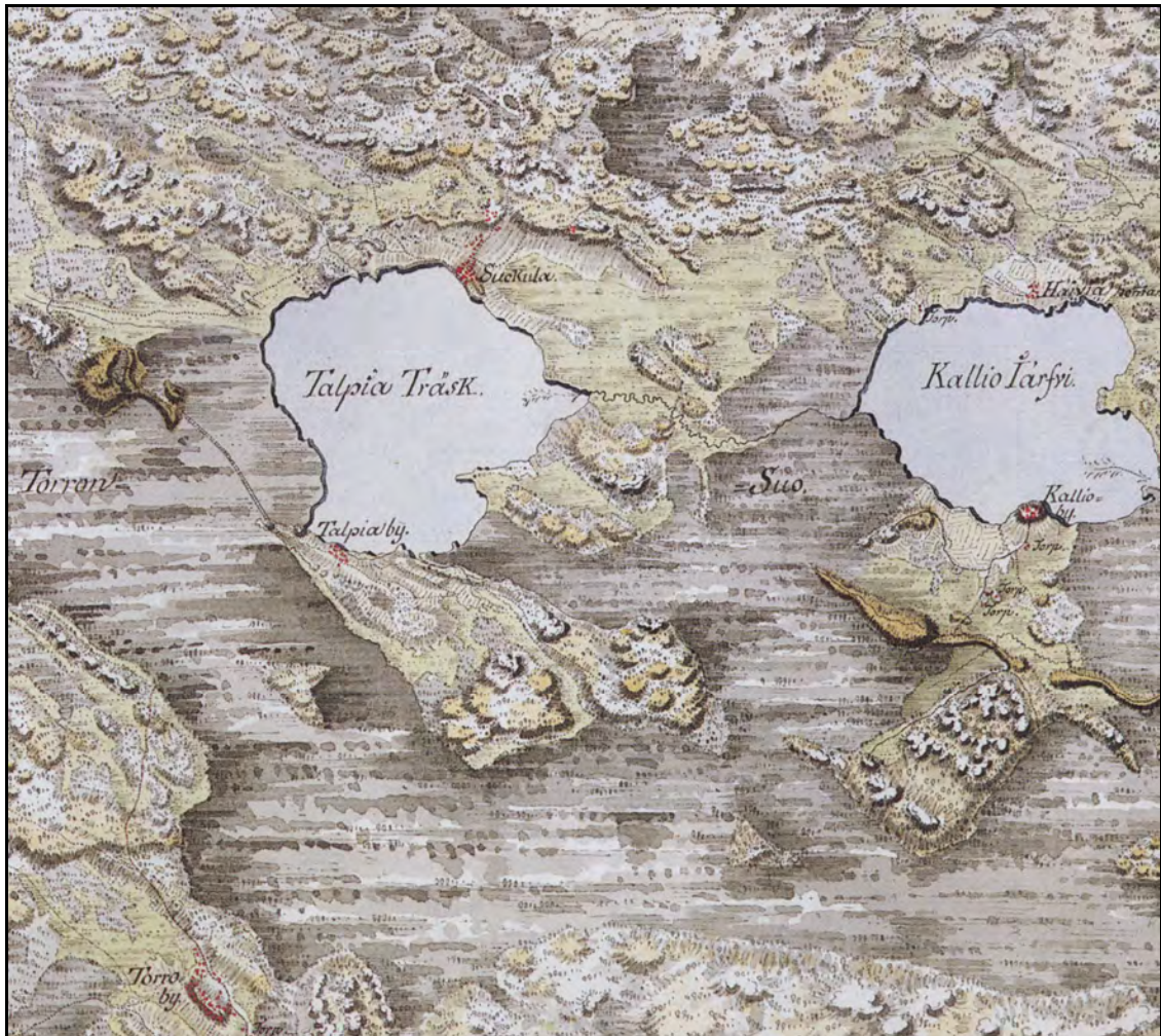
Kuva 4. Tammelan Torron, Talpian Sukulan, Kallion ja Häiviän kylät merkittyinä Kuninkaan kartastoon (Alanen & Kepsu 1989:152).