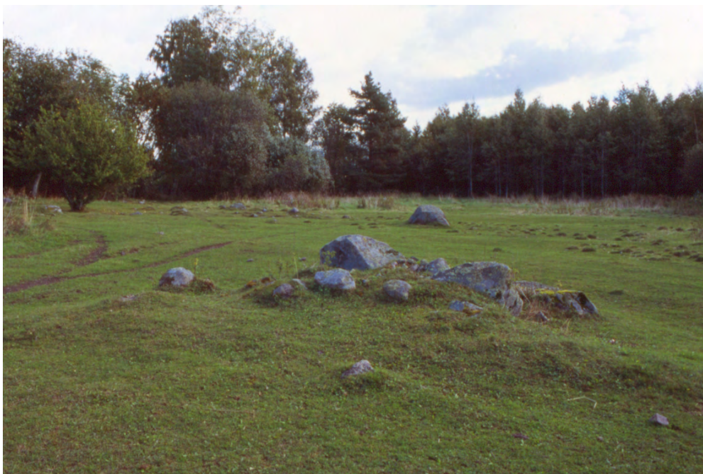
Kuva 6. Tammelan Kankaisten rusthollin paikka.