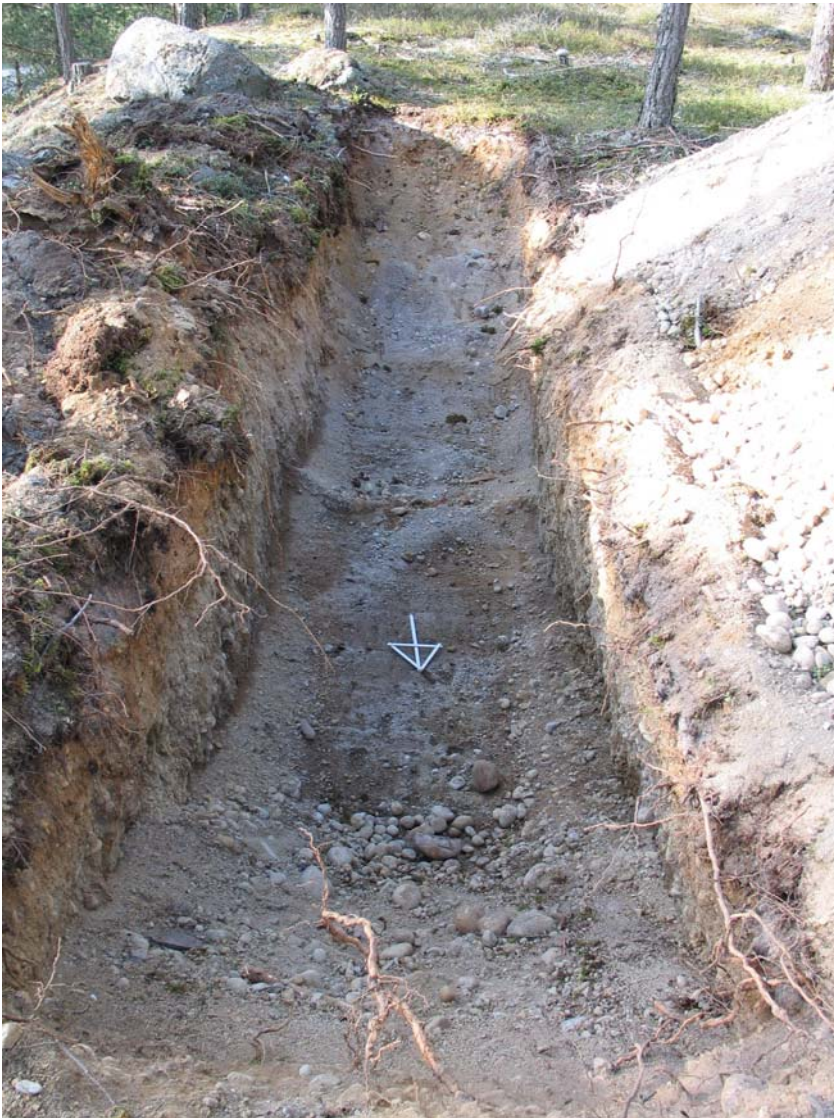
Kuva 3. Koeoja A1, pohjoisesta etelään

Mitään merkkejä haudoista tai muista kiinteistä rakenteista ei tutkimuksessa löydetty. Alueen eteläpäässä maaperä oli hiekkaa ja muulla alueella moreenia. Paikoitellen, kuten esimerkiksi koeojan E ja F kohdalla maaperä oli niin kovaa, että sitä oli vaikeaa tai lähes mahdotonta saada kaivetuksi lapiolla. Sen perusteella voisi pitää todennäköisenä että hautaukset olisi tehty ennemminkin alueen eteläosaan, missä maa on ollut pehmeämpää kaivaa. Koskematon maa tuli vastaan 0,5 - 1,5 metrin syvyydessä.