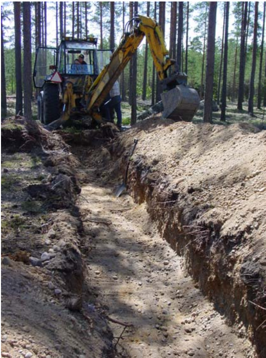
Kuva 2. Työkuva, Kaivinkone kaivaa koejaa D

Koekaivauksessa kaivettiin inventoinnissa löydettyjen painanteiden alueelle koneellisesti viisi noin metrin levyistä koejaa etelä- pohjois-suunnassa. Koeajat kaivettiin noin viiden metrin välein niin, että ne menisivät painanteiden halki ja että mahdollisimman vähän puita osuisi koeajan linjalle. Puiden kaataminen olisi ollut työlästä ja mikäli soranottohankkeesta luovuttaisiin, myös turhaa. Ympäristöön kaivettiin lisäksi lapiolla viisi koekuoppaa sekä puhdistettiin vanhojen soranottokuoppien reunoja, mutta mitään merkkejä haudoista ei löydetty. Koeajat kaivettiin kaivinkoneella ja arkeologi seurasi koko ajan kaivausta ja pysäytti koneen aina, jos jotain epäilyttävää ilmeni. Ojia kaivettiin puhtaaseen pohjamaahan asti. Puhtaan pohjamaan syvyys vaihteli 0,5 ja 1,5 metrin välillä. Koeojien sijainnista piirrettiin kartta mittakaavassa 1:1000. Kartanpiirtämisessä käytettiin apuna GPS-paikannusta, rullamittoja ja bussolia, joten pienet heitot koeojien sijainnissa ovat mahdollisia. Mahdollisuus vaaituskoneen käyttämiseen oli, mutta maastonmuotojen takia siitä ei ollut hyötyä yleiskartan piirtämisessä.