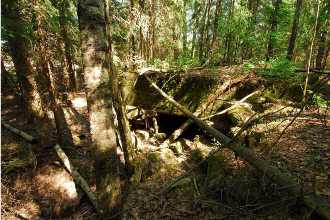
Salpalinja, Tahvola. Betonibunkkerin oviaukko kuvattuna lännestä. (DG366:1)