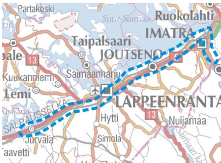
Yleiskartta kaksoisradan suunnitelma-alueesta.

Noin 70 km pitkä, nykyisen radan myötäinen, inventointialue alkaa Jurvalasta, Luumäen liikennepaikan itäpäästä ja ulottuu Imatrankoskelle, lähelle Venäjän rajaa. Rata kulkee Luumäen, Lappeenrannan, Joutsenon ja Imatran alueella. Inventointialueen leveys oli noin 20 – 30 metriä nykyisen radan molemmin puolin. Alue oli riittävän leveä kattamaan kaksoisraiteen, Imatralla myös ns. kolmioraiteen ja huoltoteiden vaatimat alueet. Lisäksi inventoinnissa huomioitiin myös Luumäki-Vainikkala lisäraiteen mahdollinen liittyminen Luumäki-Imatra rataosaan Luumäellä.