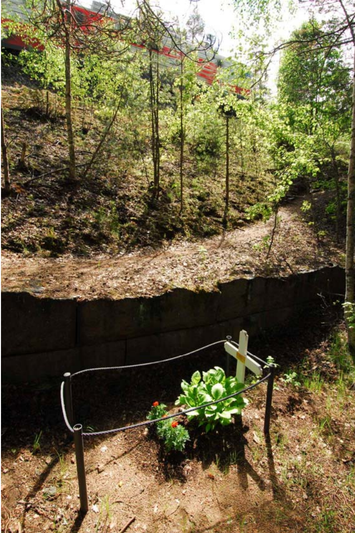
Kansalaissodan aikainen Juosi Muston hauta kuvattuna pohjoisesta. Hauta on aivan ratavallin tuntumassa. (DG370:1)