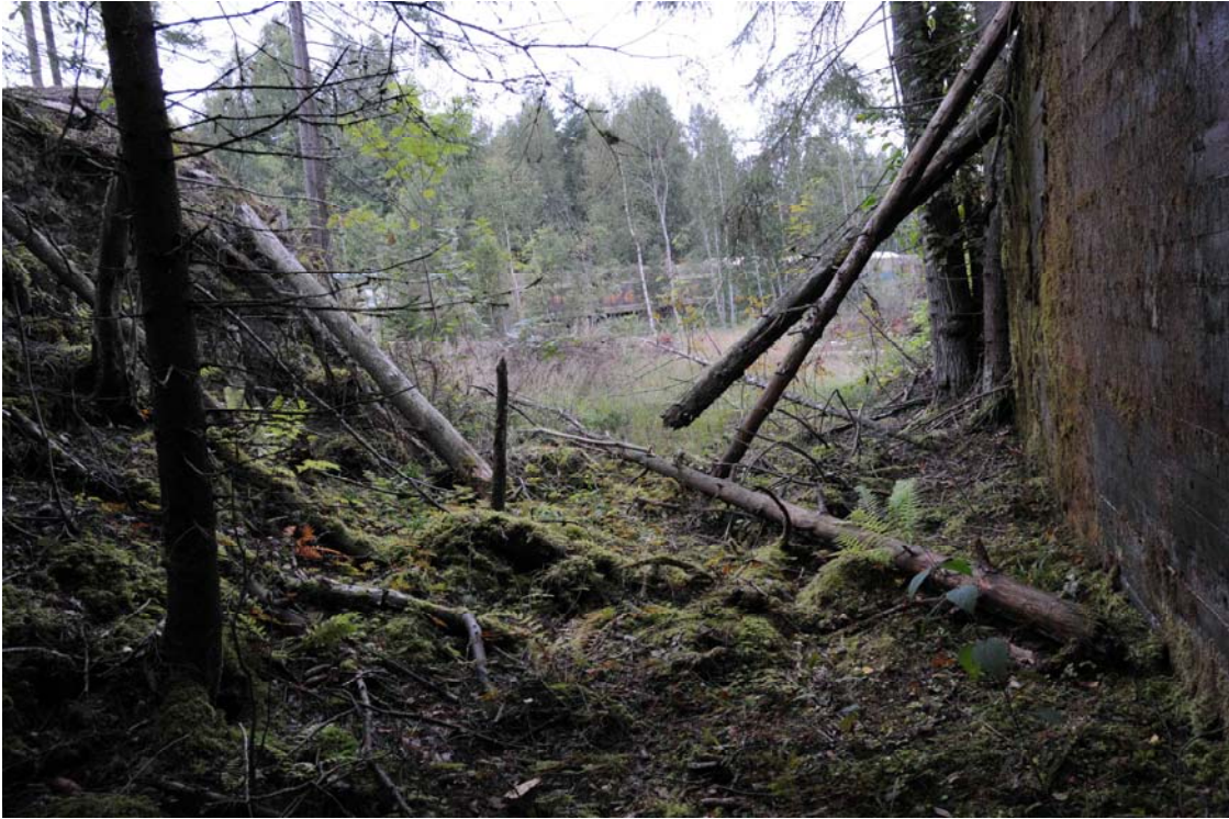
Salpalinja, Jussimäki. Näkymä bunkkerin ampuma-aukolta radan suuntaan. (DG368:2)