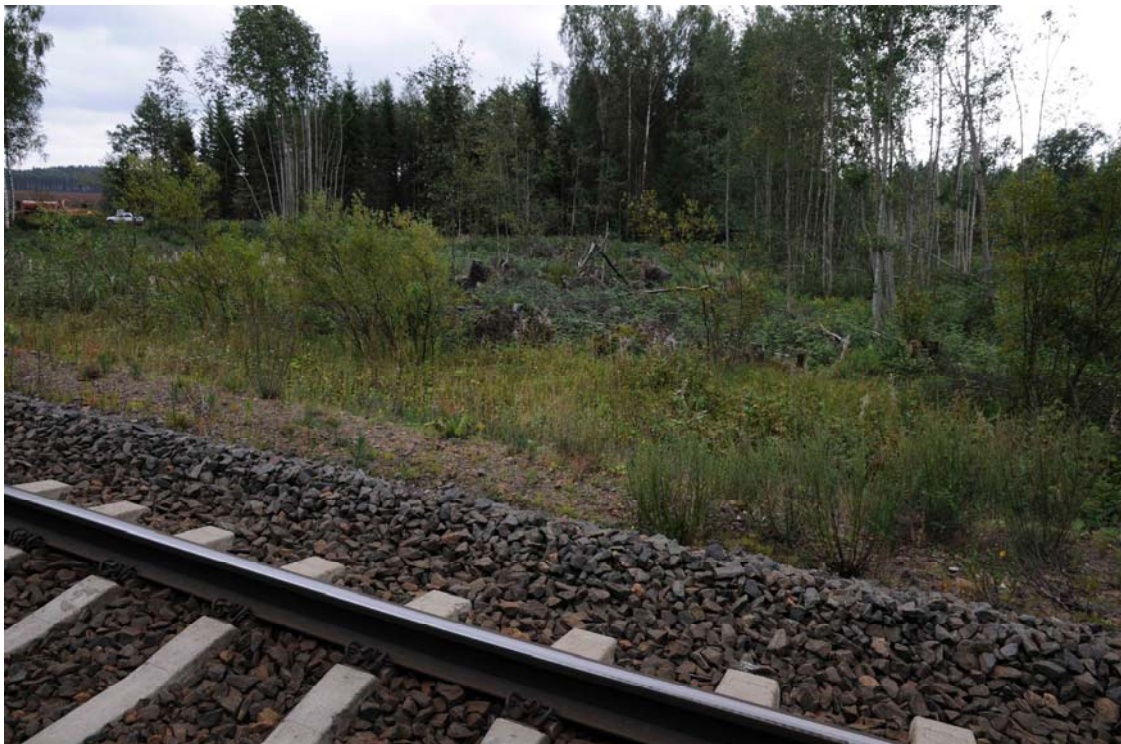
Salpalinja, Jussinmäki. Panssariesteitä radan eteläpuolella. (DG368:1)