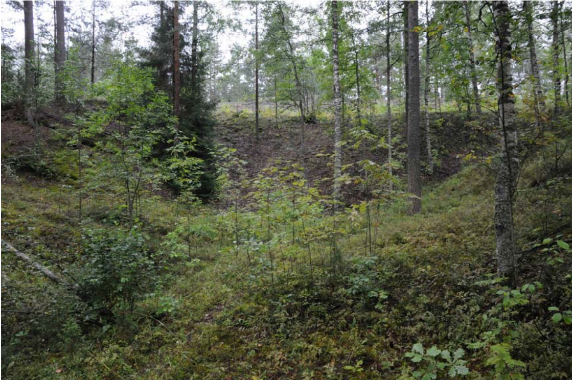
Pontuksen kaivantoa radan kohdalla, kuvattuna etelästä. (DG369:1)