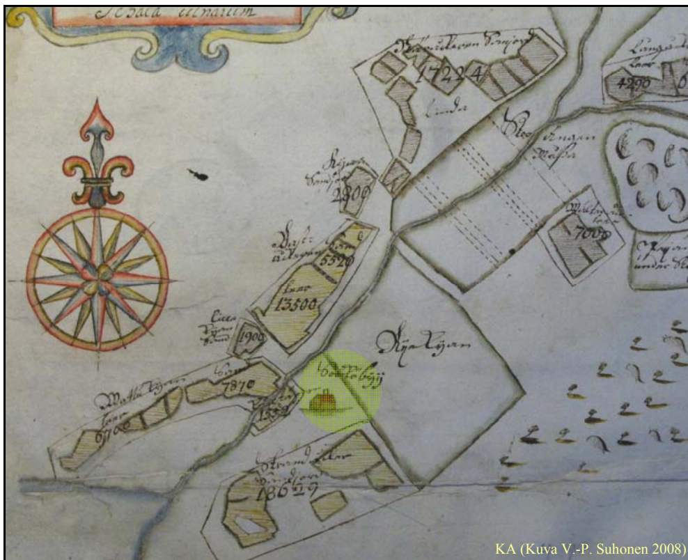
Kuva 2. Söökö by Samuel Broteruksen vuoden 1698 kartalla. Nykyisen Soukanpohjan kartanon alue merkity vihreällä.

Vuonna 1995 Espoon kaupunginmuseo suoritti arkeologisia koekaivauksia Soukan urheilupuiston pohjoisosissa, Sökövikenin koulun ja uimahallin välisellä alueella. Silloin löydettiin mm. palaneen rakennuksen jäännöksiä sekä keskiaikainen balttilainen kolikko. Löytöjen perusteella näyttäisi siltä, että asutusta on keskiajalla ollut myös Soukanojan pohjoispuolella (Lindholm 1999:22-23). Soukanpohjan kartanon tontilla ei ollut ennen suoritettu arkeologisia tutkimuksia.