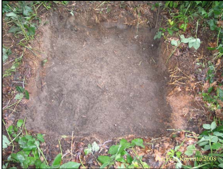
Kuva 8. Koekuoppa 6.

Koekuoppa 6 (Kuva 8) sijaitti tontin kaakkoisreunan keskivaiheilla, leikkimökin takana. Kuopan koko oli 1x1 m. Päälimmäsenä kuopassa oli n. 10-20 cm paksu pintamultakerros. Tämän jälkeen alkoi tiivis ja kova harmaa savi. Pinnasta löytyi yksi lego-palikka, korona-pelin nappi sekä MB lottopelin nappula. Löytöjä ei otettu talteen.