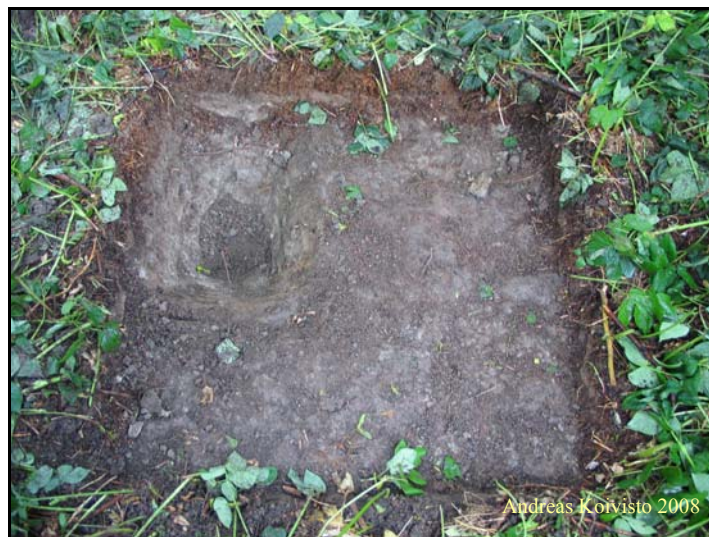
Kuva 7. Koekuoppa 5.

Koekuoppa 5 (Kuva 7) sijaitsi n. 15 m koekuopasta 4 länteen. Kuoppa oli 1x1 m kokoinen. Kova ja tiivis harmaa savi alkoi heti kuopan pinnasta. Kuopan syvin kohta kaivettiin 30 cm syvyyteen, eikä maalaji muuttunut tällä matkalla ollenkaan. Kuopasta ei tullut löytöjä.