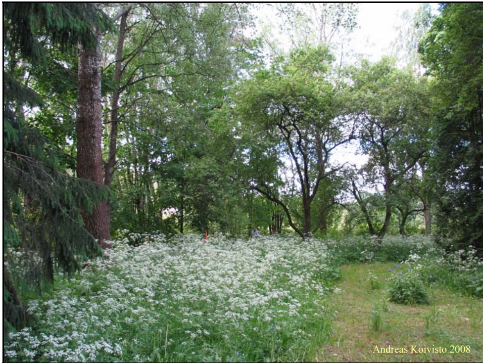
Kuva 1. Soukanpohjan kartanon pihapiiriä.

Päärakennuksen lähiympäristössä erottui myös muutamia mahdollisia vanhojen rakennuksien perustuksia. Nämä eivät kuitenkaan osuneet tutkimusalueelle, joten ne eivät tällä kertaa olleet koekaivausten kohteena.