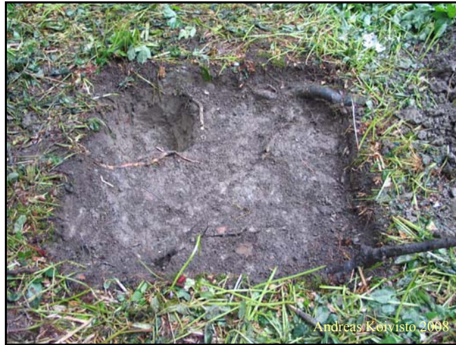
Kuva 6. Koekuoppa 4.

Koekuoppa 4 (Kuva 6) sijaitsi n. 5 m koekuopasta 3 etelään. Kuopan koko oli 1x1 m. Heti kuopan pinnasta alkoi kova ja tiivis harmaa savi. Aivan pinnasta löytyi muutamia paloja modernia tiiltä, fajanssia ja muovia. Muuten kuoppa oli löydötön. Kuopan syvin kohta kaivettiin 30 cm syvyyteen. Tällä matkalta maalaji pysyi samana.