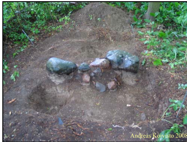
Kuva 4. Koekuoppa 2

Koekuoppa 2 (Kuva 4) avattiin tontin kaakkoisnurkassa sijaitsevan kiveyksen ympärille. Kuopan koko oli 2x2 m. Koekuoppaa kaivaessa osoittautui, että kivet olivat suoraan maan pinnalla eikä niihin näyttänyt liittyvän mitään rakenteita. Todennäköisesti kyseessä oli pellosto pois kerättyjä kiviä, eli nk. peltoraunio. Kuopan pinnassa oli n. 40 cm pintamultaa, jonka jälkeen alkoi savi. Kuopasta ei tullut löytöjä.