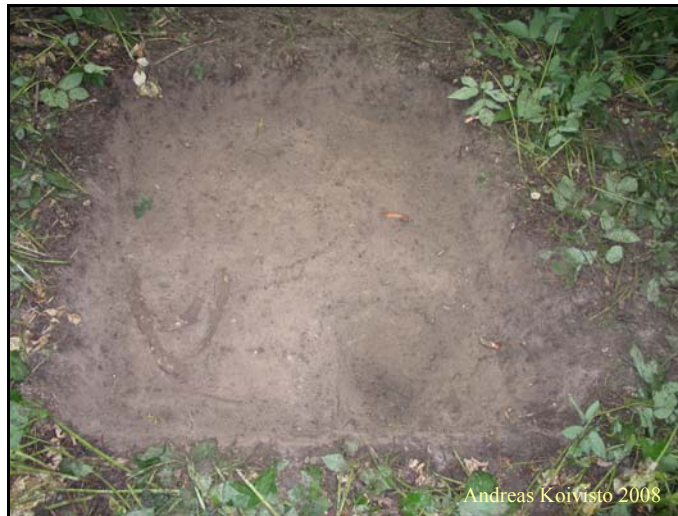
Kuva 9. Koekuoppa 7.

Koekuoppa 7 (Kuva 9) sijaitti leikkimökin takana, n. 10 m koekuopasta 6 lounaaseen. Kuopan koko oli 1x1 m. Pintamultakerros oli n. 10 cm paksu. Pintamullan jälkeen alkoi tiivis ja kova harmaa savi. Kuopasta ei tullut löytöjä.