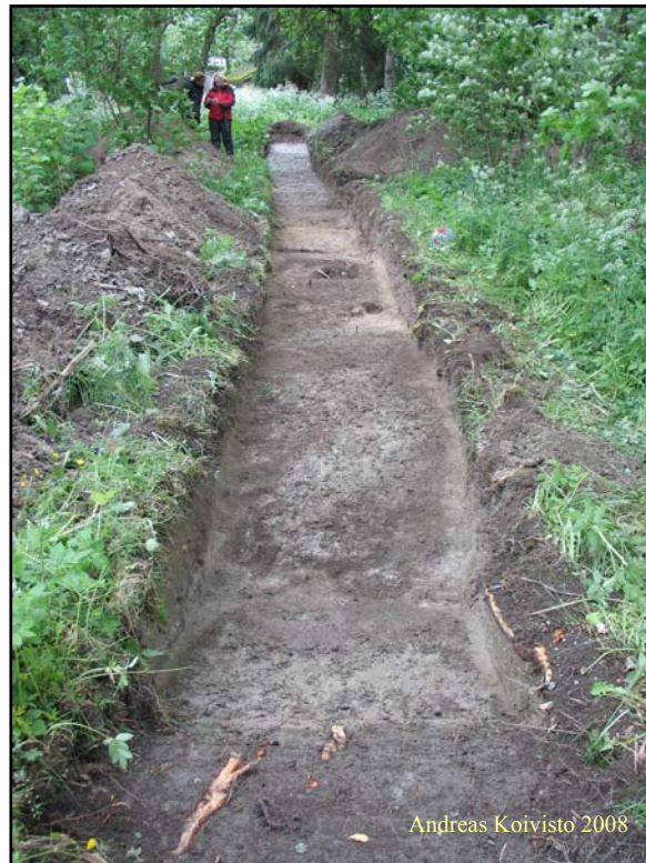
Kuva 3. Koeoja 1, ojan keskivaiheilla näkyy eläinten hautauksia.

Tontin eteläpäätyyn avattiin kaivinkoneella n. 30 m pitkä koeoja (Kuva 3). Koeoja oli lounais-kaakkosuuntainen. Ojan keskivaiheilta avattiin n. 7 m pitkä poikittaisoja kaakkoon. Pintamullan paksuus koeojassa vaihteli 10-30 cm välissä. Tämän jälkeen alkoi savi. Häiriönä savessa oli kaksi eläintenhautaa, joista talon emäntä Merva Mikkola osasi kertoa, että ne ovat tehty hänen aikanaan. Ojan keskivaiheilla, poikittaisojan kohdalla, maa oli hiekkaisempaa n. 2 m matkalta. Mitään löytöjä tai rakenteita ei hiekassa havaittu. Poikittaisojan luoteispäässä sijaitsi roskakuoppa, josta löytyi mm. muovia ja maalattu lankunosa. Poikittaisojan kaakkoispäästä puolestaan löytyi jonkinlainen vanha ojakaivanto. Oja erottui tummana juovana koeojan poikki. Oja kaivettiin koneellisesti pohjaan, eikä sen yhteydestä havaittu löytöjä. Samantapainen oja löytyi myös pitkittäisojan koillispuolelta. Tätä ojaa ei kaivettu pohjaan saakka. Myöskään eläintenhautoja ei kaivattu pois. Ojasta ei otettu talteen löytöjä.