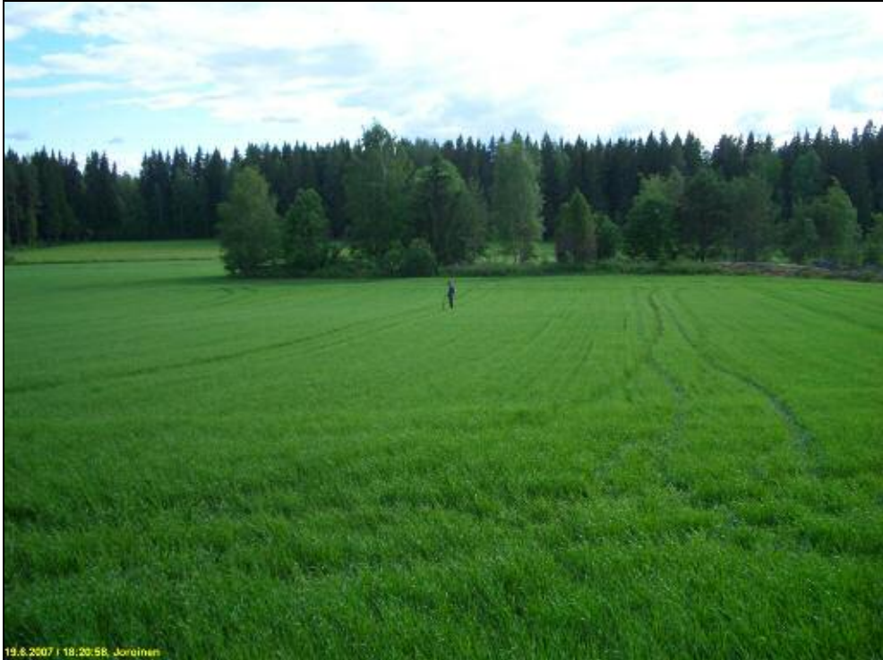
Kourutalalta on löytynyt pellon takana olevan kalliosaarekkeen kupeesta, pellossa kvartseja. Kuvattu lounaaseen.