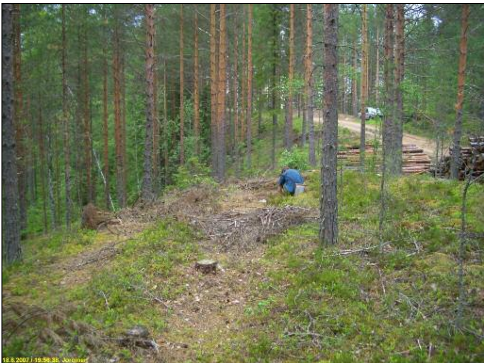
Asuinpaikan pohjoisosaa harjanteen laella, kuvattu pohjoiseen.