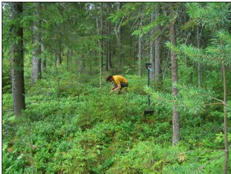
Asuinpaikan maastoa kuvattuna pohjoiseen. Timo Sepänmaa tutkii koekuoppaa.