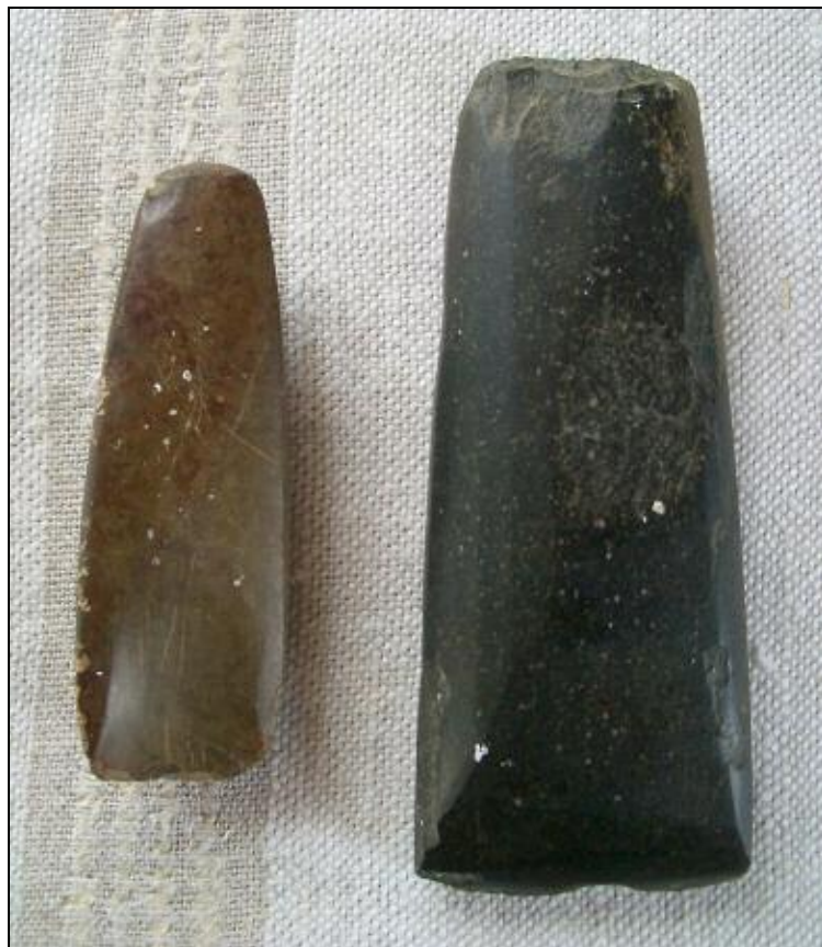
Kourutalalta ja tasatalta (löytöpaikka 41) Hynnilästä.