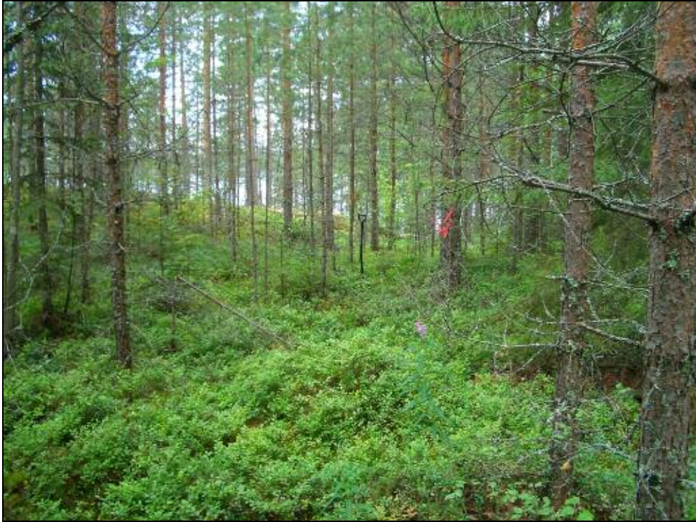
Asuinpaikka kallion takan olevalla tasanteella kuvan alalla, taustalla vas. kalliopaljastuma. Kuvattu luoteeseen.