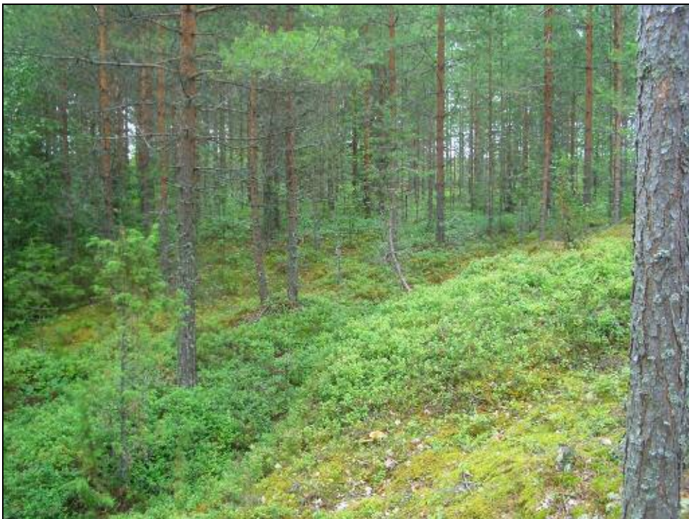
Asuinpaikka kuvattuna rantakalliolta kaakkoon, kuvan keskellä matala muinaisrantatörmä ja sen päällä tasanteella asuinpaikka.