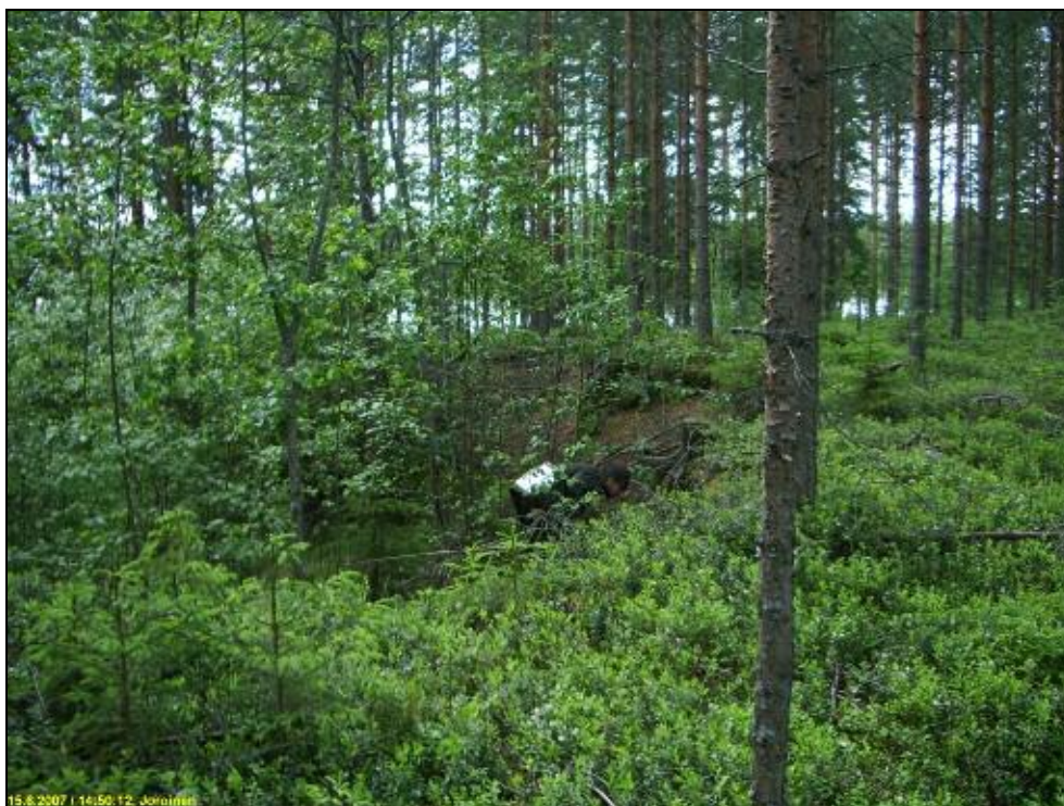
Hiekkakuopan luoteispäätä, jossa leikkauksessa runsaasti palanutta luuta. Kuvattu länteen.