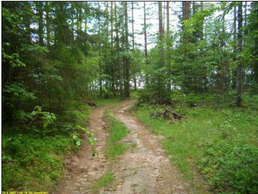
Kvartseja kuvassa olevalta mökkitieltä. Kuvattu etelään.