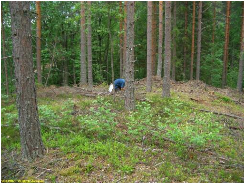
Asuinpaikan eteläpää harjanteen laella, takana jokisuu ja Pieksämäki.