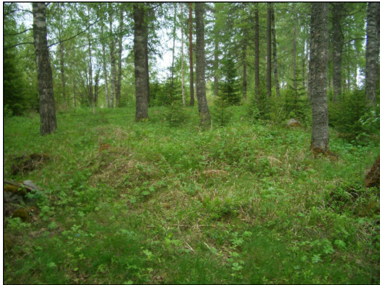
Pienen rakennuksen perusta, mahd. sauna. Kuvattu etelään