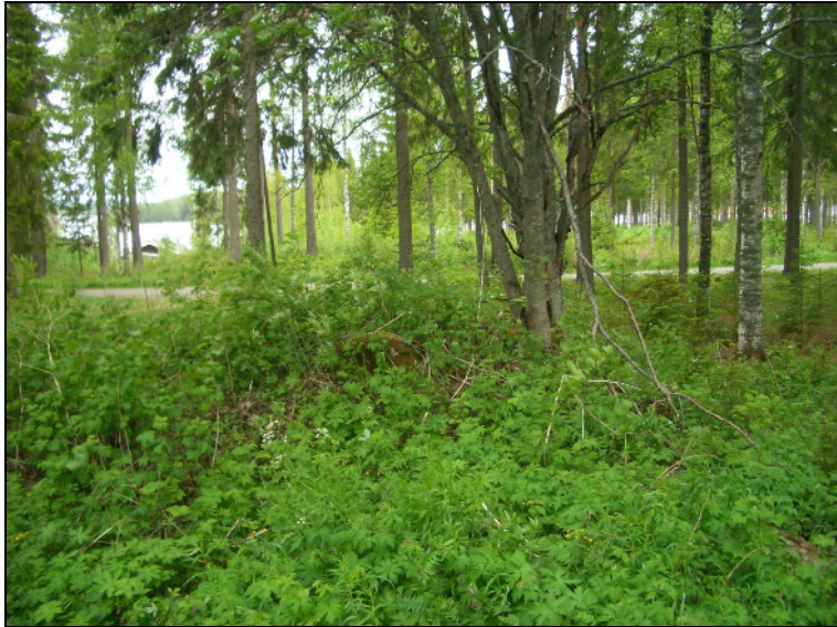
Kiukaan raunio puun vas. kupeessa, kuvattu länteen. Alla sama kuvattuna pohjoisesta