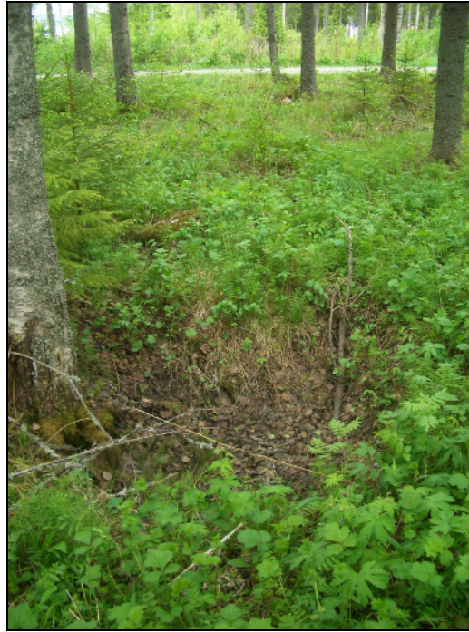
Kuoppa, ilmeisesti kaivon jäännös. Kuvattu itään.