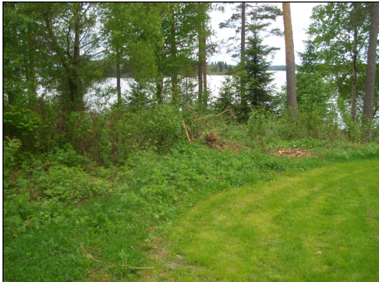
Röykkiön paikka taustalla keskellä, koivun takana.