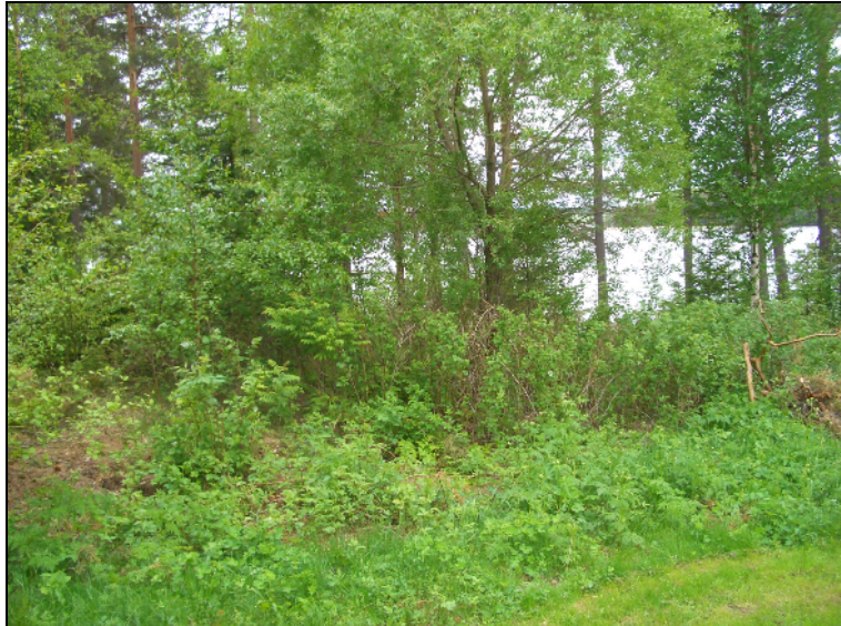
Arvioitu röykkiön paikka kuvattuna lounaaseen, alla länteen.