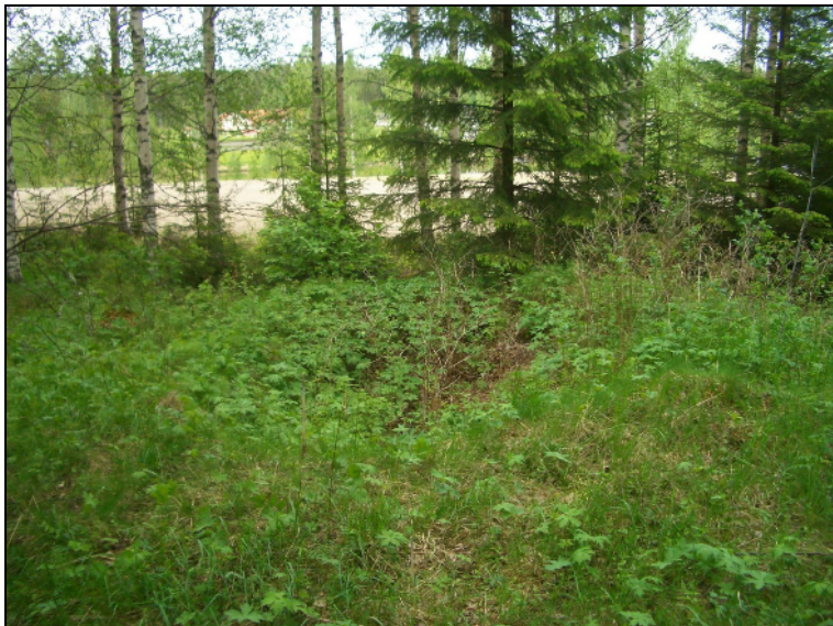
Kellarikuoppa. Kuvattu koilliseen.