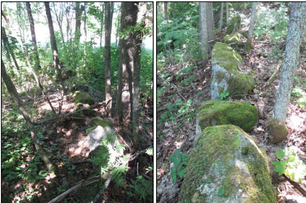
Kuvat 6 - 7 Kivisten puutarhapengerrysten jäänteitä. Kuva: U. Köngäs 2009

Kiveys kiertää noin 10x25 m kokoista aluetta. Kiveystä erottuu maastossa pätkittäin, ja paikoittain kiveys yhtyy kallioon. Kiveyksessä on näkyvissä 1-2 kivikertaa. Kivien koot vaihtelevat noin 0,5x1 m kokoisista hyvin suuriin 0,8x1,5 m kokoisiiin kiviin. Kiveyksen korkeus on noin 0,5-1,2 m. Kivet ovat osittain sammalen peitossa. Kasvillisuus alueella on pensasmaista. Paikalla kasvaa runsaasti marjapensaita, saniaisia ja lehtipuita. Kohteen länsipuolella kulkee hiekkatie, jonka varrella tien länsipuolella on omakotitaloasutusta.