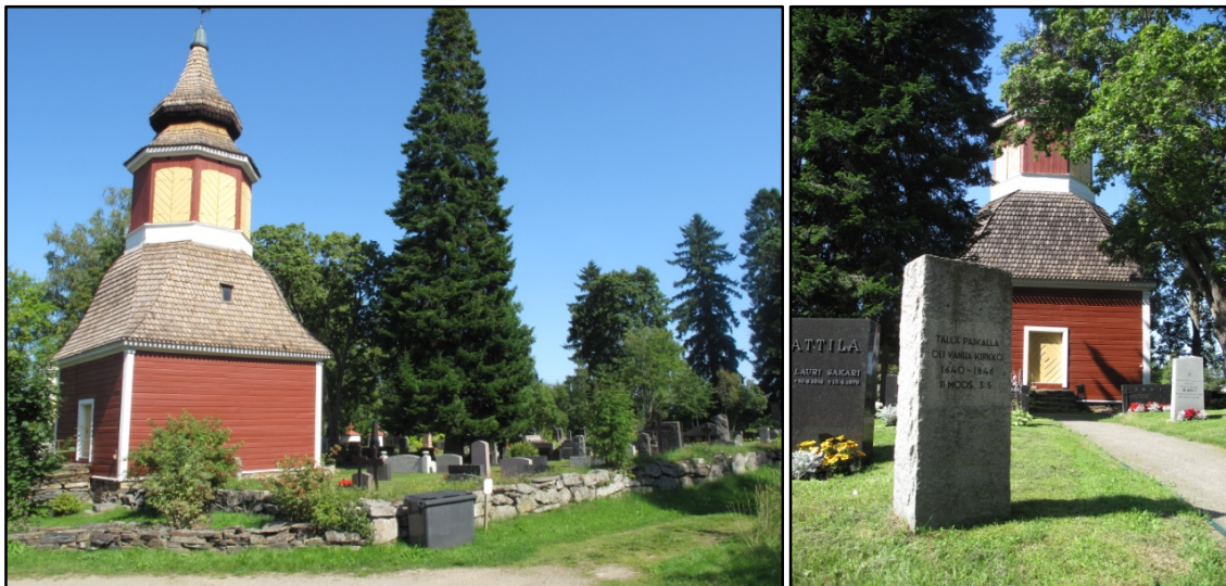
Kuvat 4 - 5 Vanha kirkonpaikka on sijainnut kellotapulin vieressä nykyisellä hautausmaalla. Paikka on merkitty muistokivellä.