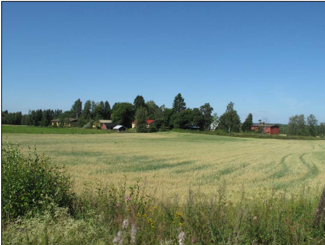
Kuva 1 Iso-Pennon kylätontti erottuu peltojen keskellä matalana kumpareena.