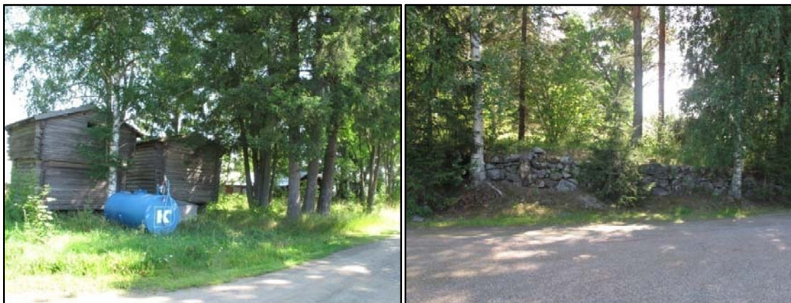
Kuva 2 (vasemmalla) Iso-Pennon läpi kulkevan tien varrella on havaittavissa vielä piirteitä raittikylästä.