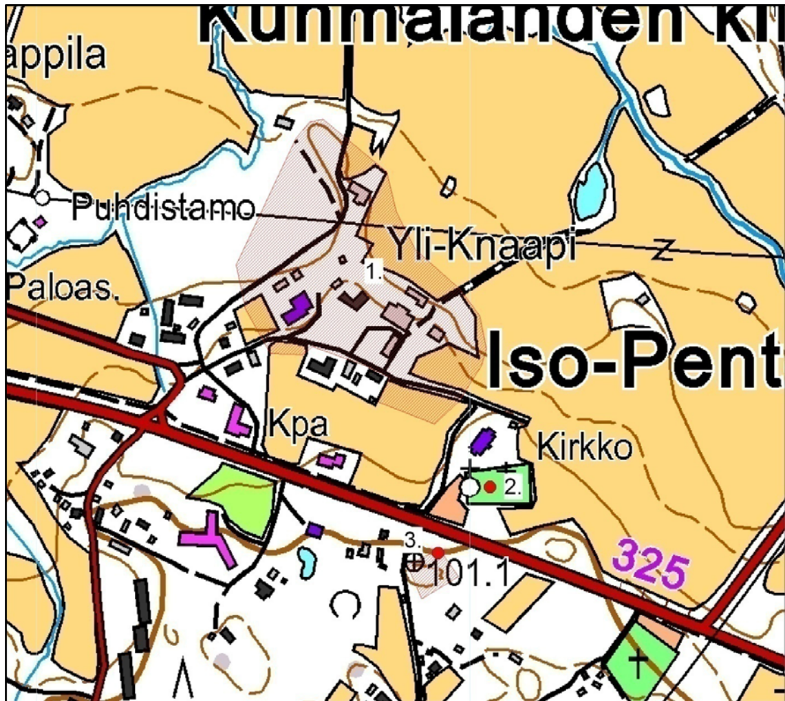
Kartta 4 Kartta inventoinnissa tarkastettujen kohteiden sijainnista ja niiden aluerajauksista. Kohteiden numerot viittaavat yllä olevaan taulukkoon. Kartan mittakaava 1:5000.