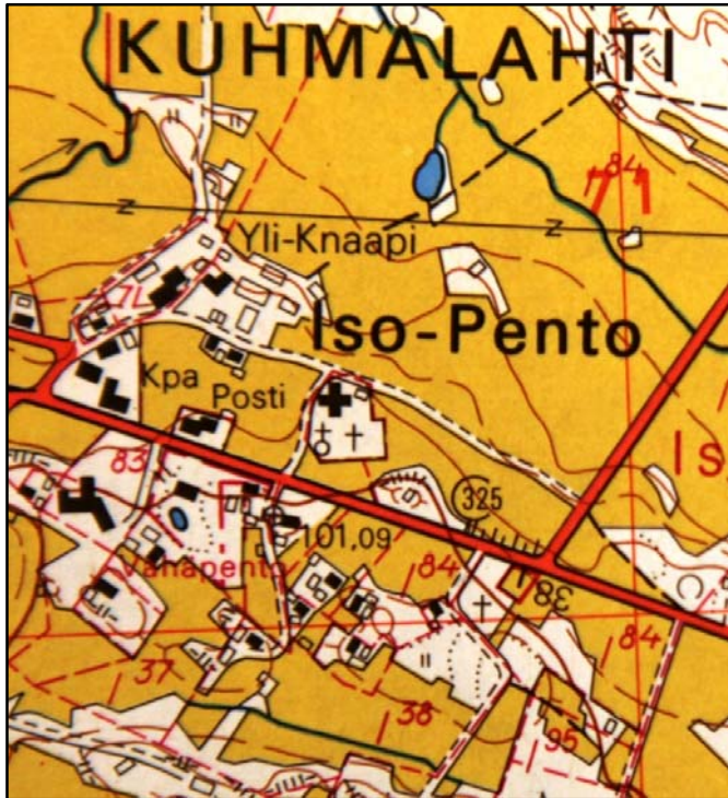
Kartta 6 Peruskarttaotteesta vuodelta 1977 näkyy kivipengerryksen paikalla asuinrakennus. Karttalähde MMH Peruskartta no. 214112.