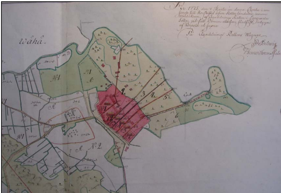
Kartta 3 Isojakokartta Iso-Pennon kylästä 1770-luvulta. Karttalähde KA MMH H36 2/1-22.

Vanhin kylää esittävä kartta on maakirjakartta vuodelta 1635. Kartassa näkyy, että Iso-Pennossa on tuolloin ollut kuusi taloa. Taloja on ajan myötä halottu ja yhdistetty useaan kertaan 6 . Isojako toimeenpantiin Iso-Pennossa 1760-luvulla. Isojaon myötä kylä kasvoi rivikyläksi, jossa tontit sijaitsivat vieretysten yhtenä pitkänä jonona. 7 Koska isojako aloitettiin Iso-Pennossa aikaisin, tuli 1800-luvulla uusjako alueella tarpeelliseksi 8 . Isojaon järjestely- ja täydennystoimituksen yhteydessä vuosina 1902–1908 kirkonkylän vanha keskiaikaista perua oleva ahdas kylärykelmä rakennuksineen hajotettiin. Yli-Knaapin tonttimaan itäpuolella sijainneet vanhat tonttimaat Seppälä, Ala-Kukko, Ylä-Kukko, Ala-Kanila, Peltola ja vanhat riihiladot joutuivat muuttamaan pois kyläkeskuksesta. Ylä-Knaapi ja Ala-Knaapi saivat jäädä kyläkeskukseen. 9