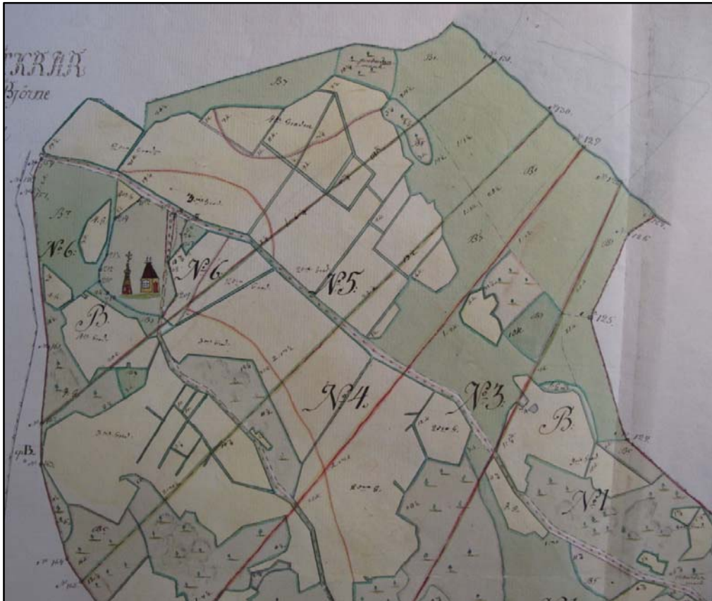
Kartta 5 Iso-Pennon kylään rakennettu kirkko ja kellotapuli näkyvät isojakokartassa, joka on laadittu vuonna 1763 ja jota on korjattu vuonna 1781.