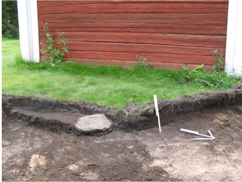
Kuva 3: digitaalikuva 126349:3. R1 Aappolan tallin koillispäädyssä, linjojen 1,2 ja 3 risteyksessä. Kuvattu lounaaseen.