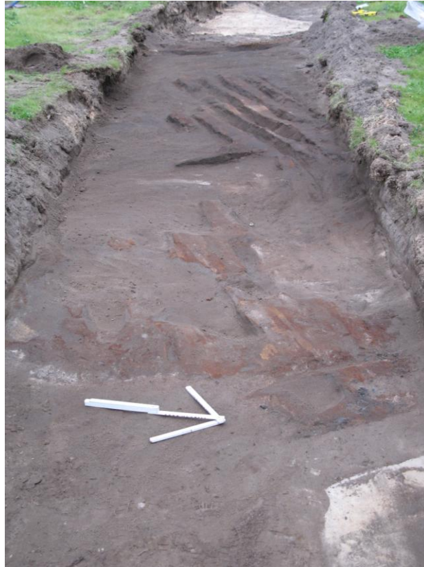
Kuva 4: digitaalikuva 126349:8. R2 linjalla 2, pohjois-etelä-suuntainen rakennuksen pohja. Kuvattu lounaaseen

rengaskoristeltujen varsien tavoin tuotantoon 1600-luvulta 1800-luvulle saakka. 17 Arkistolähteiden mukaan tila on siirretty sarkojen toiseen päähän 1760-luvulle tultaessa, jolloin vanha tila olisi jäänyt asumattomaksi ainakin sadaksi vuodeksi. Paikalla olleen rakennuksen rakennus- ja käyttöaika jäänee tässä tilanteessa avoimeksi.