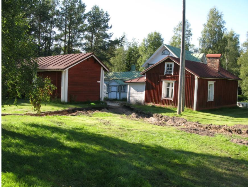
Kuva 2: digitaalikuva 126349:24, kuva Aappolan keskuspihalle päin. Kuvattu länteen. Kuvaaja: Kirsi Jylkkä-Karppinen, MV/RHO.

osan tilasta omistukseensa 1908 sisareltaan velkojen vastikkeena. Rakennus jäi Ojanperälle huvilakäyttöön. Hetimiten omistajanvaihdoksen jälkeen alkoi päärakennuksen kunnostus- ja laajennustyö, joka kesti vuosikymmenen lopulle saakka. Tässä yhteydessä asuintalo sai myös kaksikerroksisen laajennusosan koillispäätyyn. Ojanperä kuoli vuonna 1916, minkä jälkeen huvilasta tehtiin eri omistajavaihdosten kautta oopperalaulajan elämää esittelevä museo. Lopulta museo siirtyi Limingan kunnan omistukseen. 14