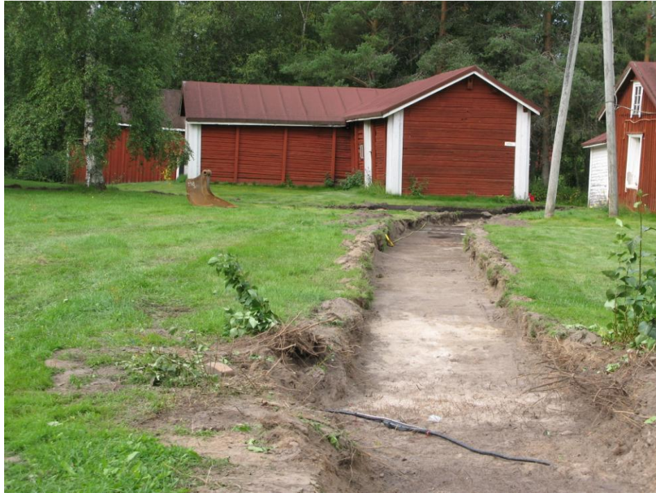
Kuva 1. Digitaalikuva 126349:19, näkymä Aappolan rakennuksille päin kuvattuna. Etualalla linja 2, rakennusten edustalla linja 1.