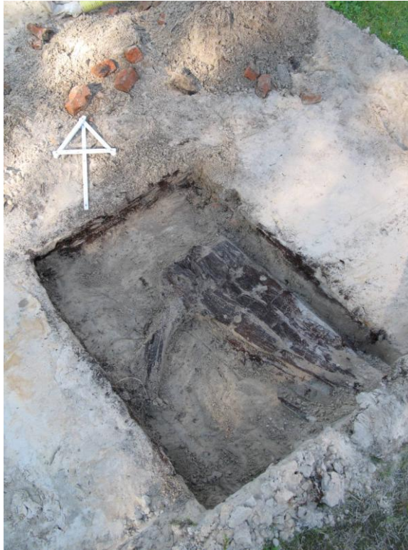
Kuva 5: digitaalikuva 126349:13. R3 linjalla 4, puureunainen kaivo/varastorakenne. Kuvattu pohjoiseen.