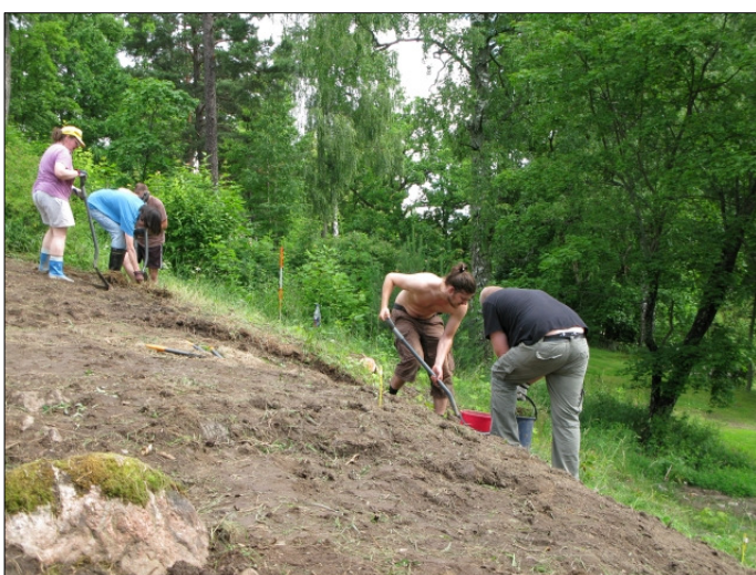
DG583:87 Työkuva, pintamaan poisto Kuvattu etelästä