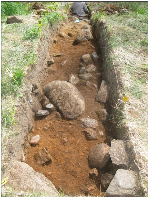
DG583:61 Koeaja 2, taso 6, länsipääty Kuvattu lännestä