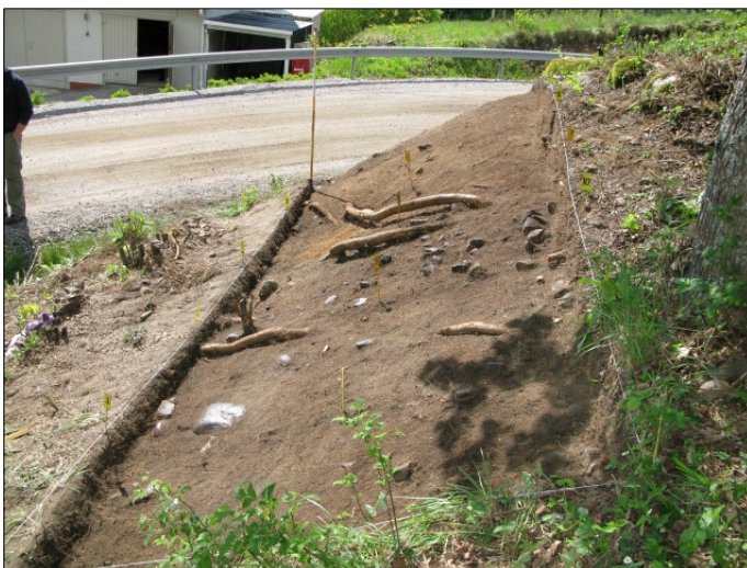
DG583:29 Alue 1, taso 3 Kuvattu pohjoisesta