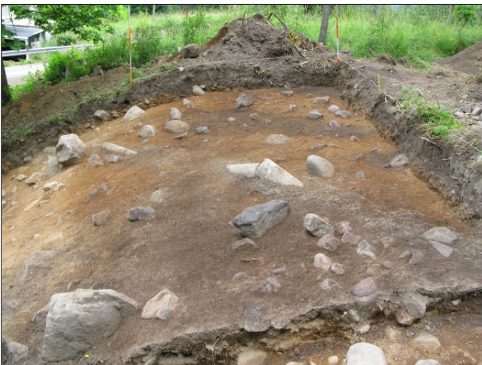
DG583:161 Alue 2, taso 2, 4992-4997/992-995 Kuvattu pohjoisesta