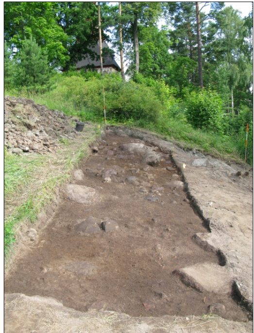
DG583:101 Alue 2, taso 2, 5007-5022/990-992 Kuvattu etelästä