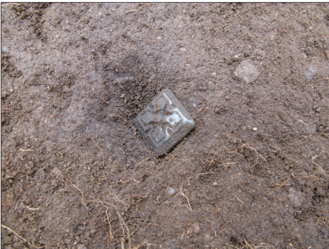
DG583:120 Vyönhela, in situ , x:5005,33 y:991,71 z:35,50 Kuvattu etelästä