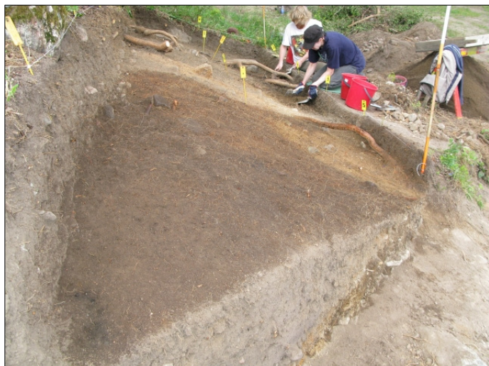
DG583:42 Alue 1, taso 5, eteläpää, kuvassa kaivajat Stephan Schulz ja Jaana Riikonen Kuvattu etelästä