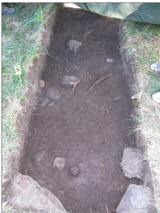
DG583:39 Koeoja 2, taso 3, länsipääty Kuvattu lännestä