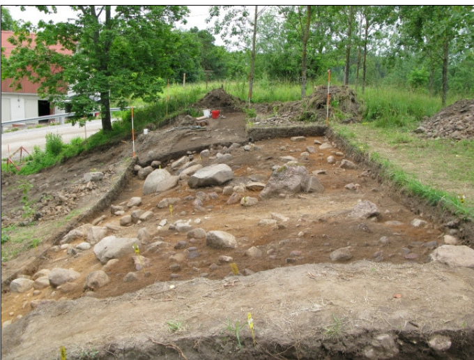
DG583:131 Alue 2, taso 3 Kuvattu pohjoisesta