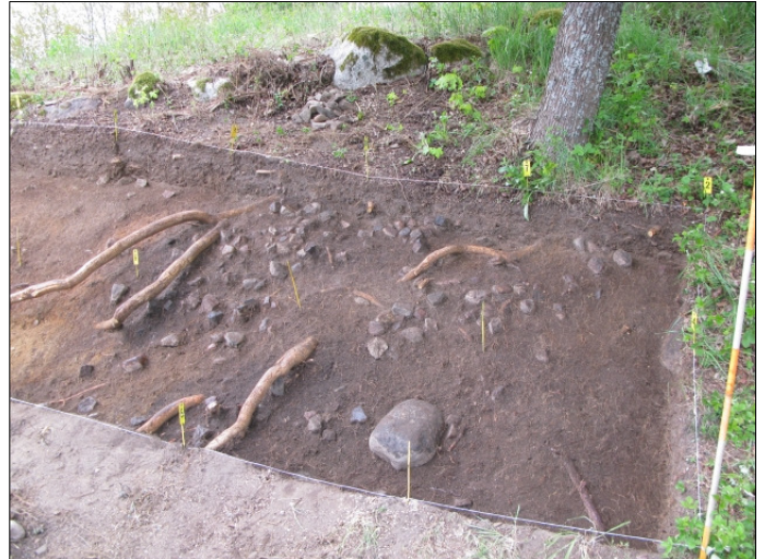
DG583:34 Alue 1, taso 4, kiveys Kuvattu idästä