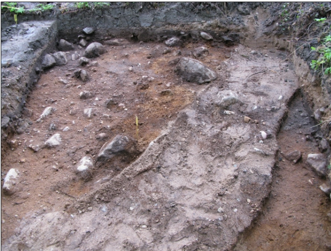
DG583:171 Alue 2, 5018-5022/990-993 Kuvattu idästä