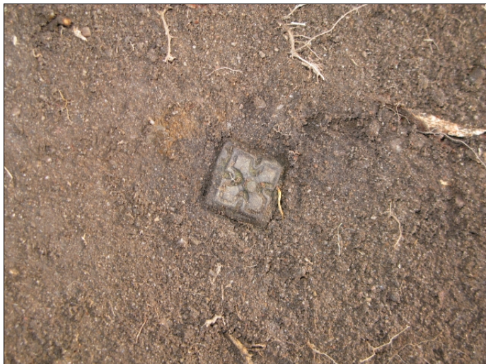
DG583:38 Pronssihela koeojasta 1, in situ , x:5006,44 y:990,59 Kuvattu etelästä