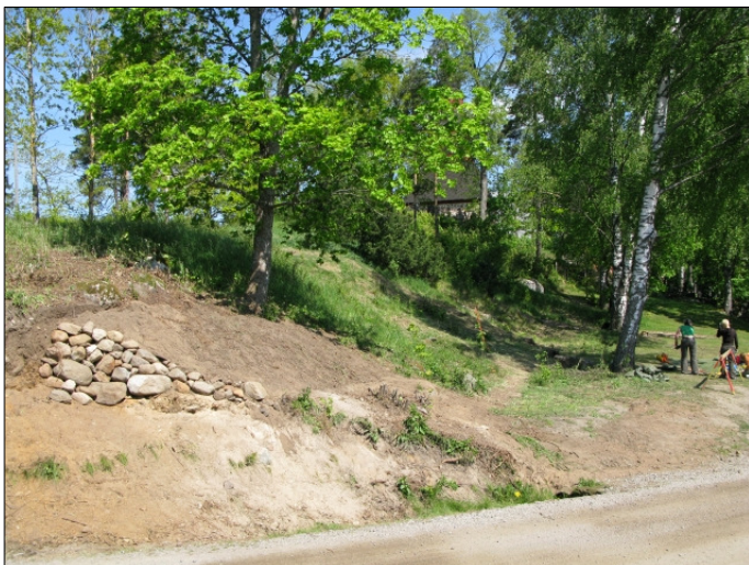
DG583:86 Kaivausalueet täytettynä Kuvattu etelästä