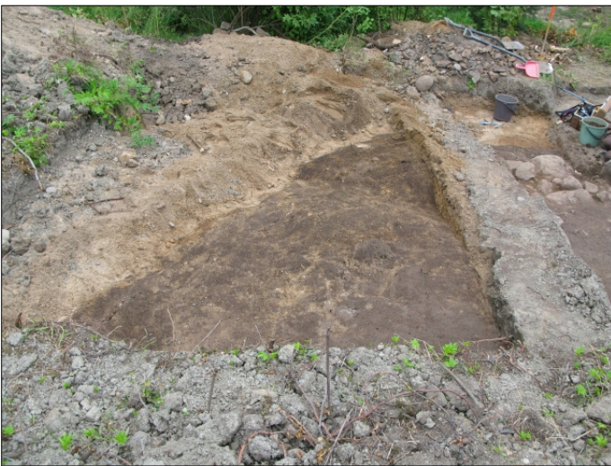
DG583:141 Alue 2, taso 2, pohjoispäädyn laajennus, Kuvattu lännestä