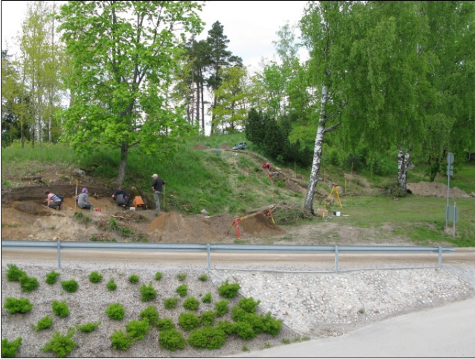
DG583:57 Yleiskuva, panoraama Kuvattu kaakosta