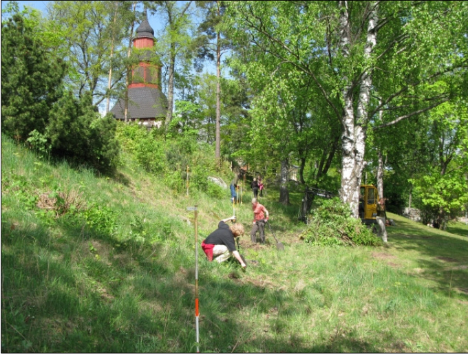
DG583:01 Yleiskuva kuvattu etelästä