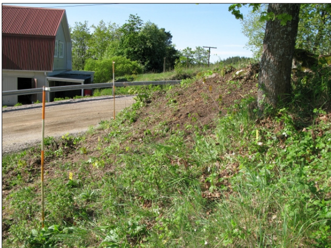
DG583:15 Alue 1 rajattuna kuvattu pohjoisesta