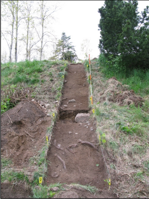
DG583:32 Koeoja 2, taso 2 Kuvattu idästä