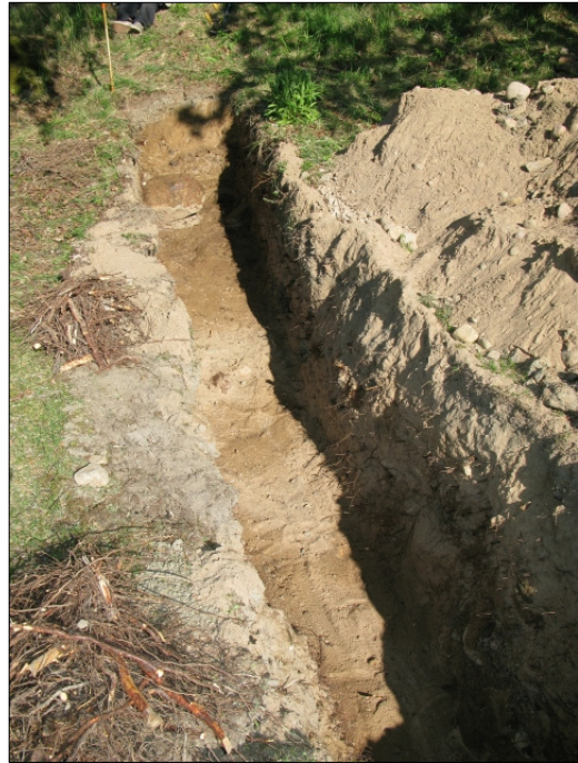
DG583:13 Koeoja 1, täytemaata kuvattu idästä