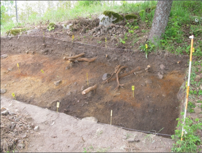
DG583:51 Alue 1, taso 6 Kuvattu koillisesta