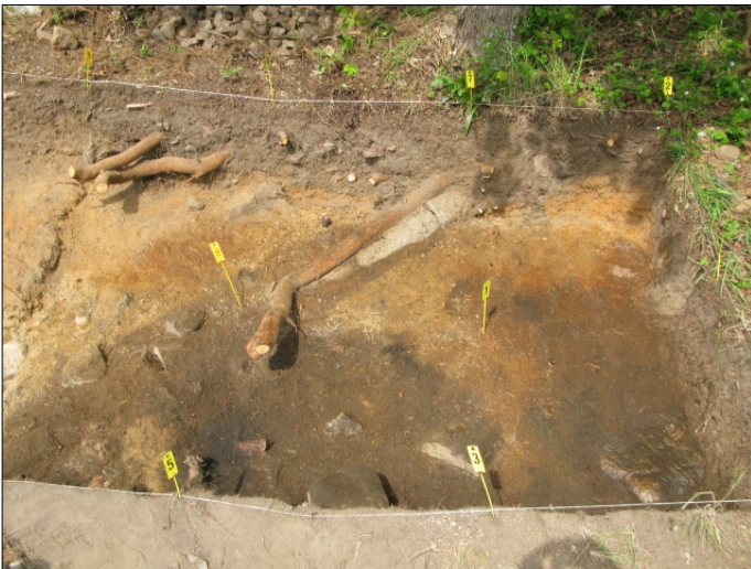
DG583:60 Alue 1, taso 7 Kuvattu idästä