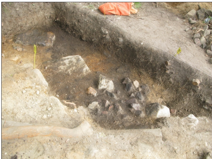
DG583:66 Alue 1, taso 8 Kuvattu lounaasta