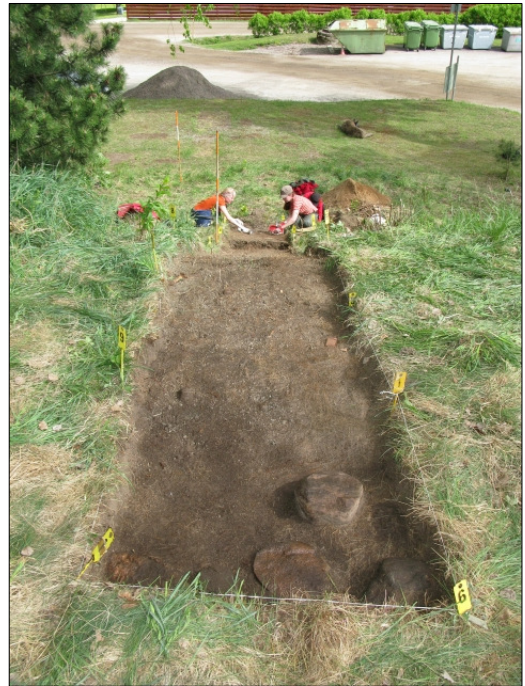
DG583:27 Koeoja 2, taso 1 Kuvattu lännestä