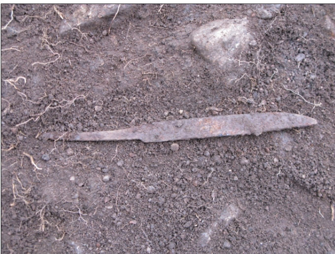
DG583:112 Veitsi ruudussa 5011/992, in situ Kuvattu pohjoisesta