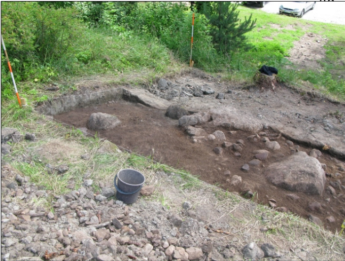
DG583:104 Alue 2, taso 2, 5007-5022/990-992 Kuvattu lounaasta