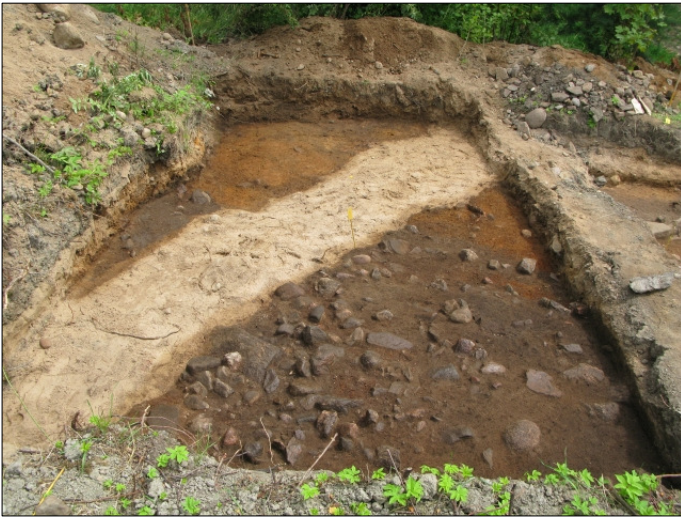
DG583:159 Alue 2, taso 3, 5018-5022/990-995 Kuvattu lännestä