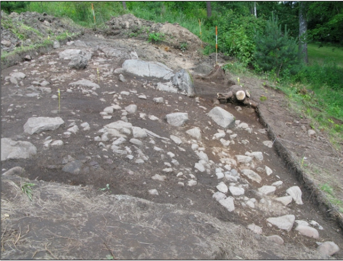
DG583:121 Alue 2, taso 2, 5007-5017/992-995 Kuvattu pohjoisesta