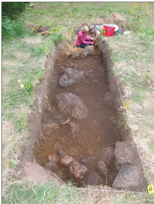
DG583:55 Koeoja 2, taso 5, länsipääty, kuvassa kaivajat Maija Lehikoinen ja Heli Etu-Sihvo Kuvattu lännestä