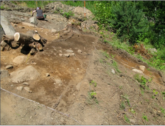
DG583:135 Alue 2, laajennus itään, taso 2, 5010-5018/995-998 Kuvattu etelästä