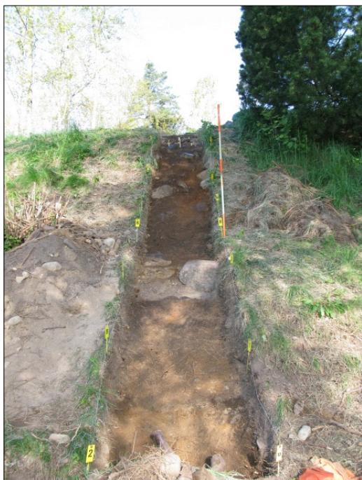
DG583:48 Koeoja 2, taso 4 Kuvattu idästä