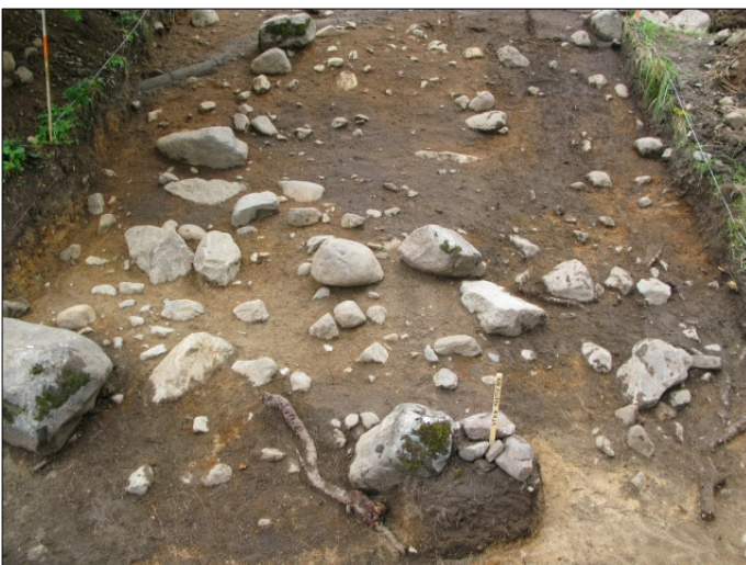
DG583:172 Alue 2, taso 2, 4992-4997/995-1001 Kuvattu idästä