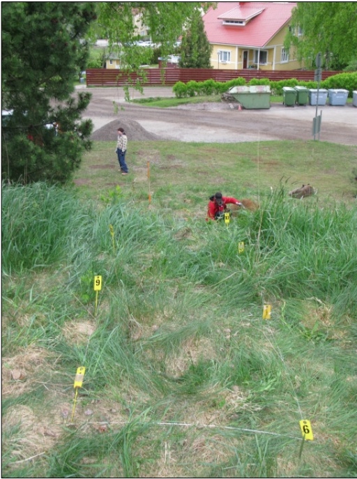
DG583:26 Koeoja 2, ennen avaamista Kuvattu lännestä