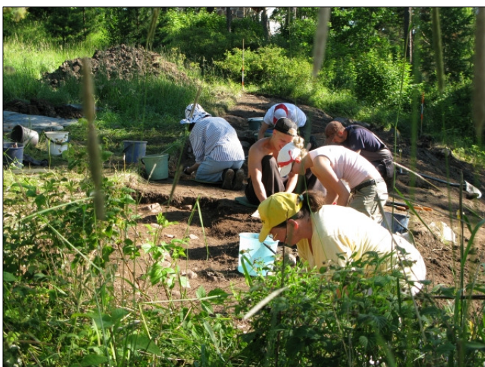
DG583:95 Työkuva Kuvattu etelästä