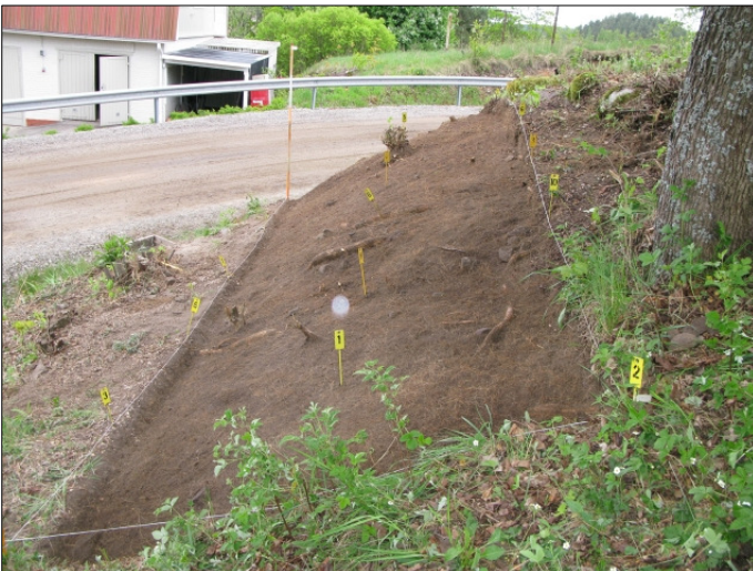
DG583:24 Alue 1, taso 2 kuvattu pohjoisesta