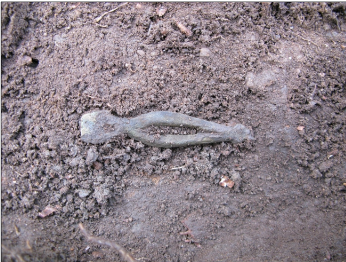
DG583:118 Päätehela, in situ , x:5011,35 y:994,36 z:35,01 Kuvattu pohjoisesta