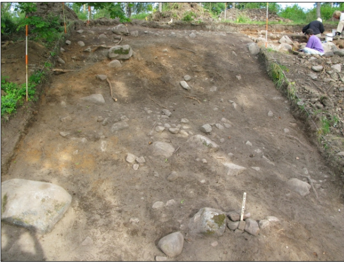
DG583:137 Alue 2, eteläinen laajennus, taso 1, 4992-4997/992-1001 Kuvattu idästä