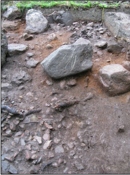
DG583:163 Alue 2, taso 4, 5015-5018/990-995 Kuvattu idästä