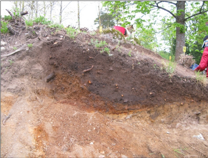
DG583:19 Alue 1 eteläprofiili, tien leikkaus kuvattu etelästä