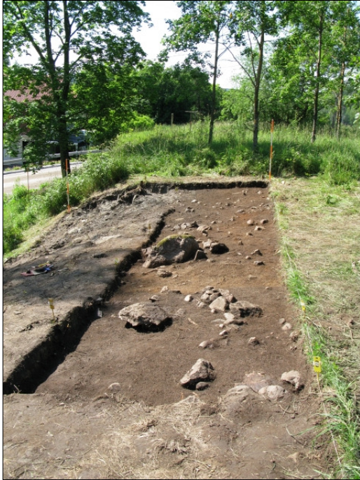
DG583:98 Alue 2, taso 2, 4987-5006/990-992 Kuvattu pohjoisesta