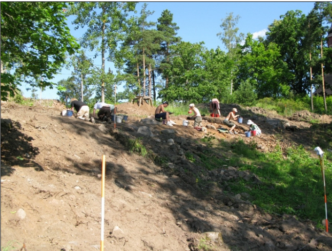
DG583:127 Työkuva Kuvattu lounaasta