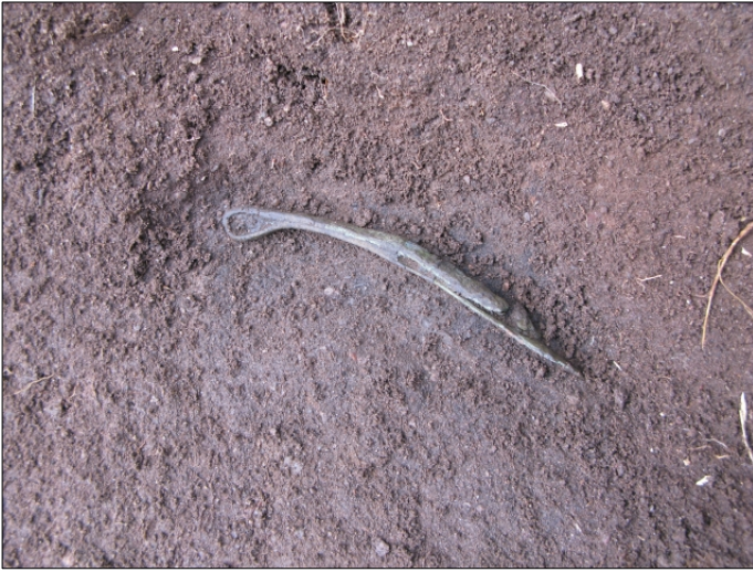
DG583:145 Pronssinen vyönpäähela, in situ , x:5019,15 y:989,98 z:36,48 Kuvattu pohjoisesta