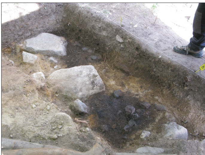
DG583:78 Alue 1, taso 9 Kuvattu lounaasta