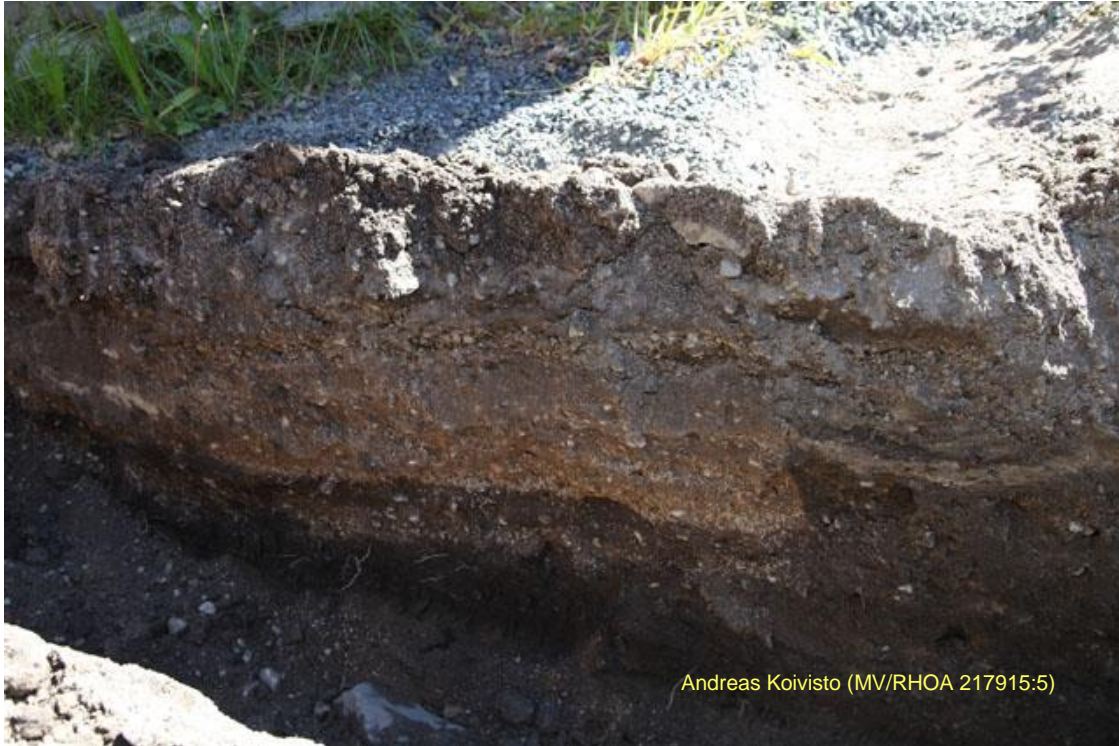
Kuva 3. Kaivannon pohjoispäädyn länsiprofiilissa oli säilynyt kulttuurikerrosta.

Rauman Kauppakatu 19 tontilla suoritettiin sadevesiviemäriä varten kaivutöitä, joiden aikana maahan kajottiin. Maata avattiin noin 40 metrin matkalta metrin levyisenä ojana, joka kulki idästä tontin Isopoikkikadun puoleisesta päästä lähes Kauppakadun puoleiseen pohjoispäähän asti. Suurelta osin oja kaivettiin jo ainakin kertaalleen kaivetulle alueelle, mutta aivan tontin itä- ja pohjoispäässä oli arkeologisesti koskemattomia kerroksia. Rakenteita ei alueella havaittu.