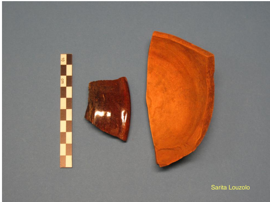
Kuva 2. Purkukerroksesta talteen otetut punasaviastian reuna- ja pohjapalat (KM 2010035: 2 ja 3).

Kesän 2010 valvonnan avulla pyrittiin selvittämään, oliko Rauman Kauppakatu 19 tontilla säilynyt vanhoja historiallisia rakenteita tai maakerroksia. Koska tontilla oli kaivettu useasti jo aiemmin, suurin osa vanhoista maakerroksista oli täysin tuhoutuneita ja kerrokset sekoittuneita. Aivan tontin itä- ja pohjoispäässä oli kuitenkin säilyneitä kulttuurikerroksia.