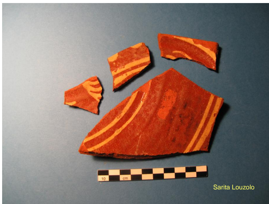
Kuva x. Kaivannon itäpään kulttuurikerroksesta löydetyn boluskuvioidun punasaviastian (KM 2010035: 3) palasia.

Kauppakatu 19 tontille kaivetulta alueelta ei havaittu vanhoja säilyneitä rakenteita. Alueen maakerrokset olivat pääasiassa hyvin sekoittuneita ja kulttuurikerrokset täysin tuhoutuneita. Aivan ojan itä- ja pohjoispäässä oli kuitenkin säilynyt arkeologisesti koskemattomia kerroksia. Ojan itäpäässä oli 30cm paksun pintasoran ja pintamullan alla noin 30 cm paksu sekoittunut purkukerros, jossa oli sekoittuneena löytöaineistoa 1700–1800-luvuilta nykypäivään. Tämän kerroksen alla oli kaksi erilaista kulttuurikerrosta, jotka ajoittunevat 1600–1800-luvuille. Ojan pohjoispäässä erottui noin 65 cm paksuudelta neljä erilaista sorakerrosta. Sorakerrosten alla oli savensekainen mustanruskea kulttuurikerros, josta ei tullut löytöjä.