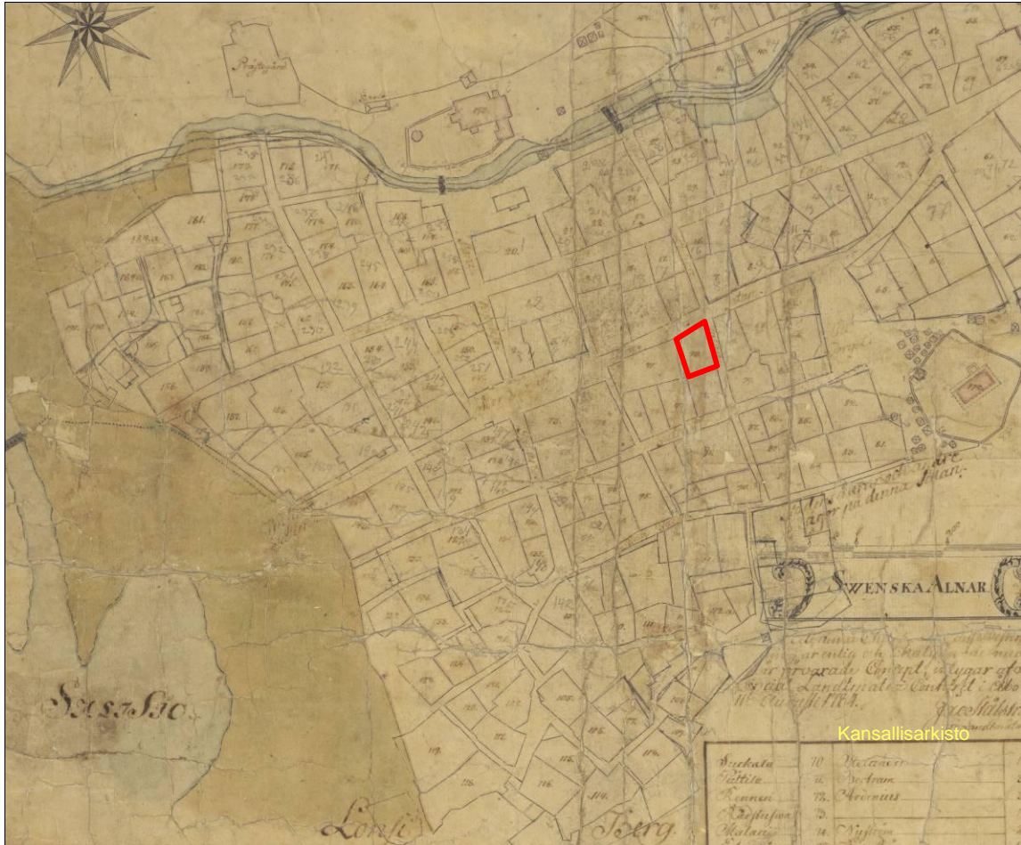
Kuva 1. Ote vuoden 1756 Raumaa kuvaavasta kartasta. Kauppakatu 19 tontti merkitty karttaan punaisella.

Kauppakatu 19 sijaitsee Vanhassa Raumassa nykyisen Kauppatorin ja Kalatorin välisellä alueella. Tontti rajautuu pohjoisessa Kauppakatuun ja idässä Isoipoikkikatuun.