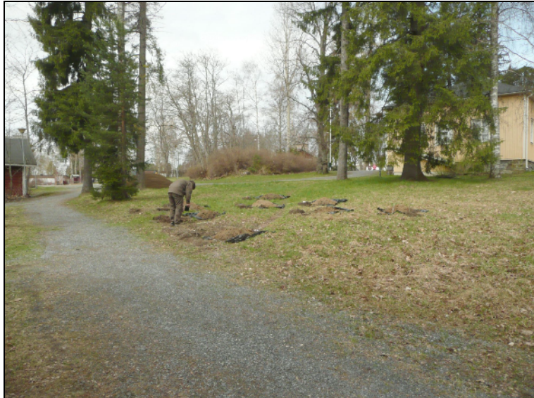
Koekuopitusalue kuvan keskellä, oik. Haiharan kartano. Alla vastakkaisesta suunnasta.