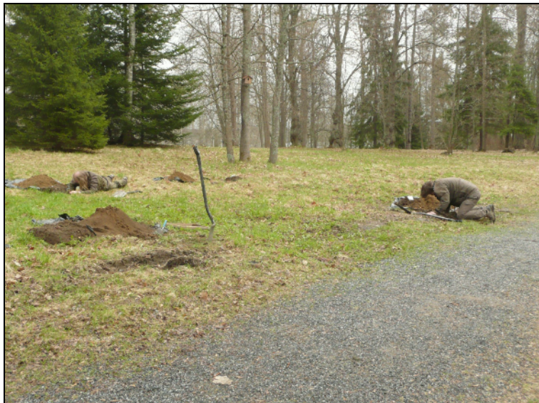
Koekuopitus käynnissä. Kuoppien sisältöä tutkitaan. kuvattu itään. Alla: T Sepänmaa tutkii kuoppaa.