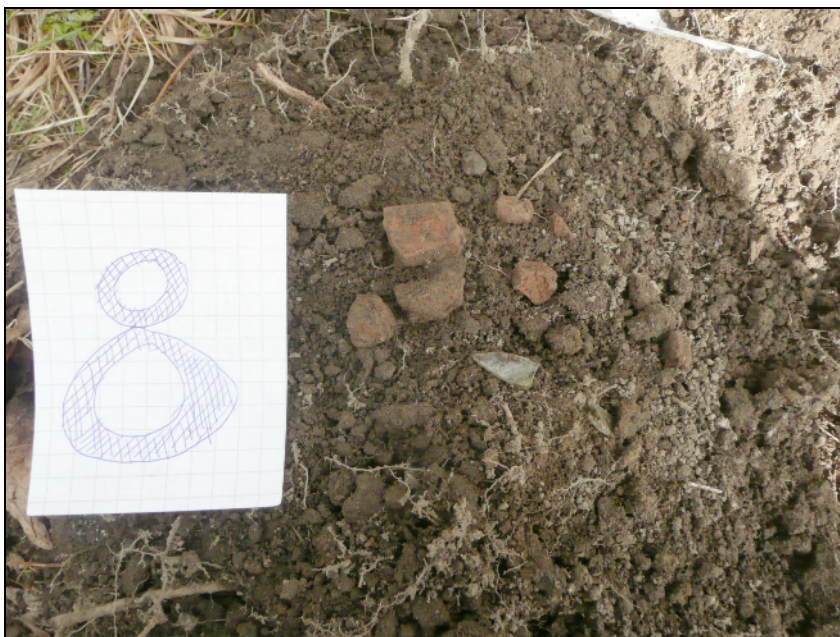
kk 8 pinta