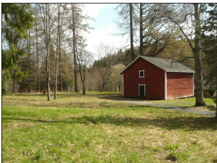
Paikka tutkimuksen päätyttyä. Kuopat peitetty.