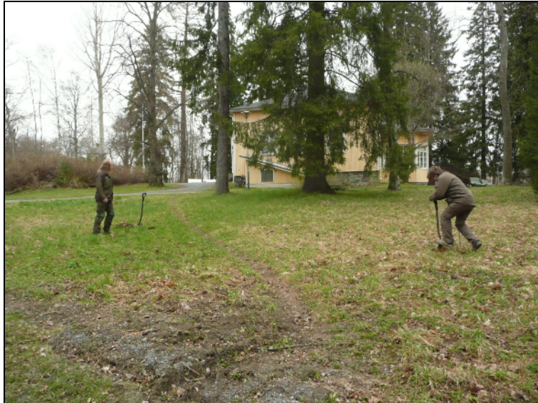
Koekuopitus alkamassa. Taustalla Haiharan kartano. Kuvattu pohjoiseen.