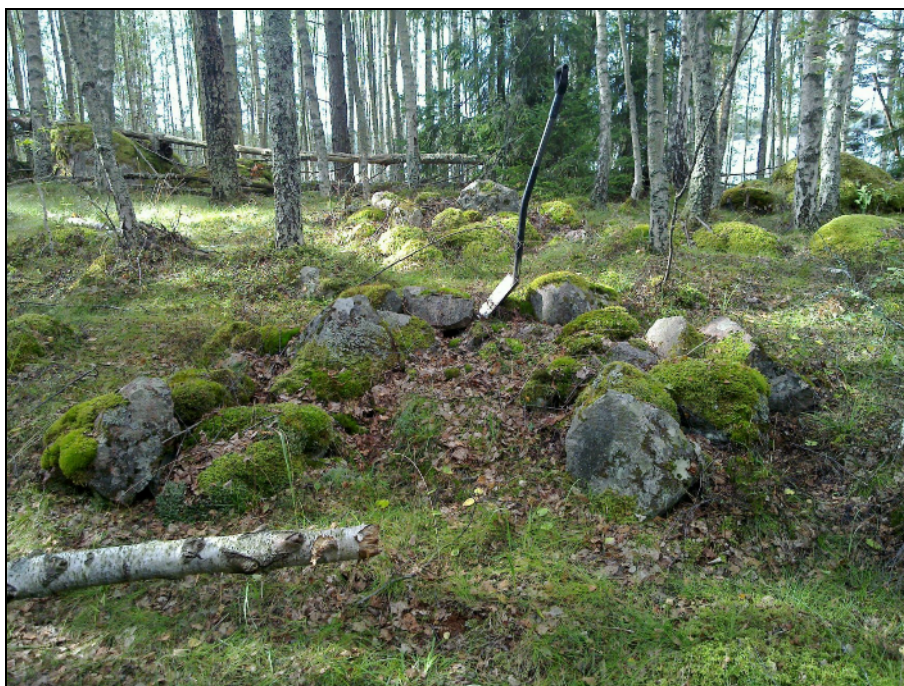
Mahd. uuninjäännne. Takana kiviraunio. Länteen.