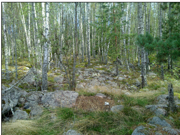
Saaren länsi- ja keskiosan kallioiden välistä kivikkoa.