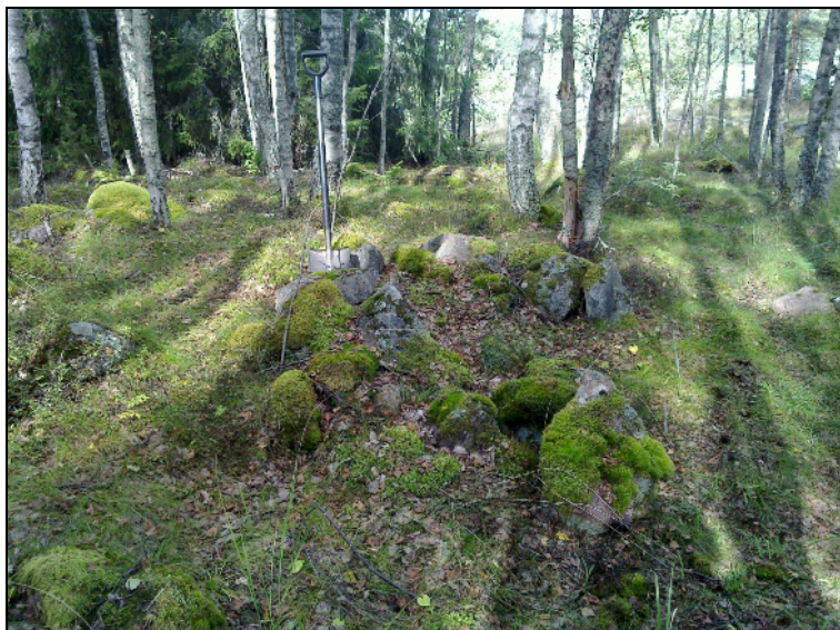
Mahd uunin jäännne. pohjois-luoteeseen. Alla itään.