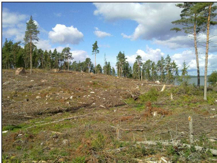
Koillisosaa, saaren korkein mäki, länsi-luoteeseen