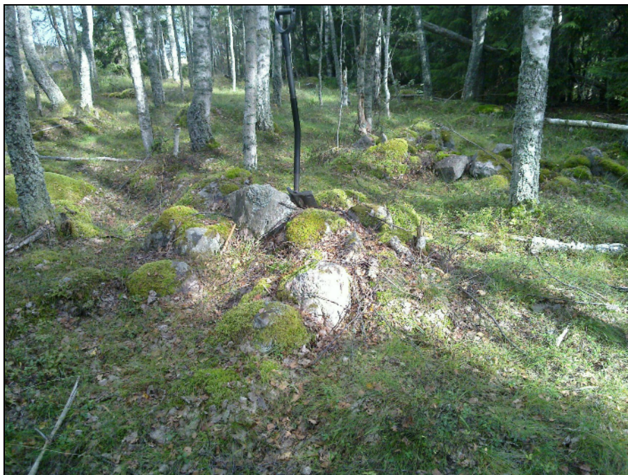
Kiviröykkiö sen takana oik. mahd. uuninraunio. Kuvattu koilliseen.