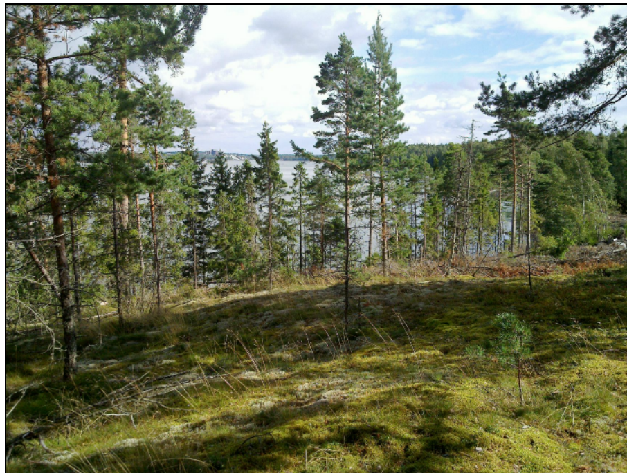
Näkymä saaren koillisosasta, korkeimman mäen laelta koilliseen.