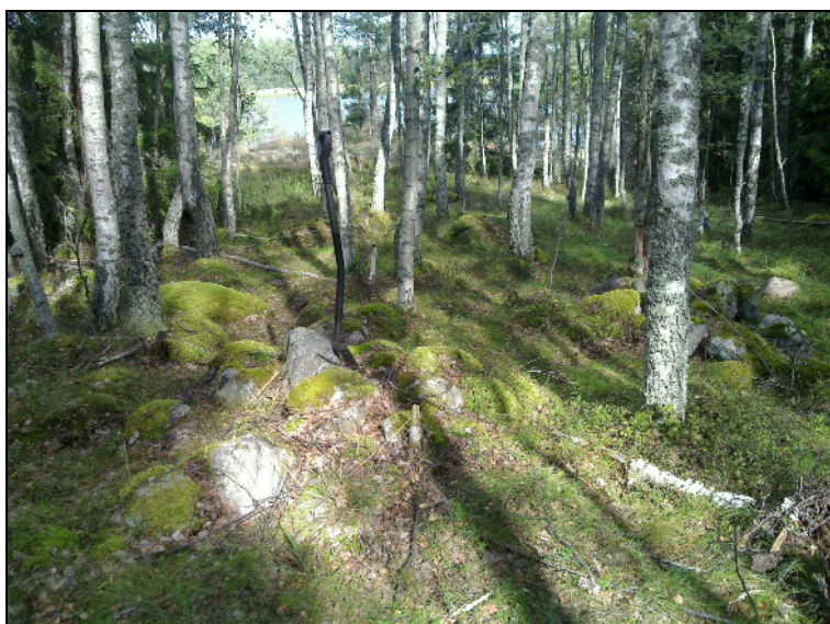
Kiviraunio (uuni koivun takana oik). Pohjoiseen.