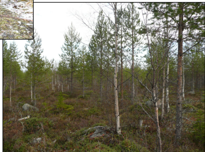
Oik: Onkalon maastoa voimalapaikan liepeillä