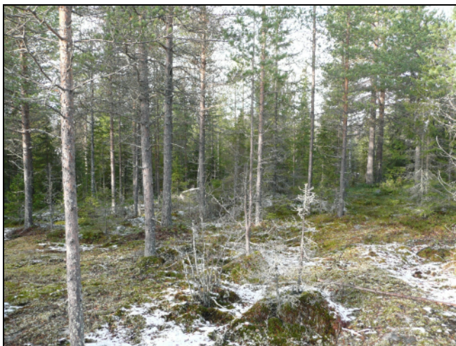
Yllä: maastoa Putaankankaan voimalapaikalla.

Timo Jussila Hannu Poutiaisen materiaalista.