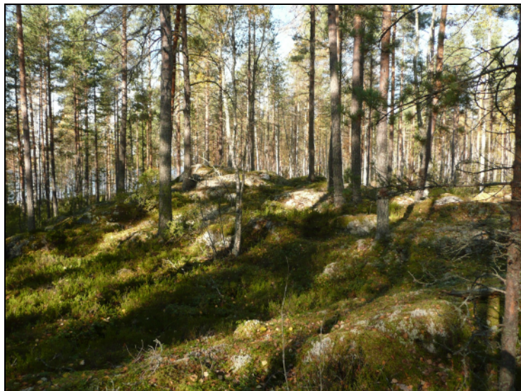
Kaarankajärven länsirannan niemen aluetta. Matalaa kalliota ja moreenia.