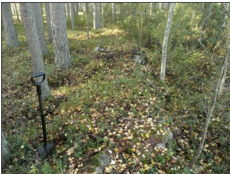
Sammaloitunutta kiviainan jäännettä