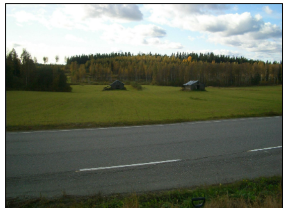
Pellossa Ancyclusjärven rantatörmä alueen luoteiskolkassa, Karpinlamminpuron itäpuolella 120 m tason molemmin puolin.

Alueelta tunnetaan kaksi kiviesineen löytöpaikkaa. Kumpikaan näistä paikoista ei liity kivikautiseen asuinpaikkaan vaan ne ovat hukattuja esineitä tai sekundaarisia löytöpaikkoja. Tarkastin alueen luoteisosan peltorinteet 115 m tason alapuolelta. Osa pelloista oli nurmella joten niistä en havaintoja saanut, osa sängellä josta kyllä välttävästi kykeni pellowpintaa havainnoimaan. Koekuopitin luoteiskolkkan vähäisiä metsämaita paikoin varsin tiheästäkin. Pihamaita en tutkinut. Kirkonkylän tasal- tasalla tarkastin Rantakylän rakentamattoman rannan osan: maasto siellä varsin kivistä. Alueen