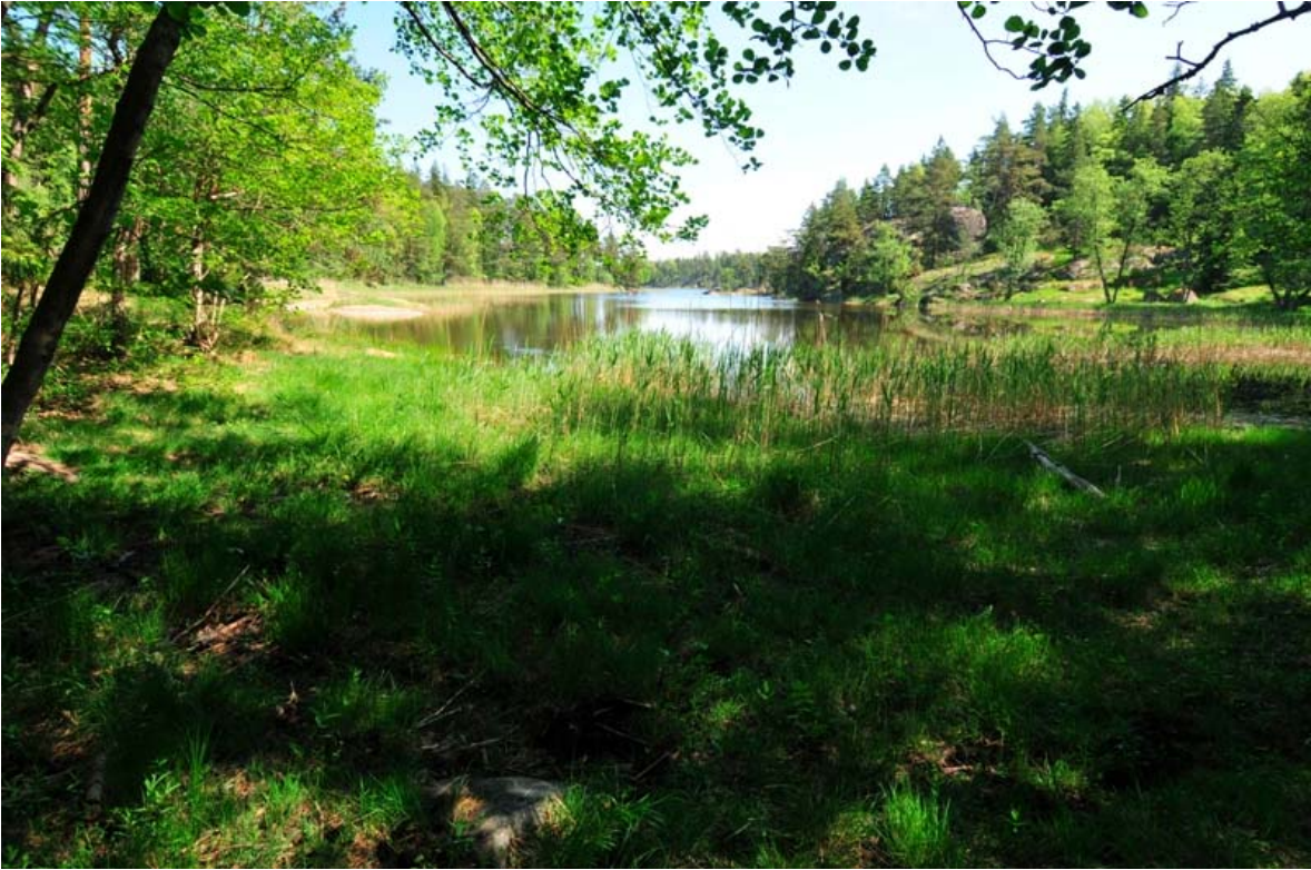
Kirkkonummi Lillkanskogdraget. Näkymää vetouran itäpäädästä kohti Lillkanskogvikenia. Kuvattu lännestä. (DG2070:2)