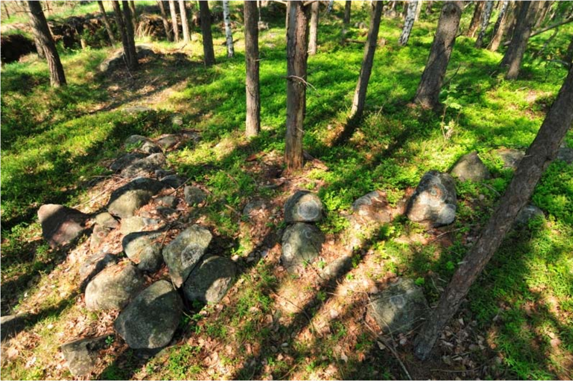
Kirkkonummi Ryshamnen. Kivijalka kuvattuna lounaasta. (DG2071:1)