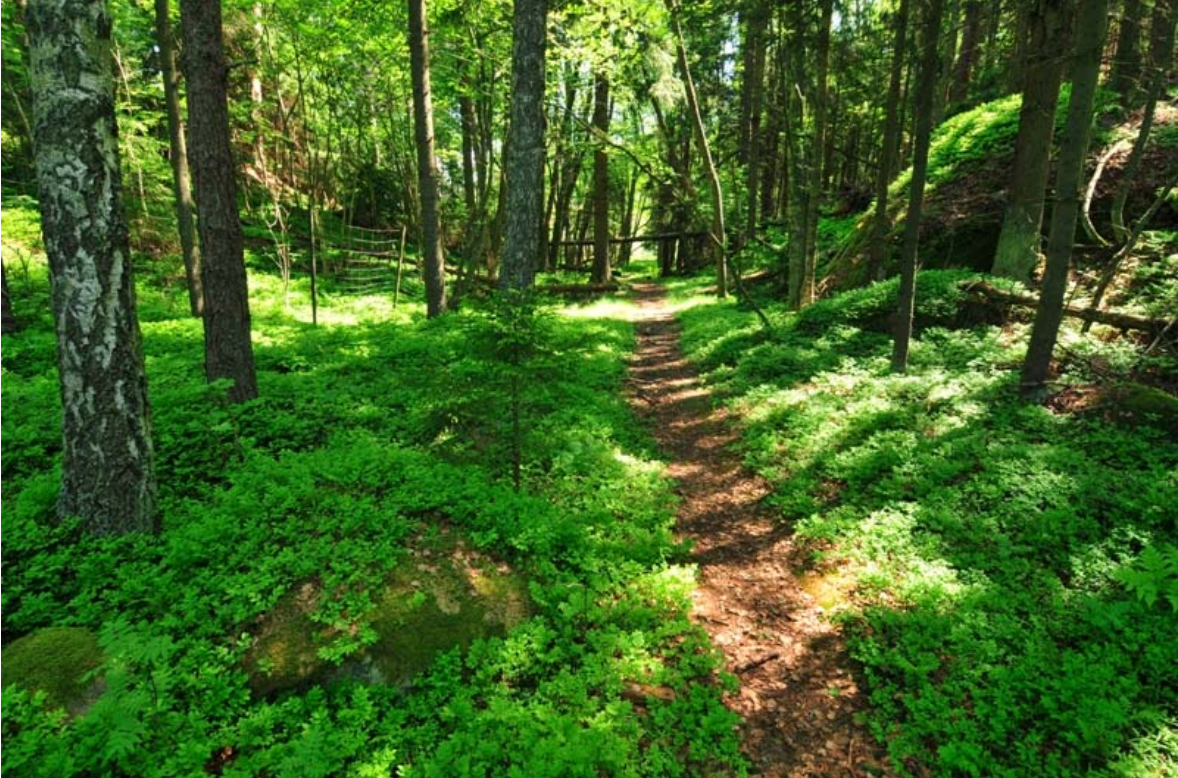
Kirkkonummi Lillkanskogdraget. Veneenvetopaikka kuvattuna idästä. Kahden kallion välissä oleva vetoura on nykyisin metsittynyt. (DG2070:1)