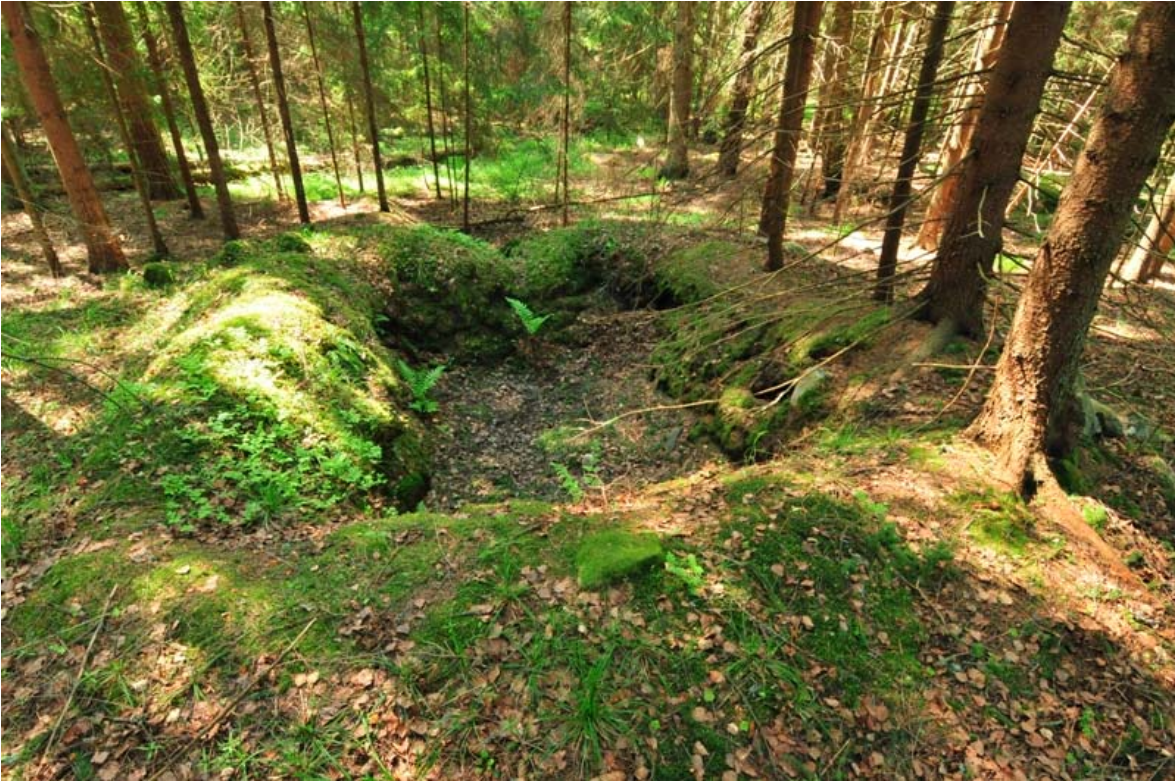
Kirkkonummi Lillkanskogviken. Kellarin pohja kuvattuna pohjoisesta. (DG2069:1)