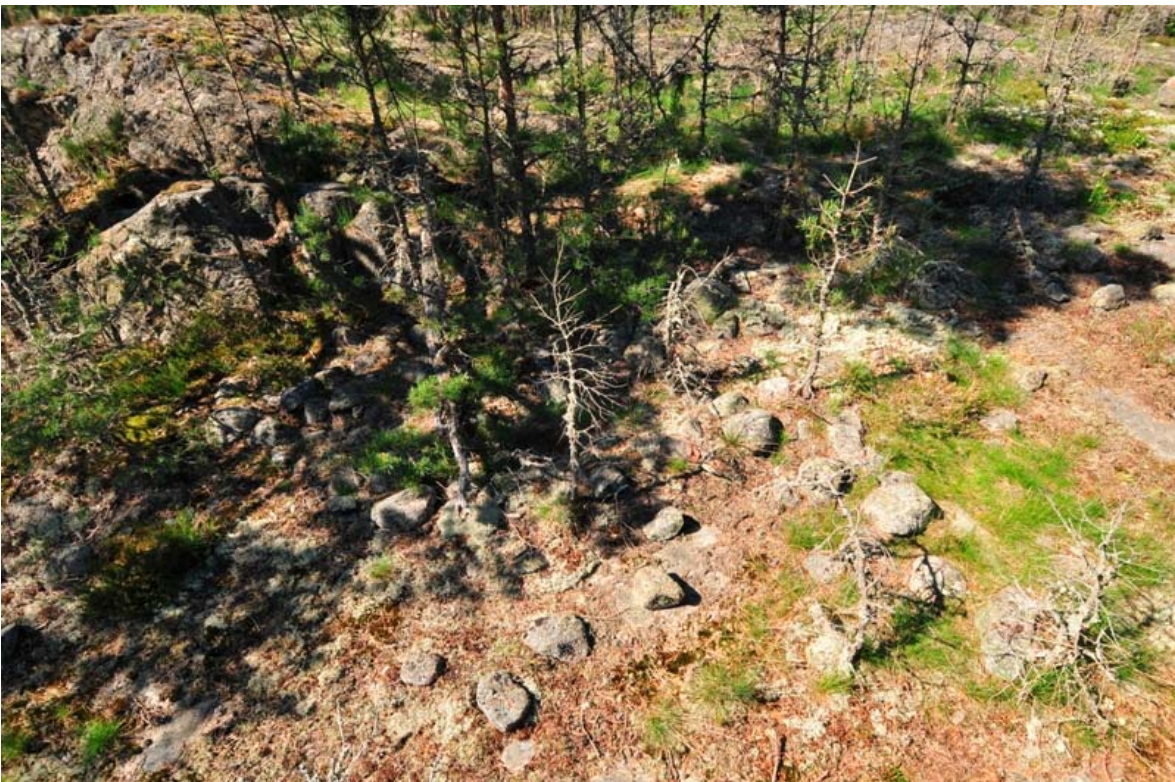
Kirkkonummi Långmossen. Säilynyttä røykkiökiveystä. Kuvattu etelästä. (DG2072:2)