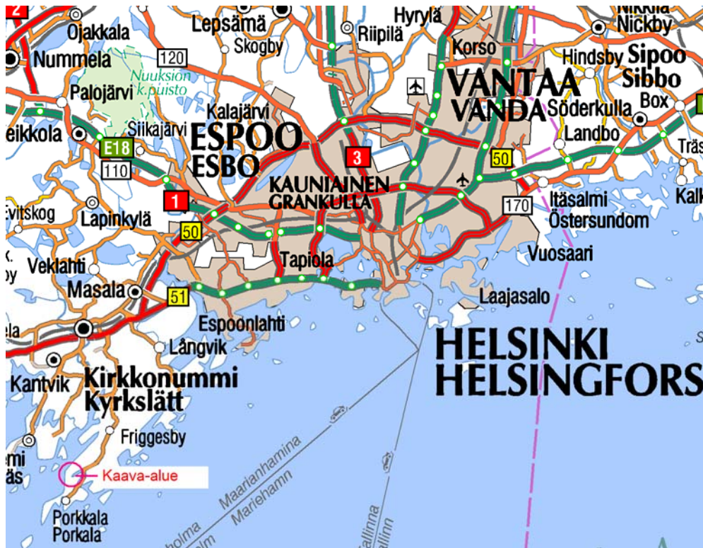
Inventointialueen sijainti (ote tiekartasta, ei mittakaavassa)