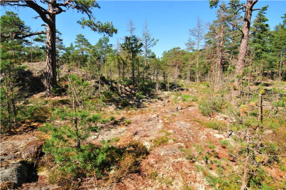
Kirkkonummi Långmossen. Hajonnutta røykkiökiveystä kalliolla. Kuvattu lounaasta. (DG2072:1)